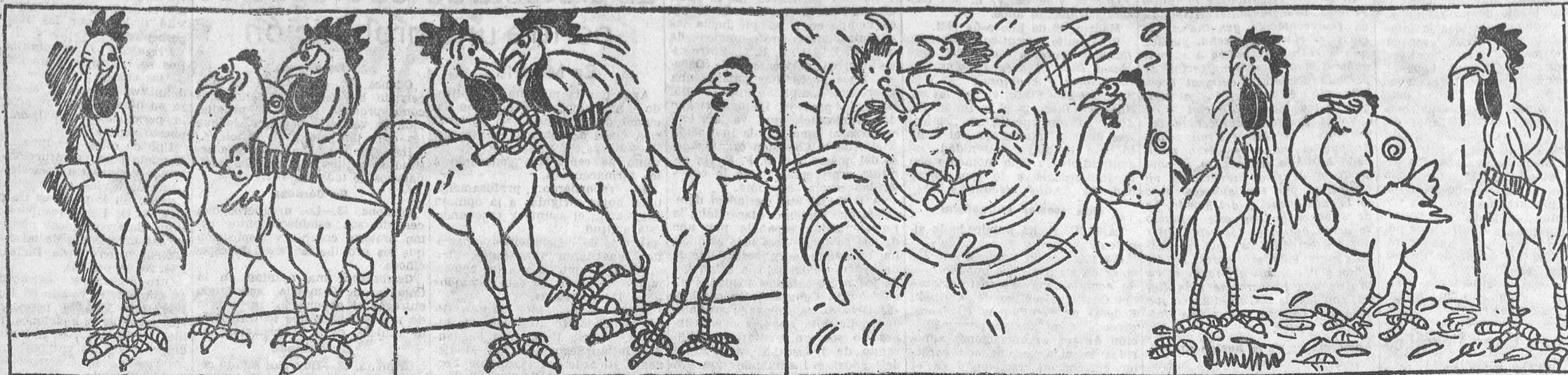
—¡Oh, insolente! ¡Timarse contigo! ¡V en mi cresta!