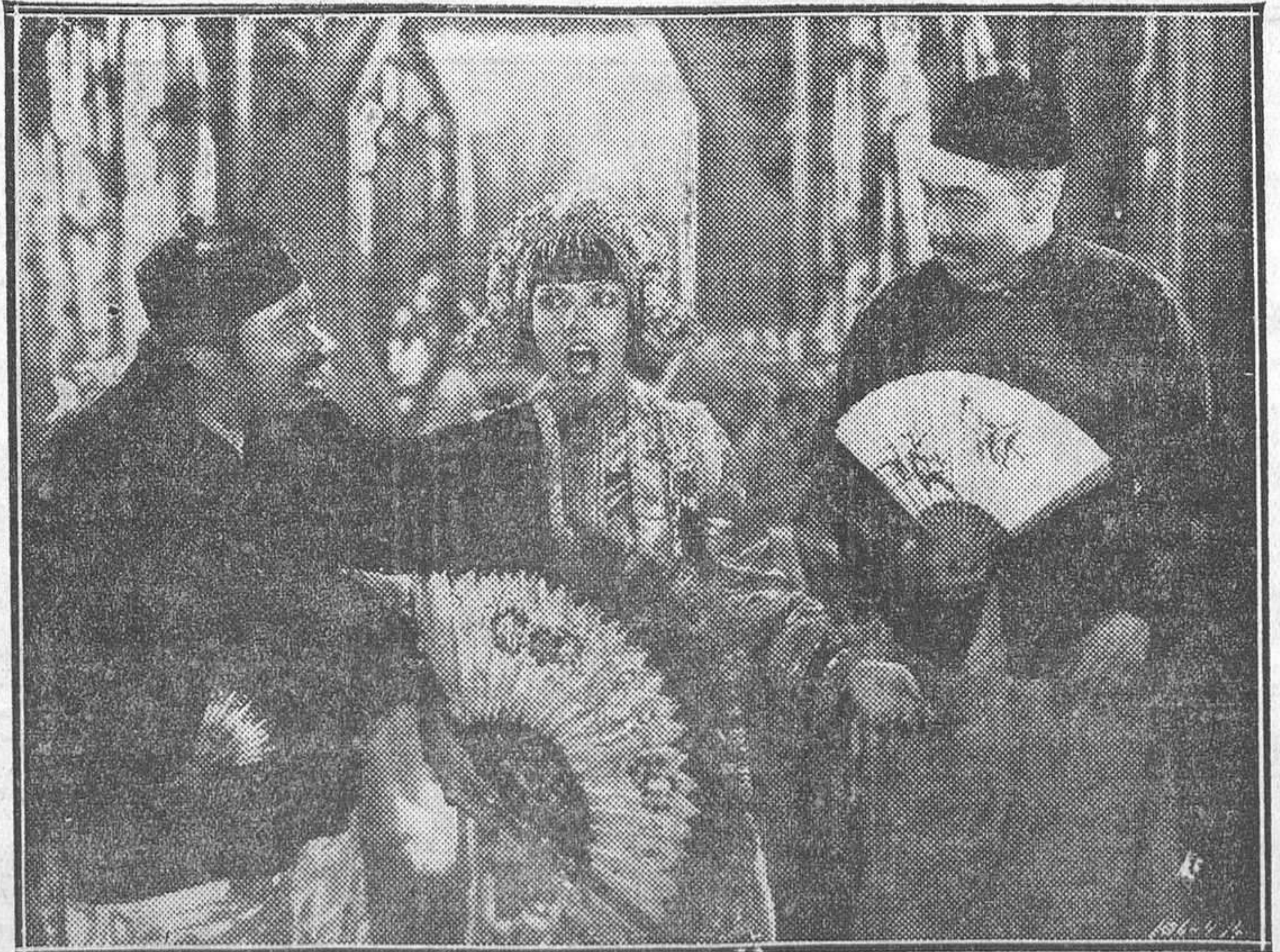
LUPE VELEZ EN LA PELICULA HABLADA EN ESPAÑOL «ORIENTE Y OCCIDENTE», QUE EL LUNES SE ESTRENA EN EL PALACIO DE LA PRENSA