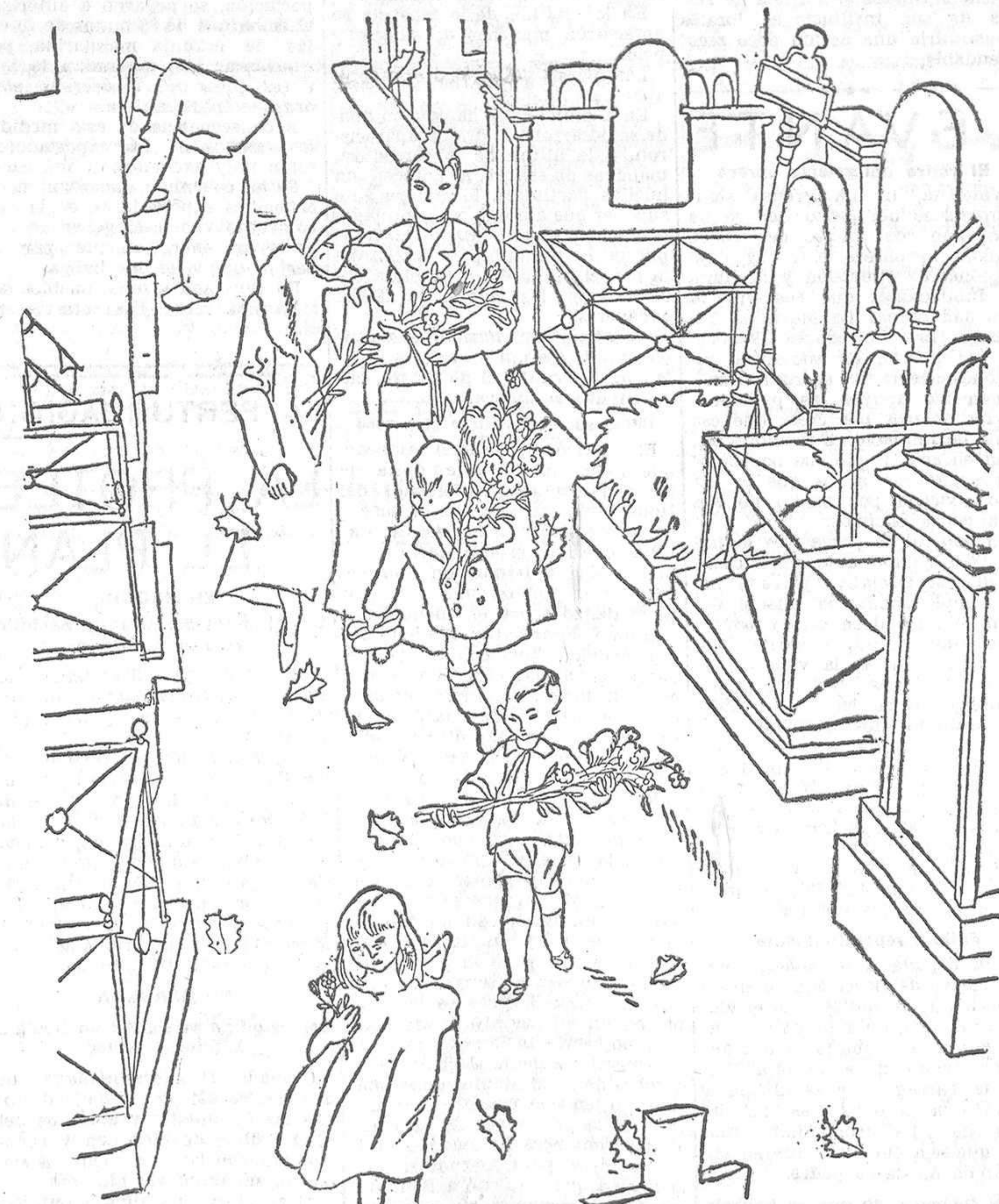
(Dibujo de Carlos S. de Tejada.)

En ninguna parte del Mundo está tan arraigado el culto a los muertos como en Francia. En ese día puede decirse que los muertos viven, porque ocupan a toda la inmensa ciudad.