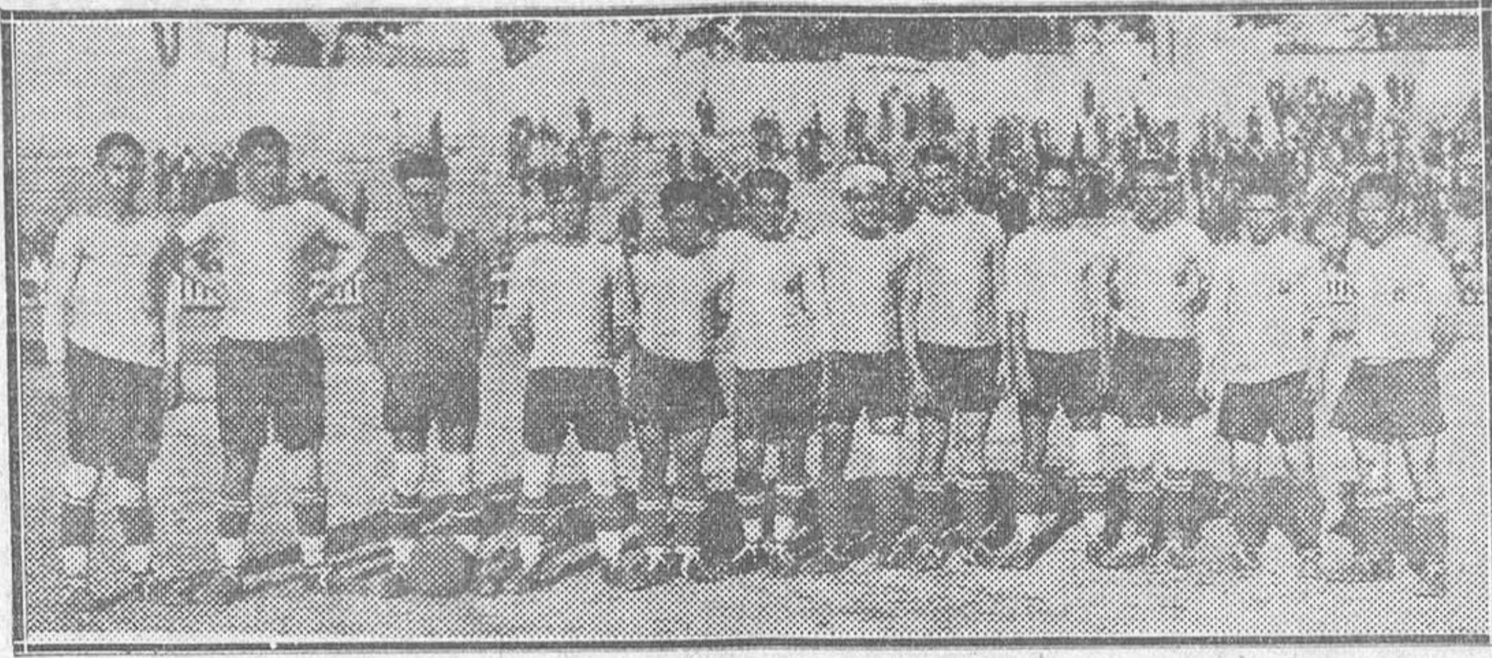
El equipo de la Agrupación Deportiva Tranviaria, que actuó ayer frente al Madrid F. C.