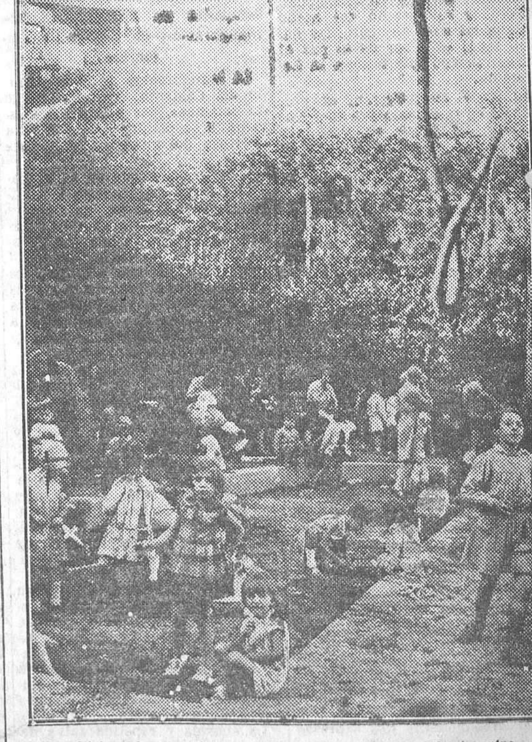
He ahí los placeres del mar, disfrutados en pleno Montmartre por los pequeños colegiales de París que no pueden permitirse el lujo de ir a las playas de verdad.