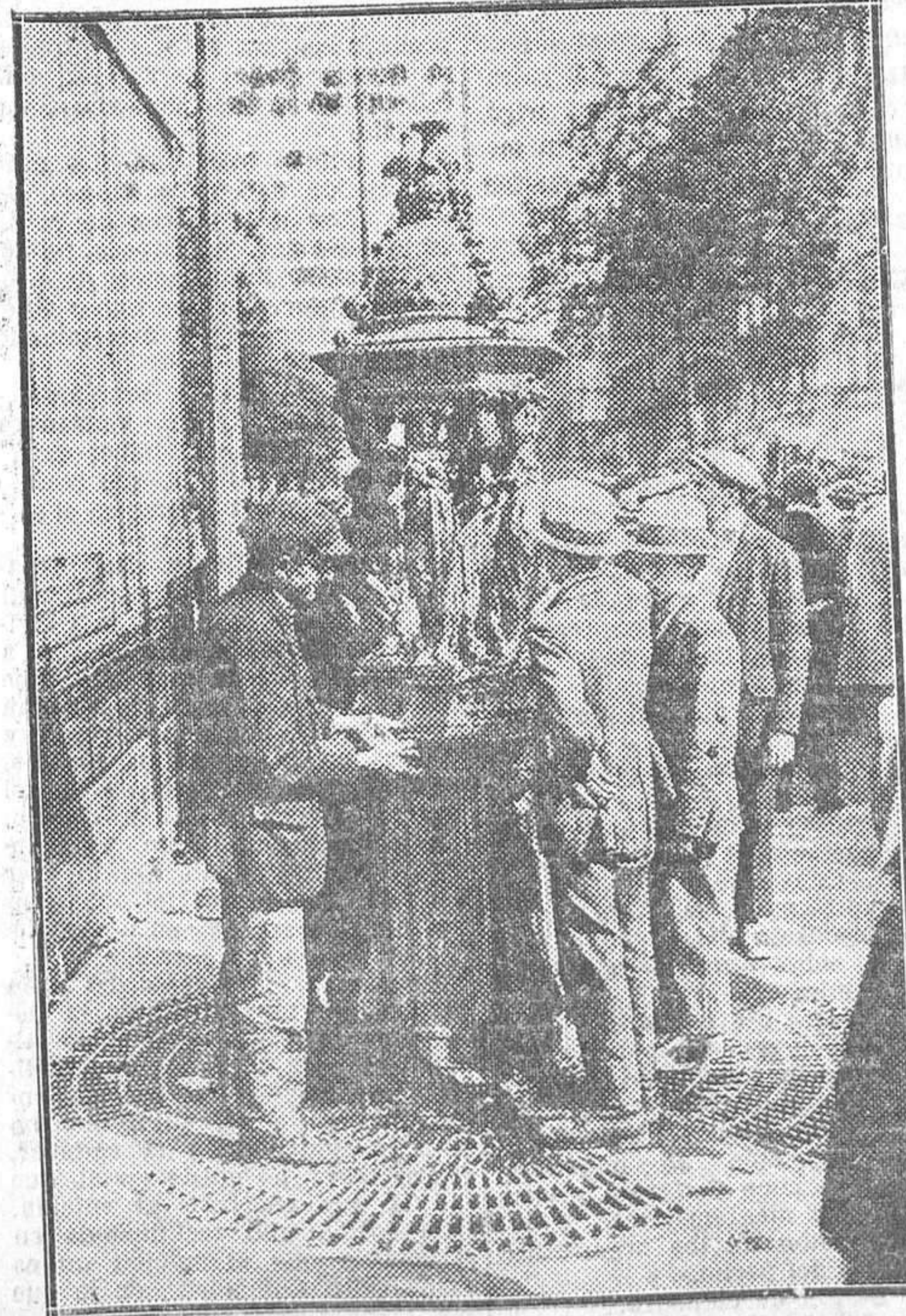
El calor en París. Durante la ola de fuego última los ciudadanos rodean las fuentes para saciar su sed con los vasos de metal.