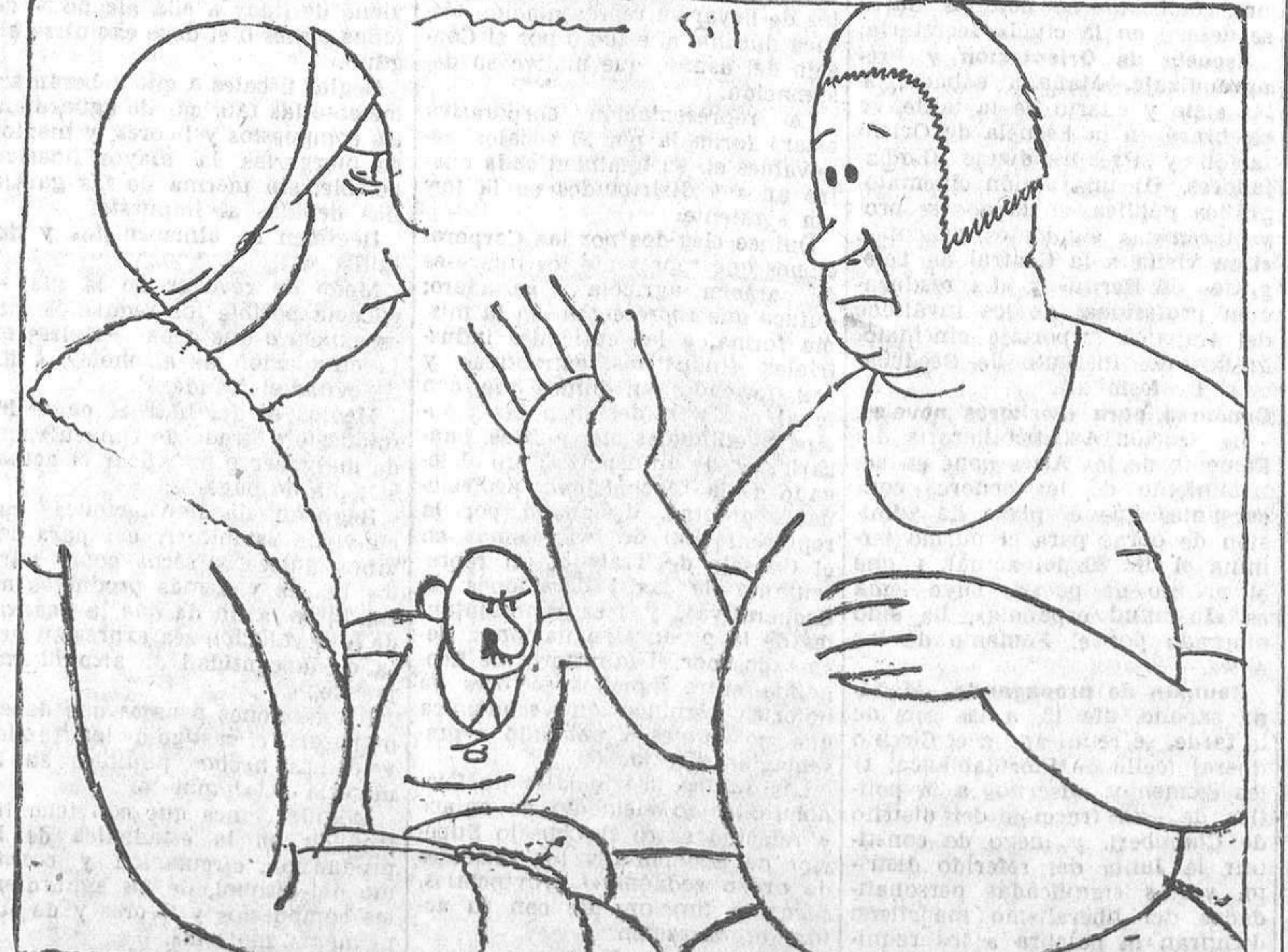
—Sí, señora; un veraneo delicioso: calor, mucho calor. En cambio, aquí en Madrid, frío cuando nos marchamos y frío cuando regresamos.

Lubeck, 11.—Ha terminado el informe técnico abierto a raíz del escándalo producido por la vacuna aplicada en esta ciudad a varios niños y que acarrió la muerte a 70 de ellos. El informe determina que la vacuna, remitida de Francia, se encontraba en excelentes condiciones para su aplicación, y que todo lo ocurrido es únicamente imputable a los facultativos de Lubeck que la aplicaron. Una información posterior determinará el origen y alcance de estos errores.