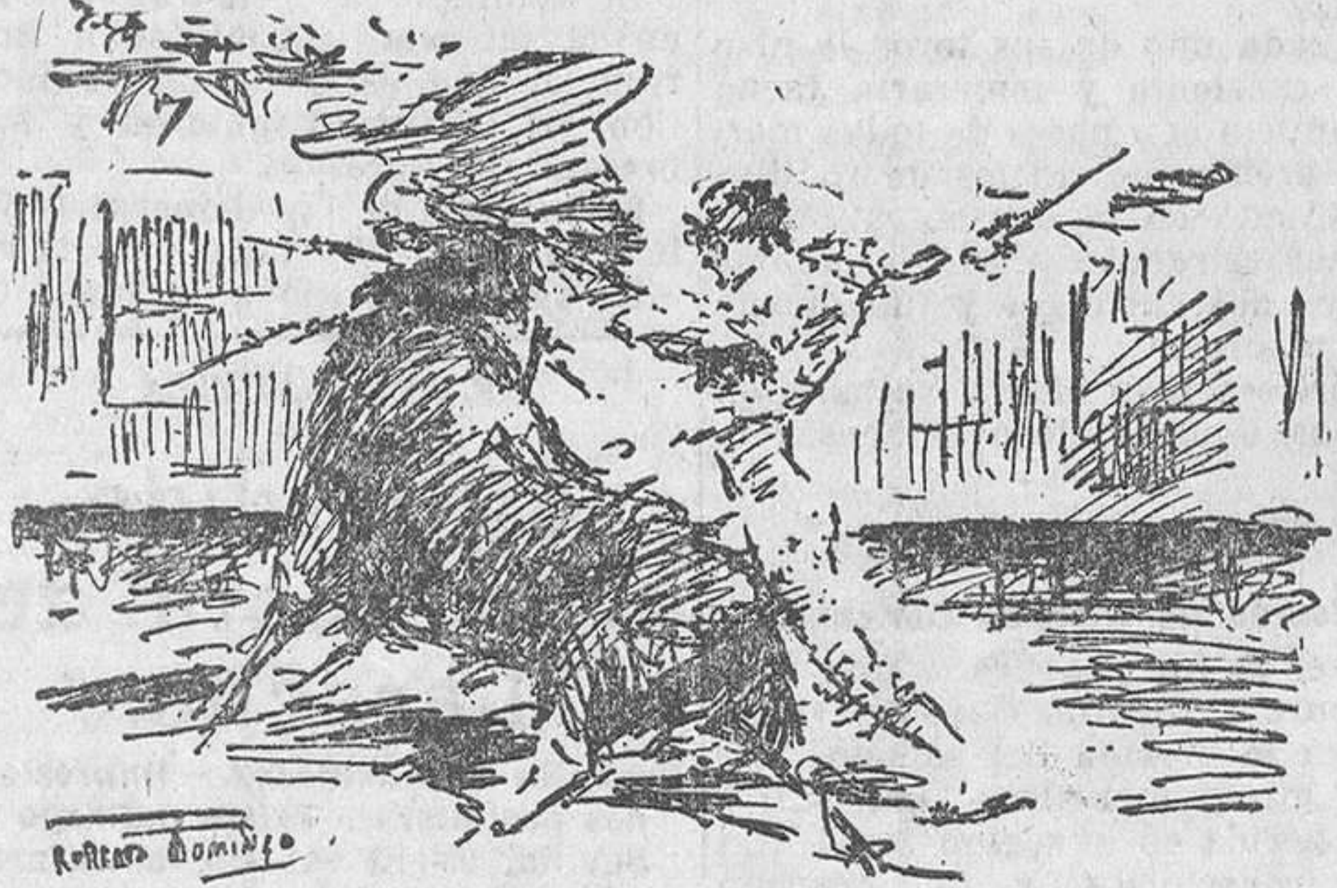
EL DOMINGO, EN MADRID.—Fortuna en un pase en el cuarto toro

Con amenaza de lluvia... y aun con sus poquitas gotas sobre los pacienzudos, bienaventurados y admirables aficionados a la fiesta taurina, se celebró el domingo la novena corrida de abono, en la que Fortuna, Chicuelo y Cagancho despacharon seis reses del marqués de Villamarta, vecino de Jerez de la Frontera, según rezan los carteles.