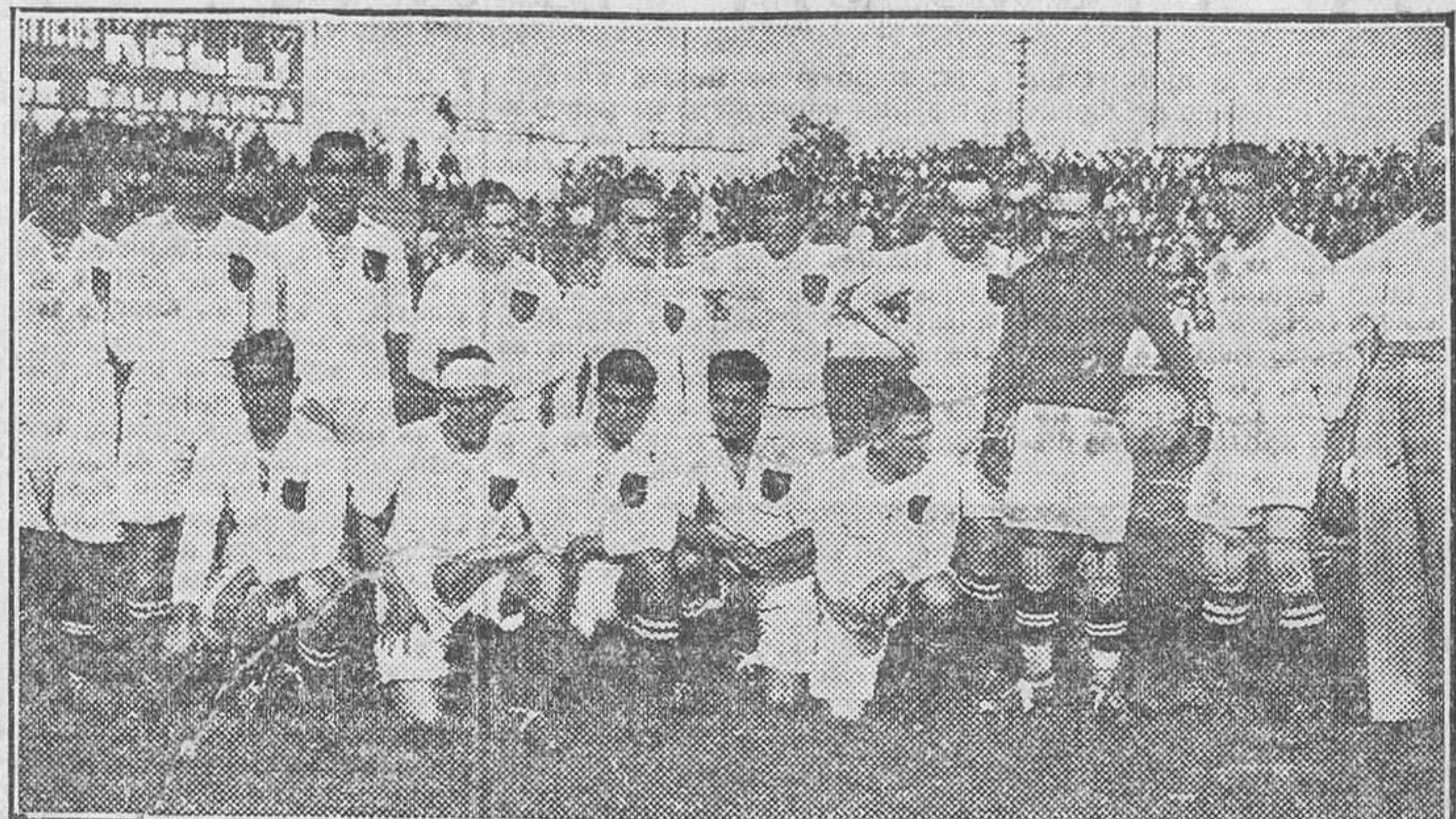
Equipo de la selección de Galicia, que venció a la del Centro en el campo de Chamartín

Con motivo de los próximos campeonatos de Castilla, se participa a los atletas del Madrid F. C. que pueden inscribirse en secretaría, Caballero de Gracia, número