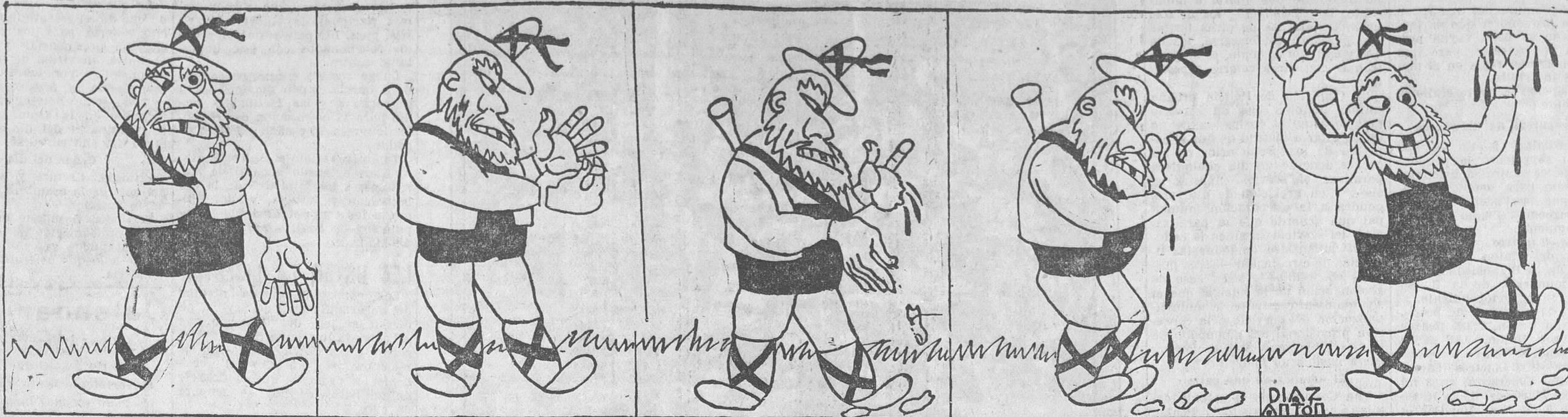
—Yo necesito saber si Rosetta me ama, y aquí no hay margaritas para deshojarlas. ¡Y yo necesito saberlo, voto al infierno!