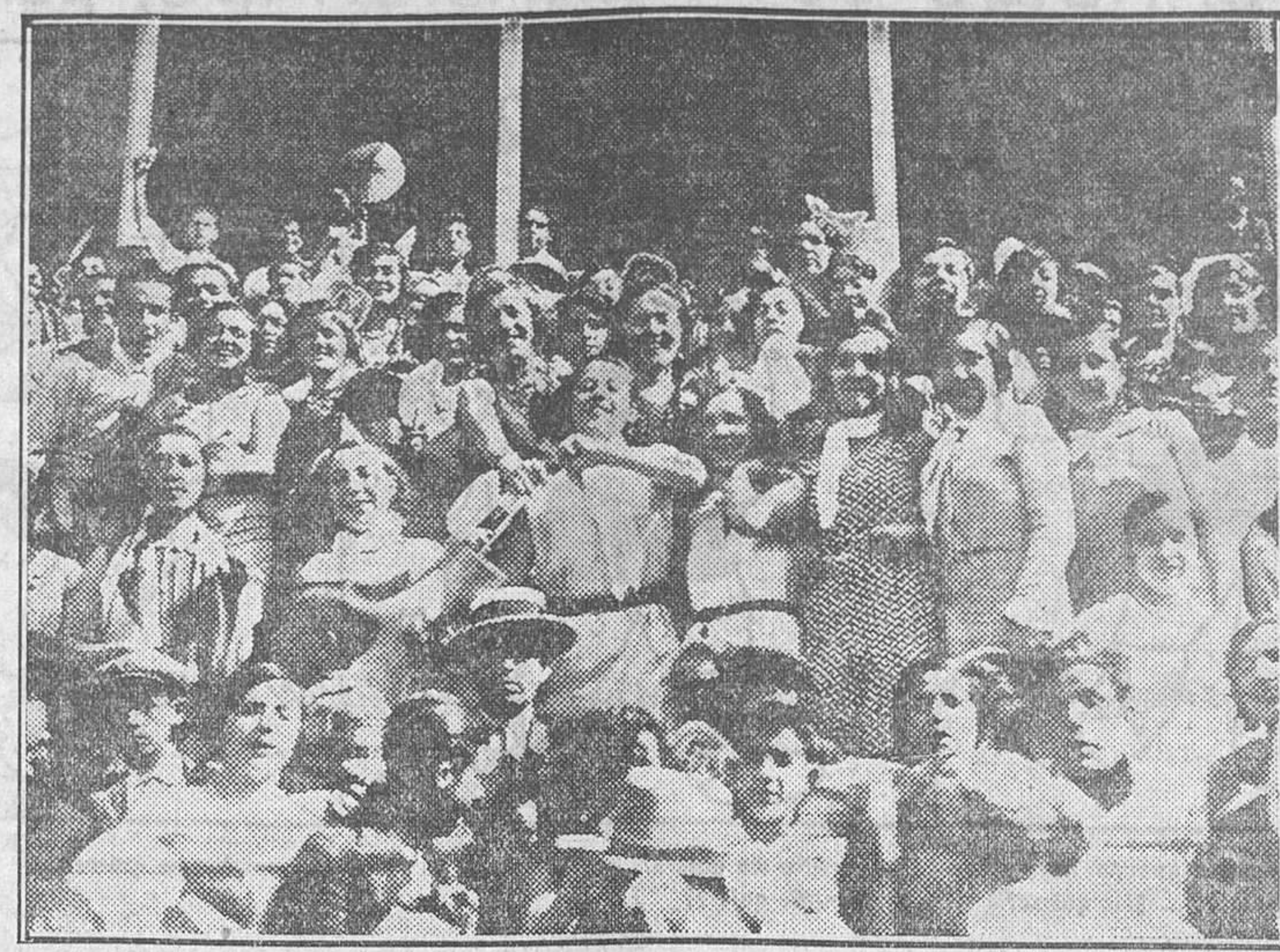
Aspecto de un tendido—juventud, alegría, belleza—durante la becerrada del Montepto Comercial e Industrial Madrileño