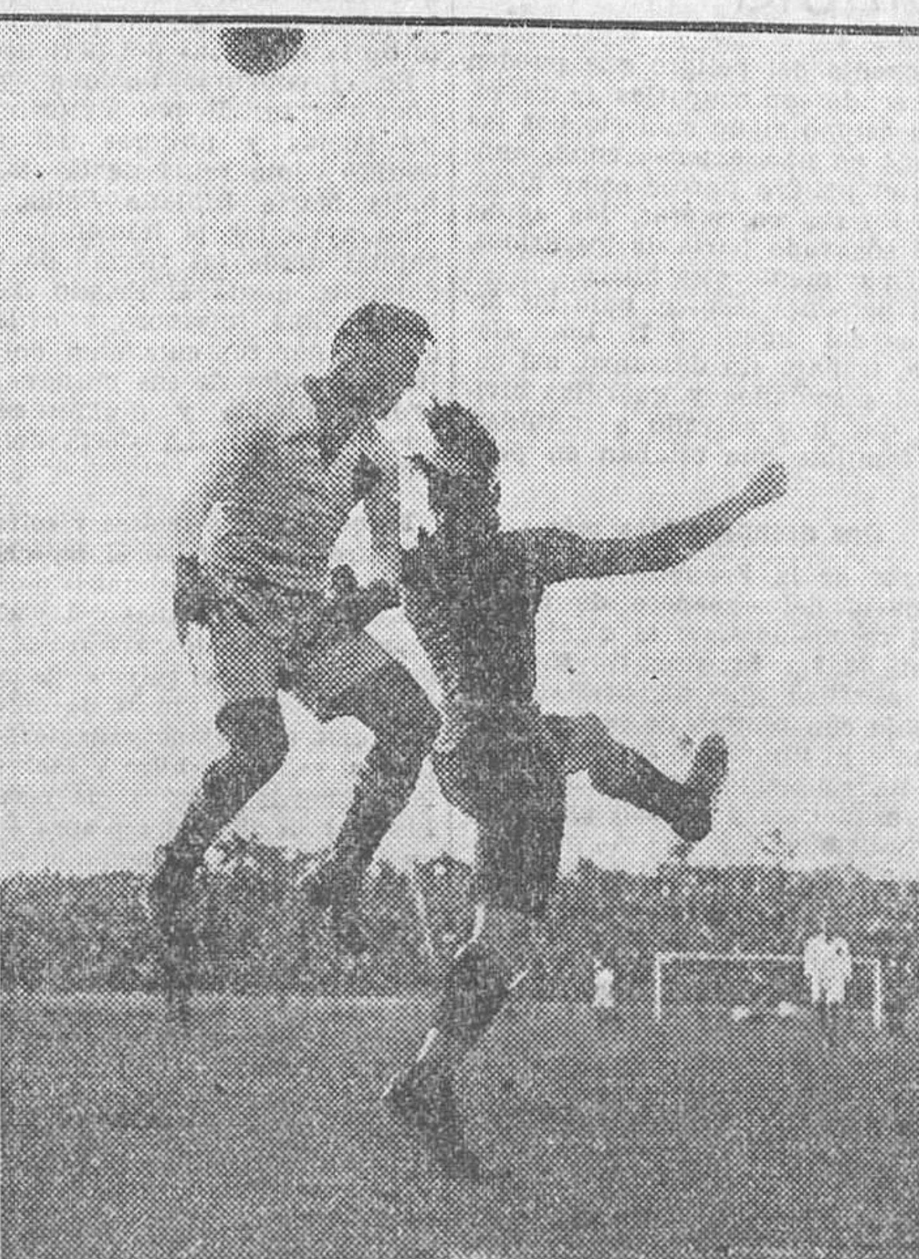
DEL PARTIDO DEL DOMINGO.—Una jugada del encuentro entre las selecciones Centro y Galicia