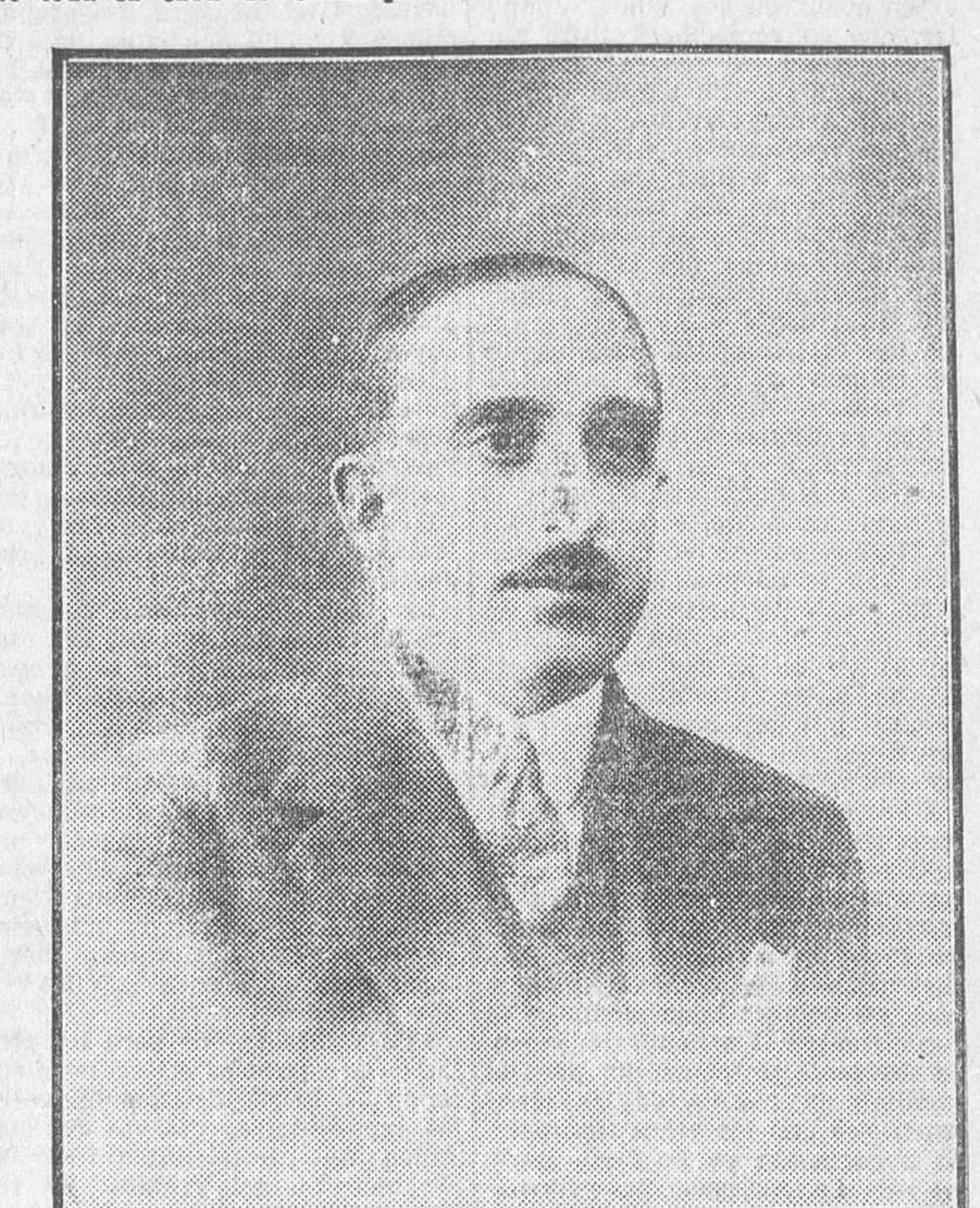
El ilustre escritor y erudito Luis Astrana Marín, traductor y comentarista de la obra completa de Shakespeare

Gran suspiro de satisfacción debió lanzar Luis Astrana Marín cuando hora y cuarto antes de mediodía del 9 de Septiembre de 1923 escribió en la última cuartilla de la traducción de «Otel» que había terminado la versión de toda la obra de Shakespeare.