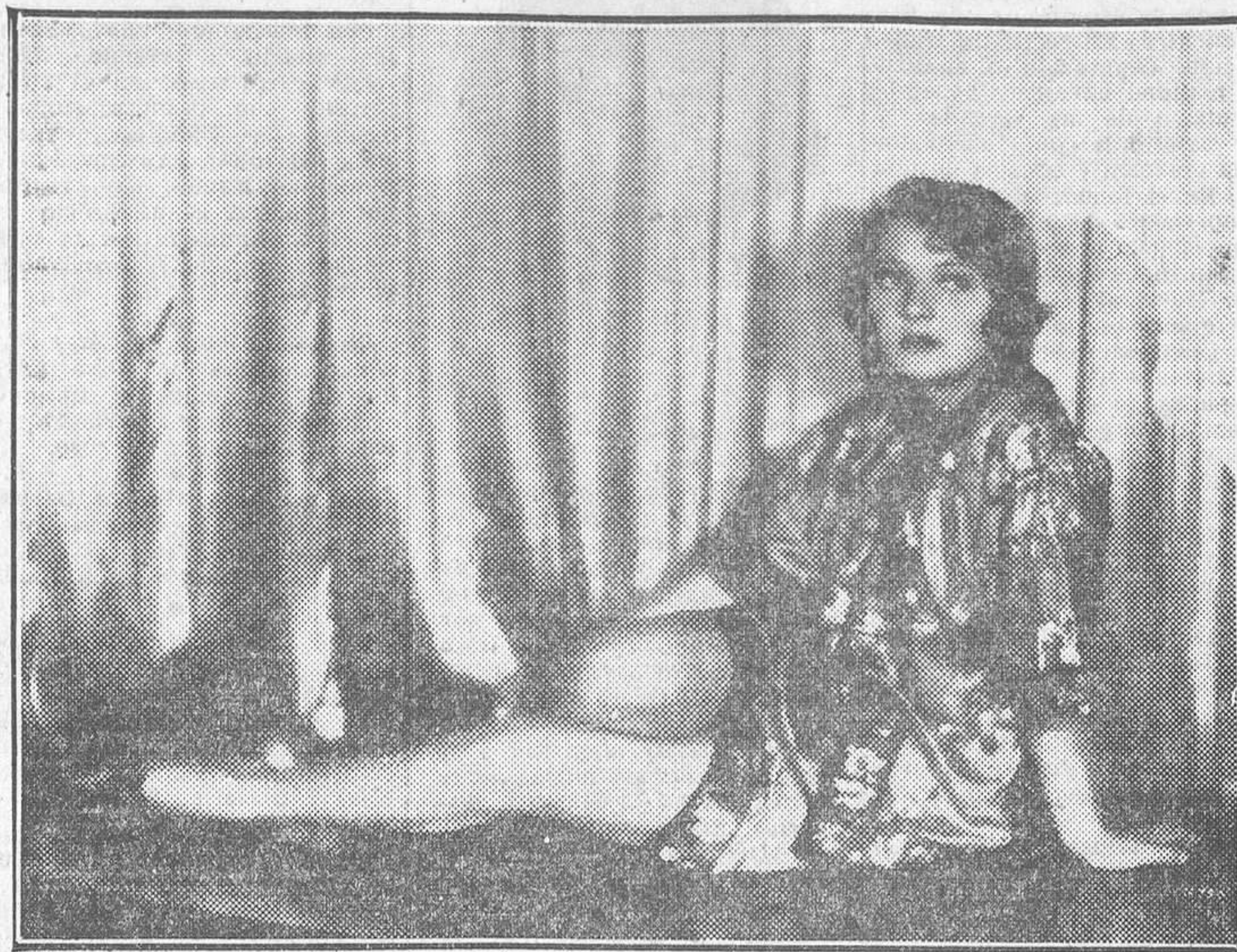
DOROTHY MAKAILL, ARTISTA DE LA FIRST NATIONAL

pensamos, nuestra acción no ha de ser constructiva, sino defensiva, es preciso fijar cuál es el baluarte en que izamos la bandera del patriotismo y cuáles son los enemigos que le amenazan.