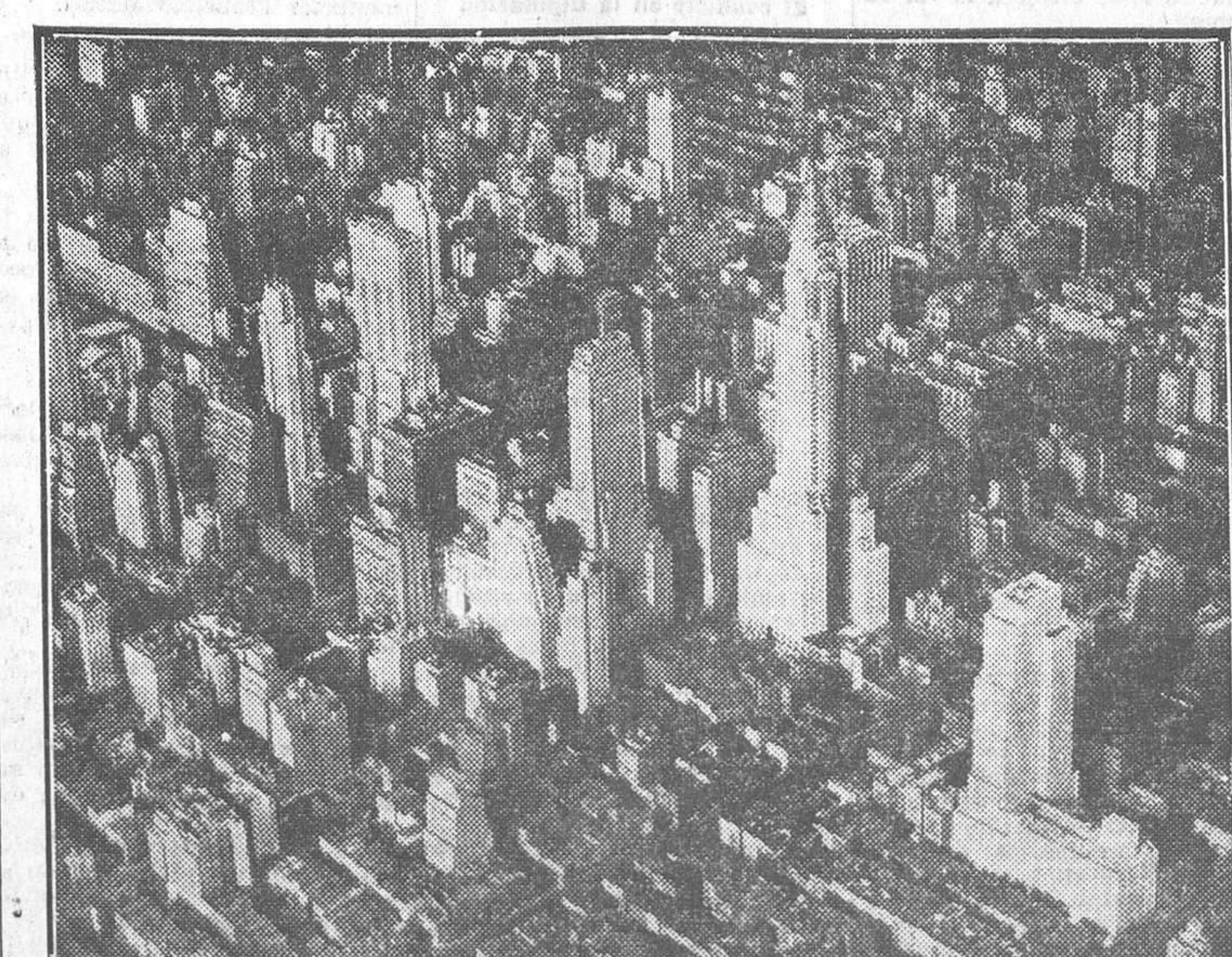
Una vista de Nueva York, en la que se demuestra cómo los rascacielos pueden ofrecer un aspecto bello y artístico.