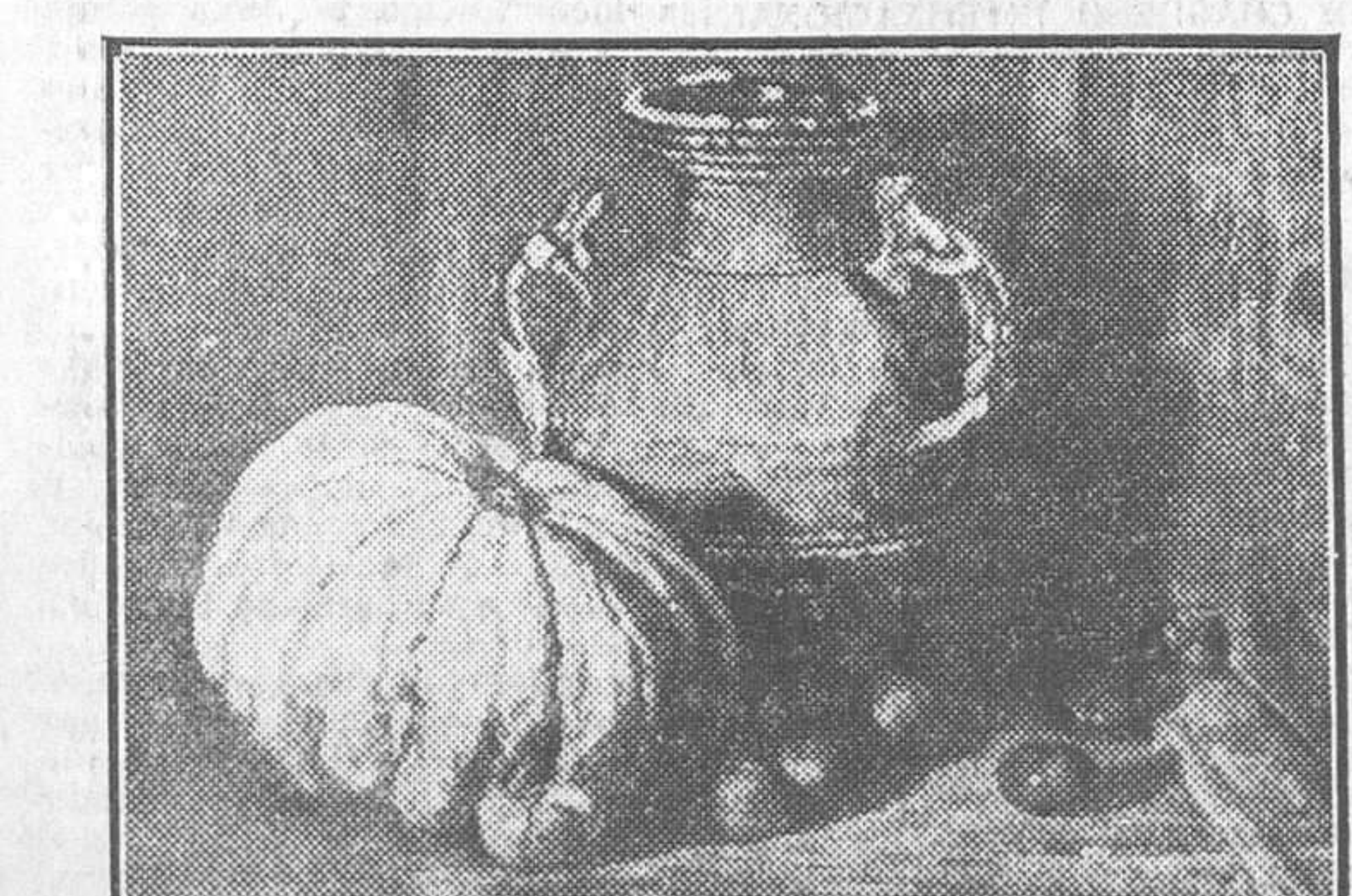
«Bodegón», de Nicolás Raurich