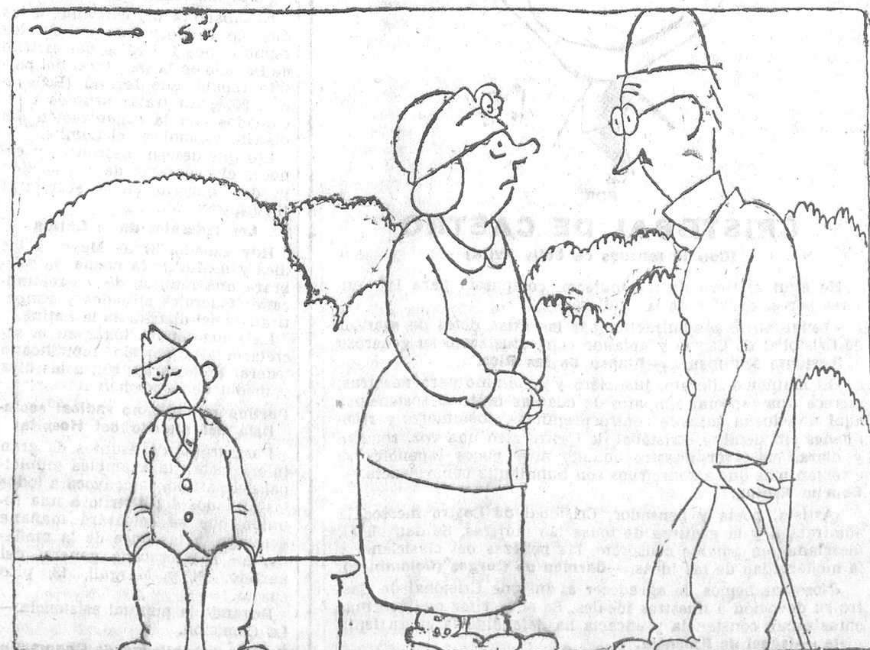
—Le aburre todo. No se divierte con nada. —¿Por qué no lee los discursos de Mussolini?

En lo que se refiere al presupuesto del Ejército, el Reichstag ha rechazado los nuevos puestos solicitados por los partidos gubernamentales, pero ha aprobado el resto. Al discutirse el presupuesto de Marina, el general Groener ha hablado nuevamente, dejando claramente entender en su discurso que piensa renunciar por el corriente año a la concesión de los créditos necesarios para la construcción del crucero acorazado «B» (primera parte).