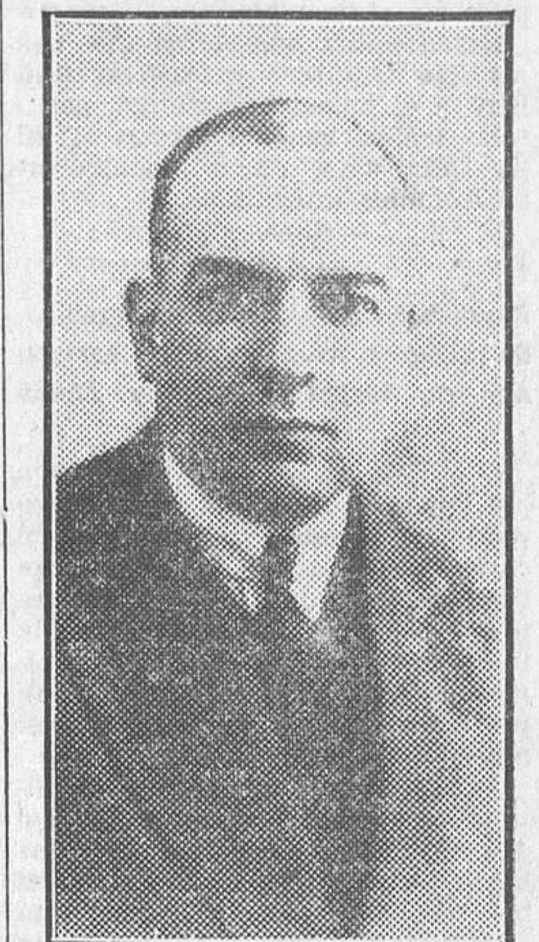
El ilustre periodista Carlos Esplá

Ha pasado unos días en Madrid Carlos Esplá, uno de los más claros valores de nuestro periodismo, que, desde su atalaya de París, ha sido, en los seis años inicios de la Dictadura, el guía