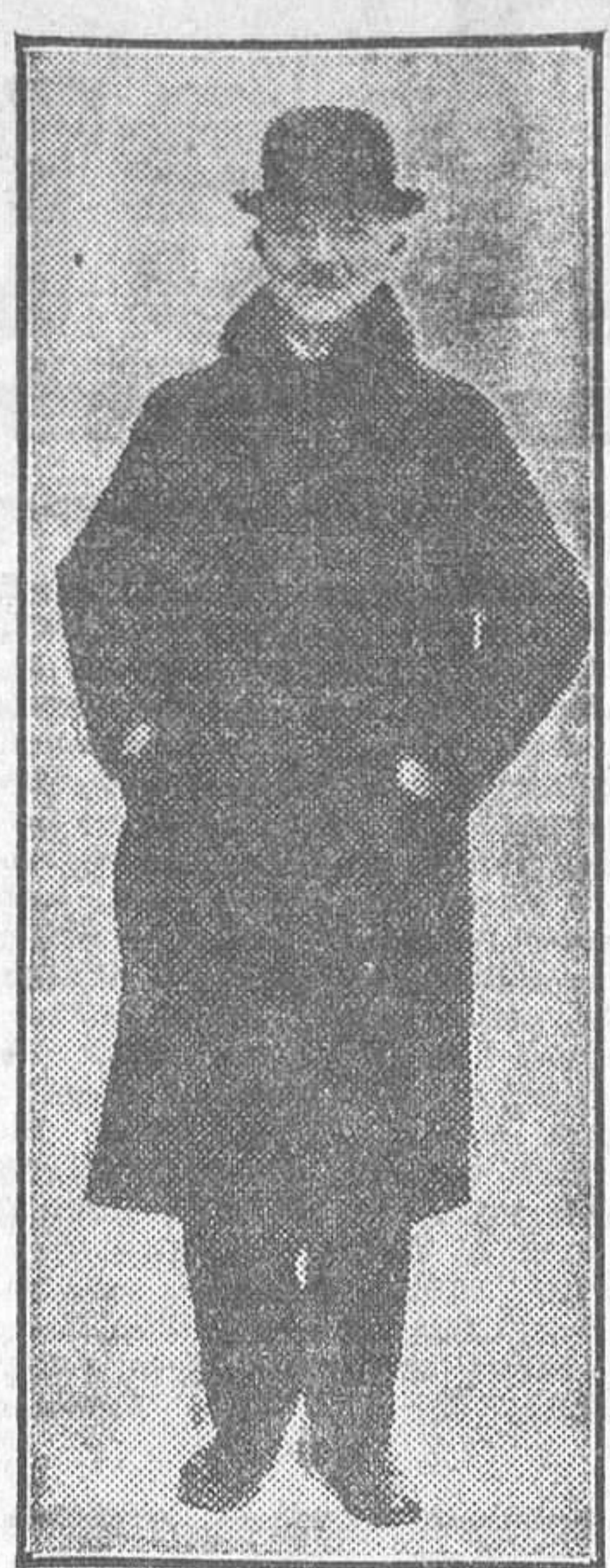
El doctor Schacht, director del Reichsbank, que ha presentado la dimisión por disconformidad con el plan Young

trumentos mercantiles, llevaban camino de ser nuestros «certificados de defunción». Claro que sin legalidad.