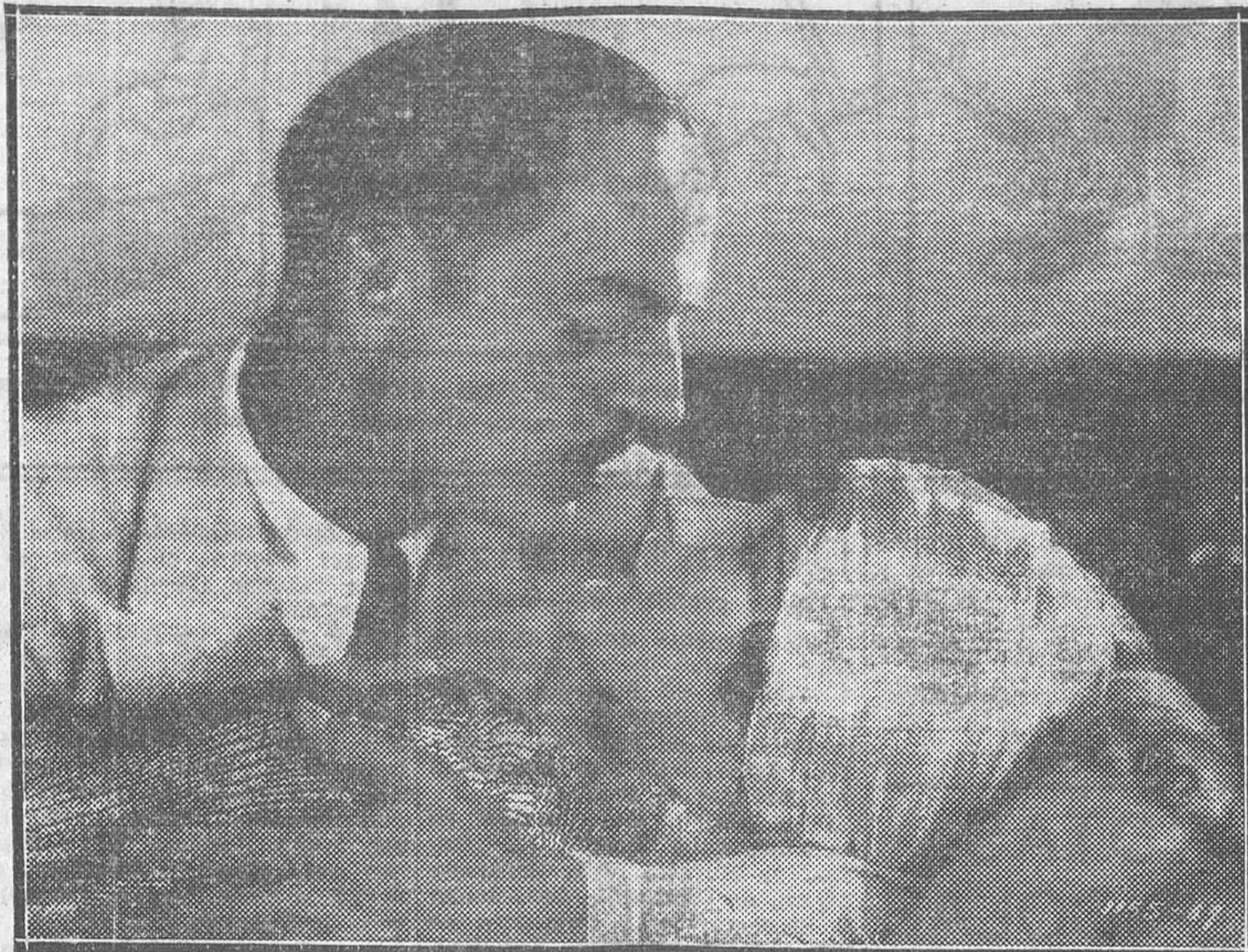
EVELYN BRENT Y WILLIAM POWELL, EN LA PELICULA PARAMOUNT, «INTROMISION»

Desde los films de «Campanillas»—«Campanillas legionario», «Sinfonía no tiene empuje», «Fango y harina», una parodia de «Sangre y arena»—hasta éstos que nos ofrece ahora la Metro Goldwyn Mayer, hay una gran distancia. Marcan un gran proceso evolucionario en su pro-