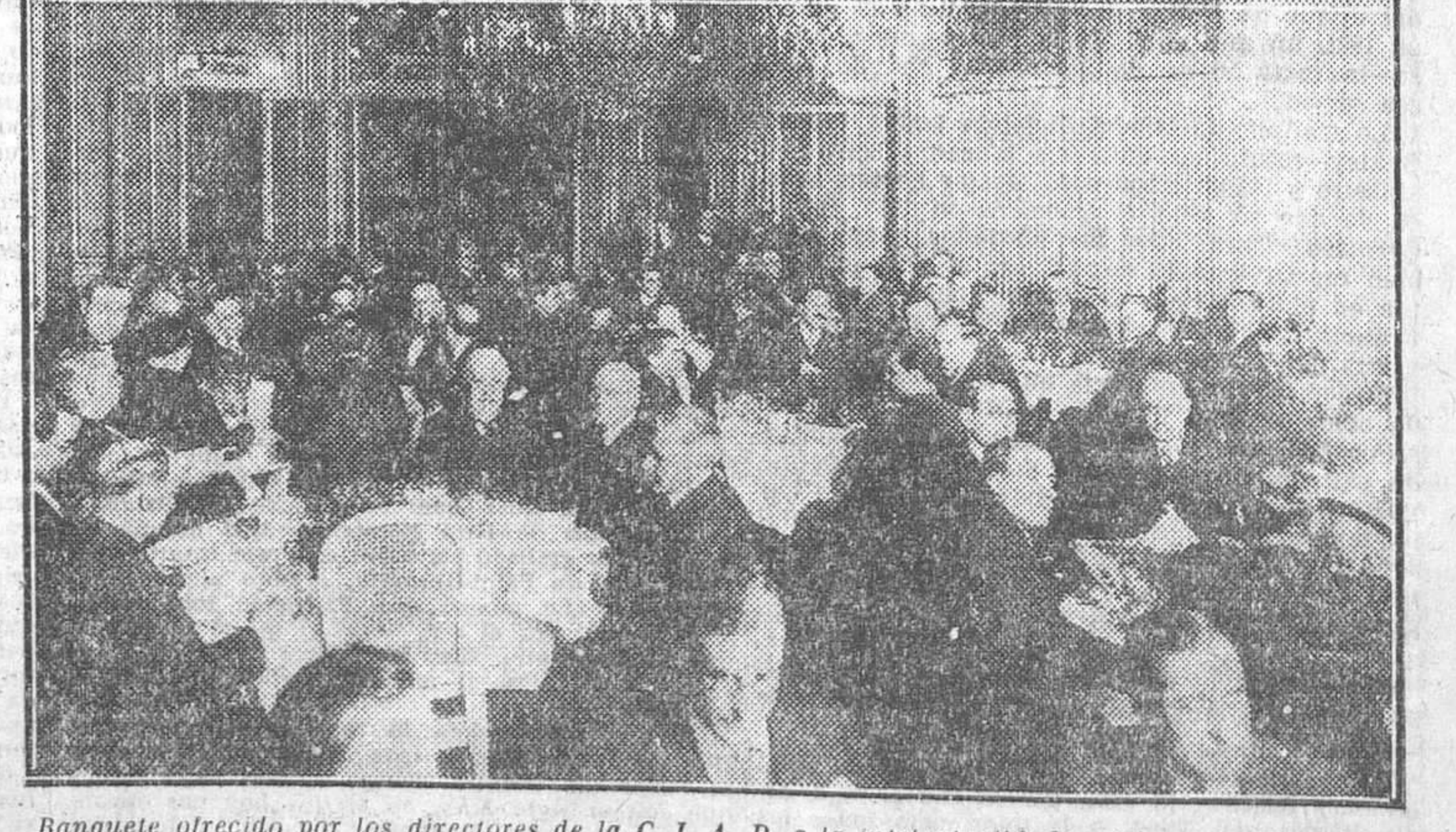
Banquete ofrecido por los directores de la C. I. A. P. a la intelectualidad catalana y algunos elementos de la madrileña, con motivo de la inauguración de la Librería Barcelona en la ciudad condal

El número de hoy de LA LIBERTAD consta de DOCE páginas, y su precio es el de costumbre: DIEZ CENTIMOS