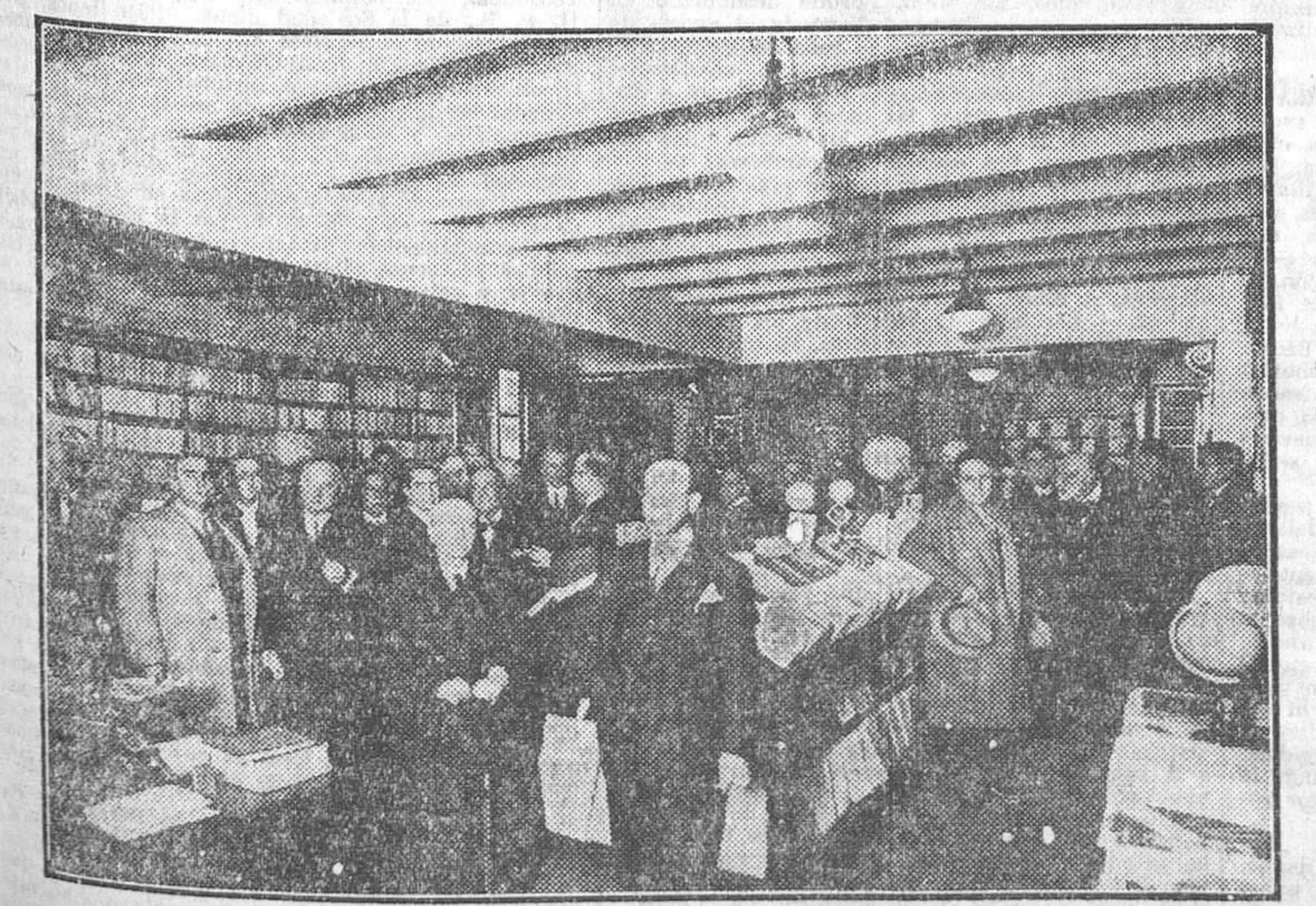
La Librería Barcelona de la C. I. A. P. el día de su inauguración