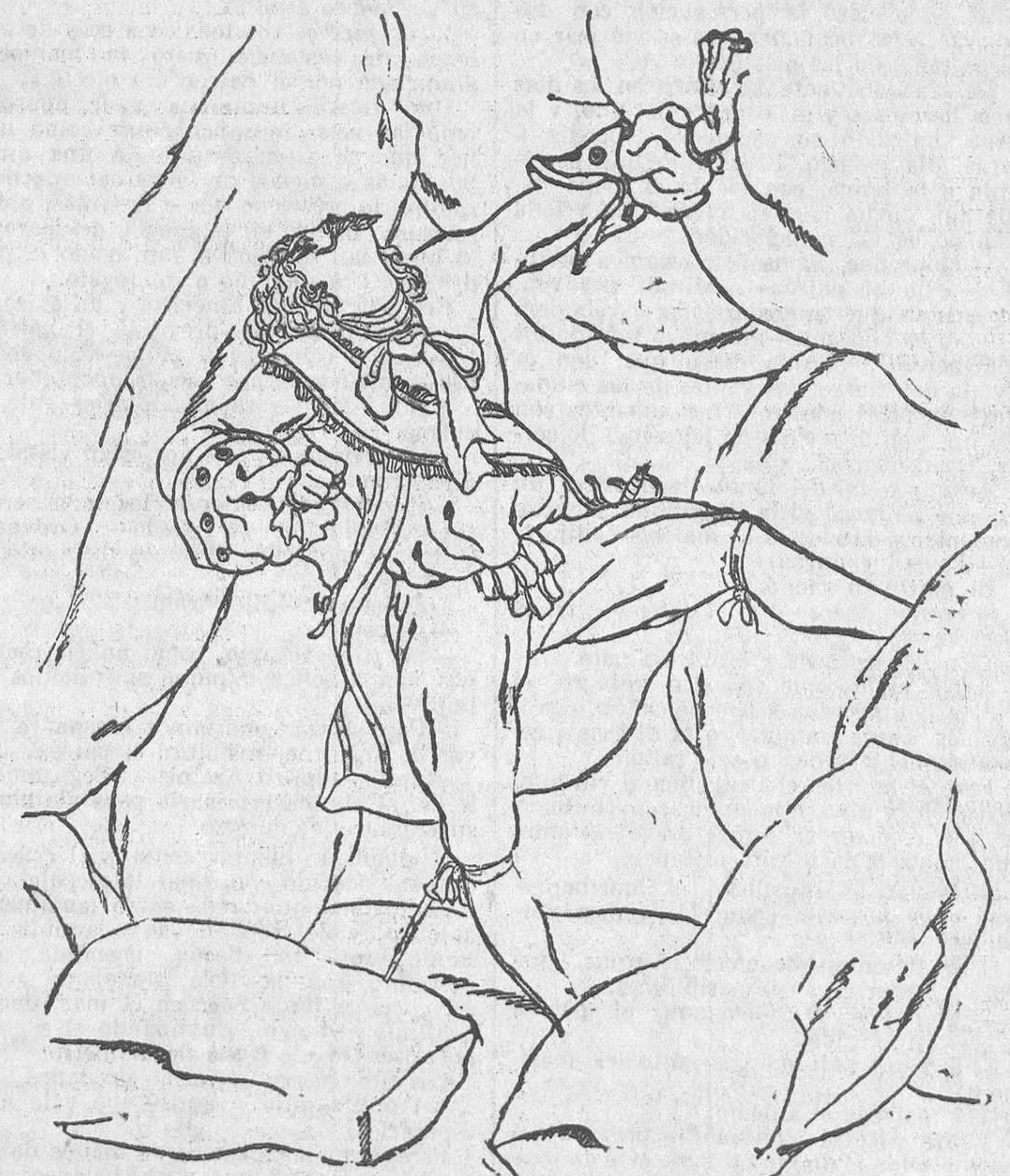
... Y el titán cayó lanzando un postrer suspiro

Goennec, uno de los tres marinos, se atrevió a decir bastante alto: —Monseñor, nos dan caza.