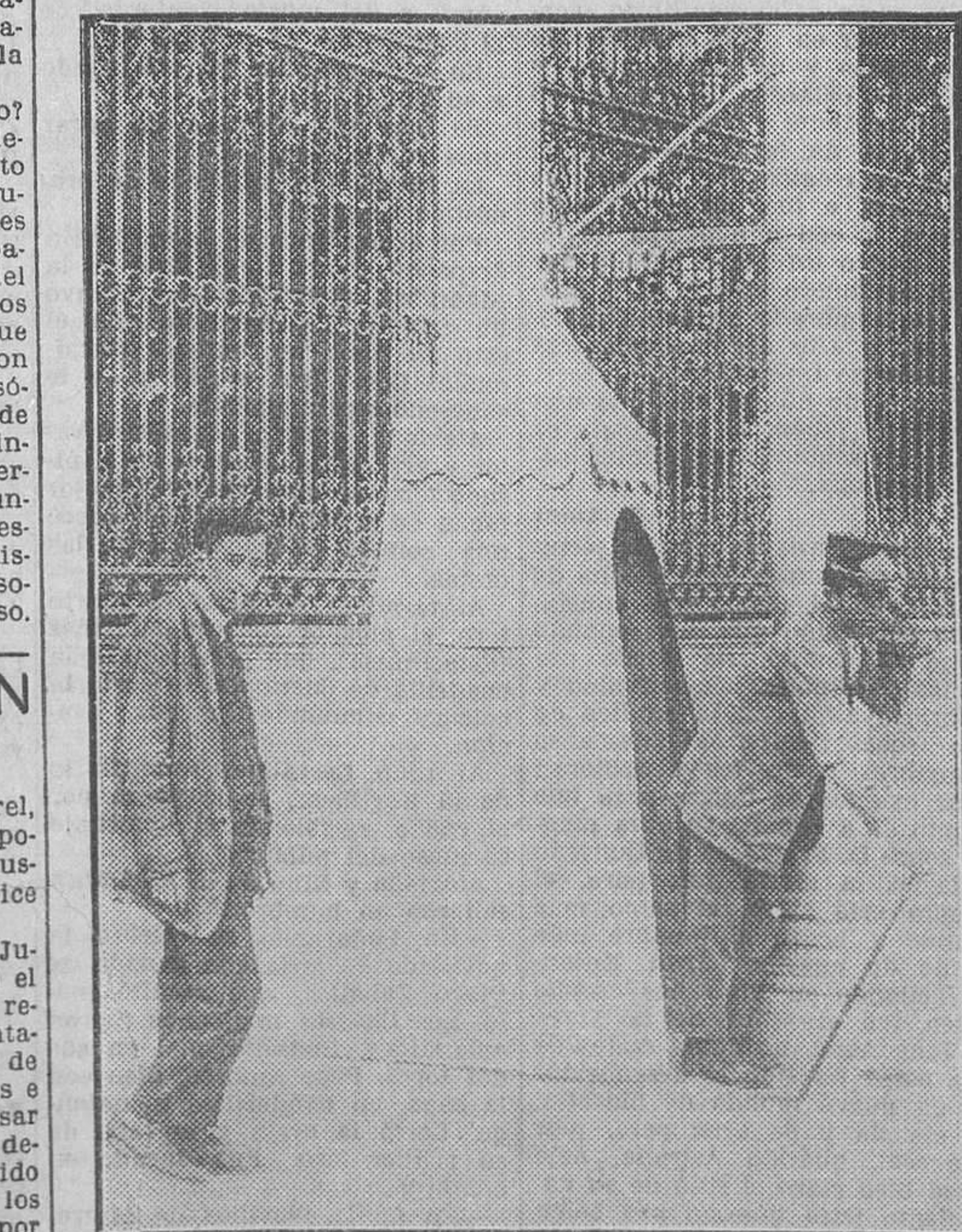
La primera garita de lona instalada en Madrid (en la plaza de Castelar) para preservar a los guardaaguas de los tranvías de las inclemencias del tiempo

Aunque contra éstos continuaban descargando las nubes frecuentes y copiosas chaparrones, el entrante número de máquinas.