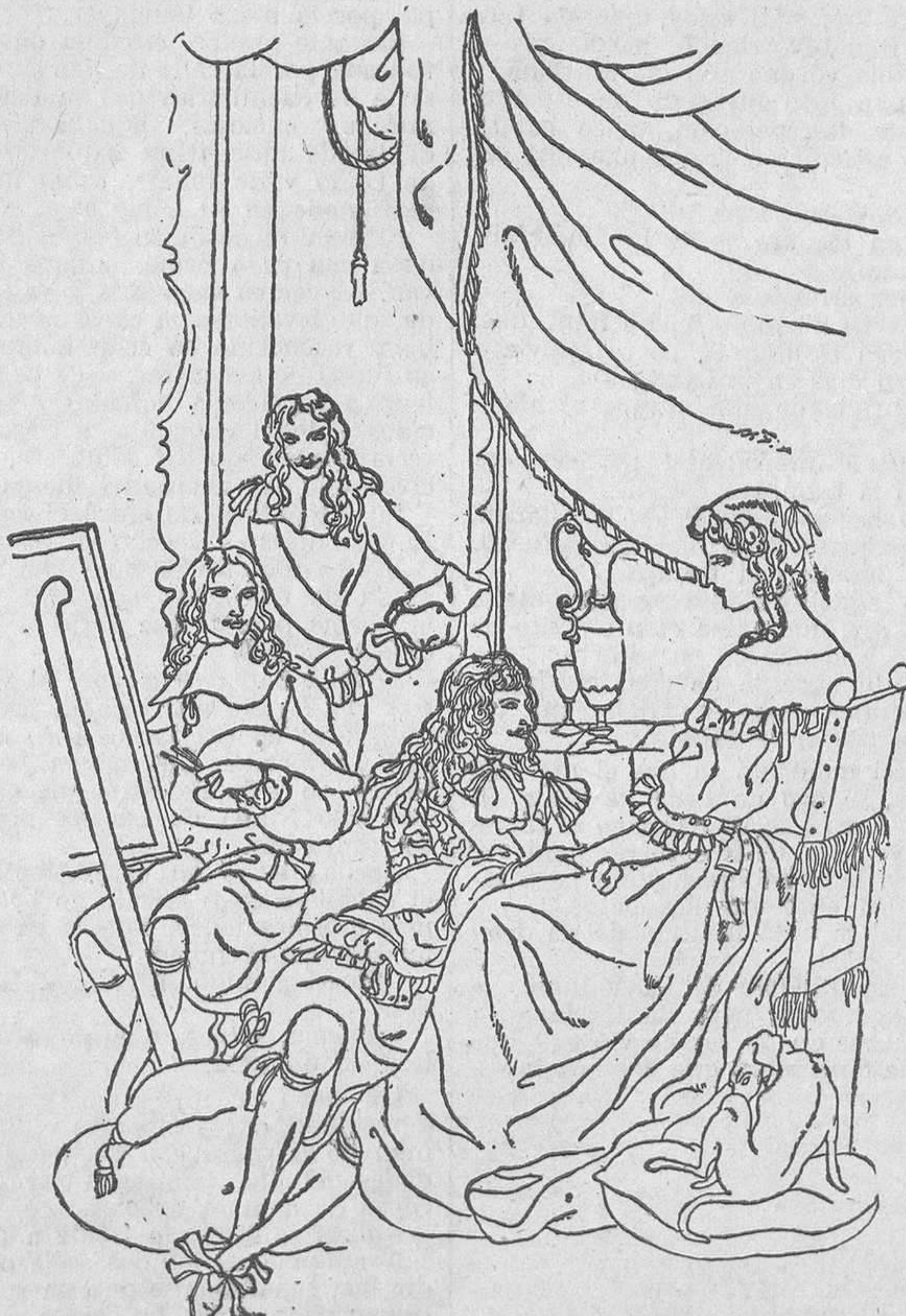
Luis XIV y su amante

—Pronto, pronto—dijo—, que sube. —¿Quién? ¿Quién sube? —¡El! Bien lo temía yo.