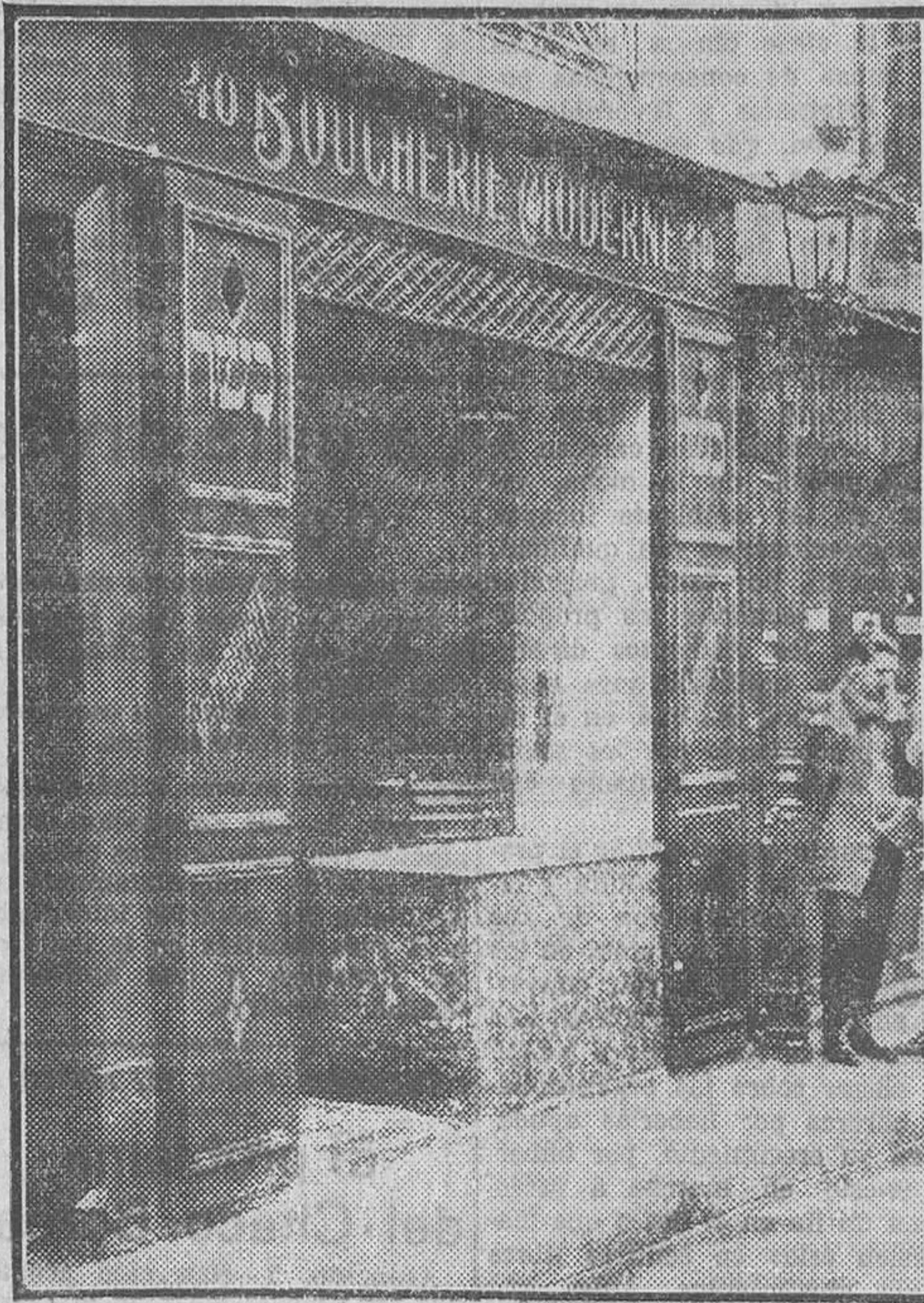
LOS SUCESOS DE JERUSALEM.—Un comercio asaltado por los árabes

Hán llegado un teniente coronel y un capitán de Carabineros para instruir las diligencias de rigor.