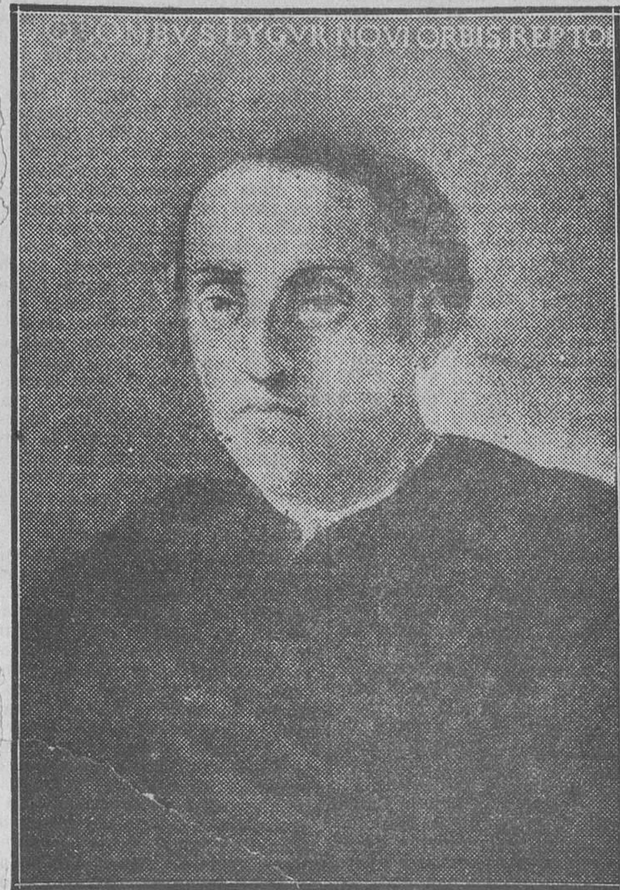
Retrato de Cristóbal Colón

neas de Colón así lo proclamaban cuando en una época en que tantos genoveses venían a España y en ella residían, no hubo uno solo que descubriese la falsedad que suponía en Colón fingirse genovés, engaño torpísimo, porque no hay posibilidad de que un extranjero, en pocos o muchos años llegue a dominar de tal modo un