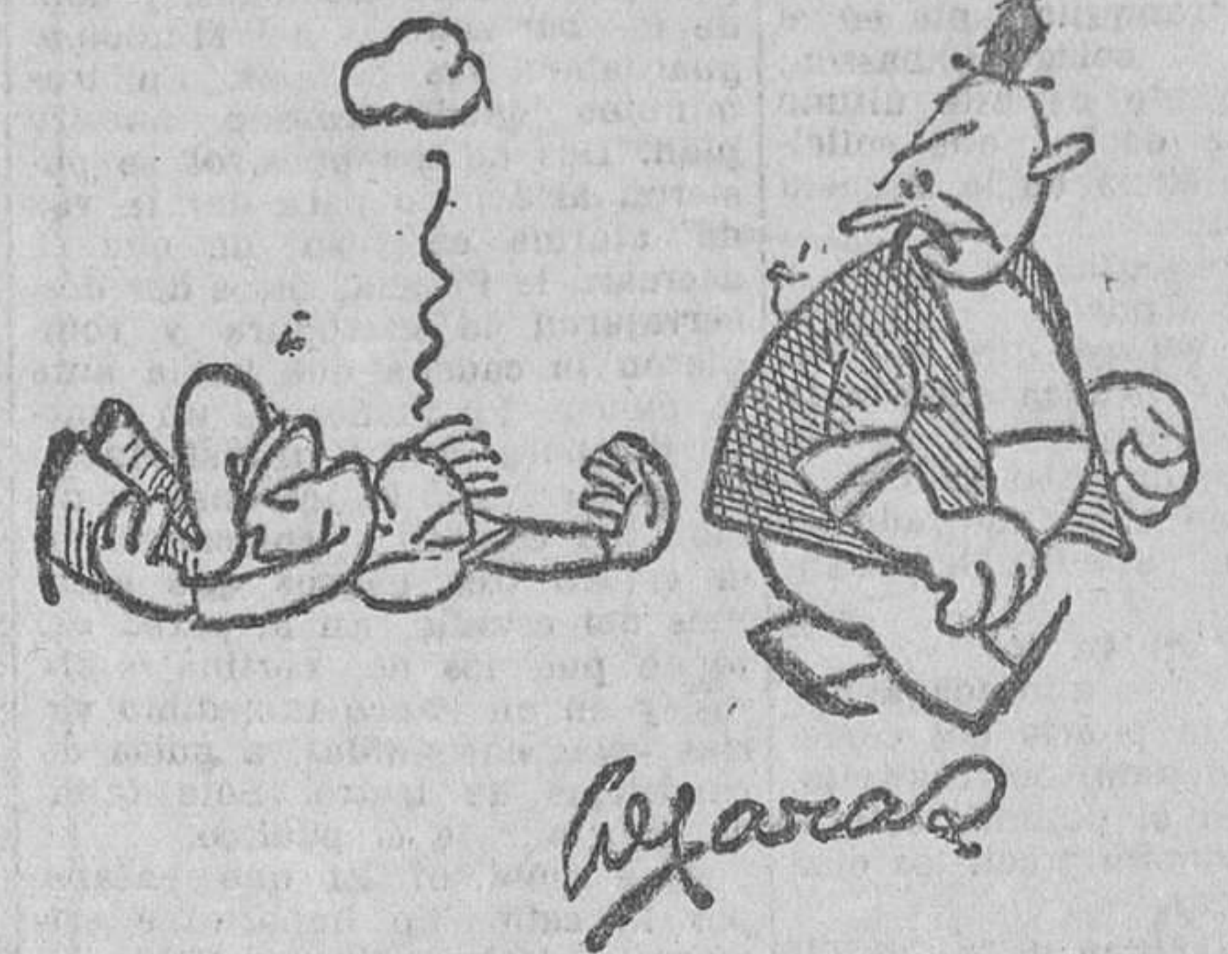
Las ganas que tenía yo de tropezarme con el marinerito éste!