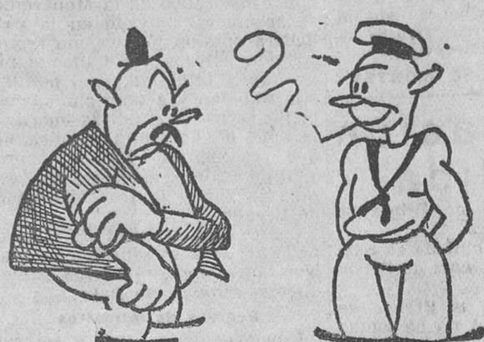
Ahí! Pero fuiste tú?