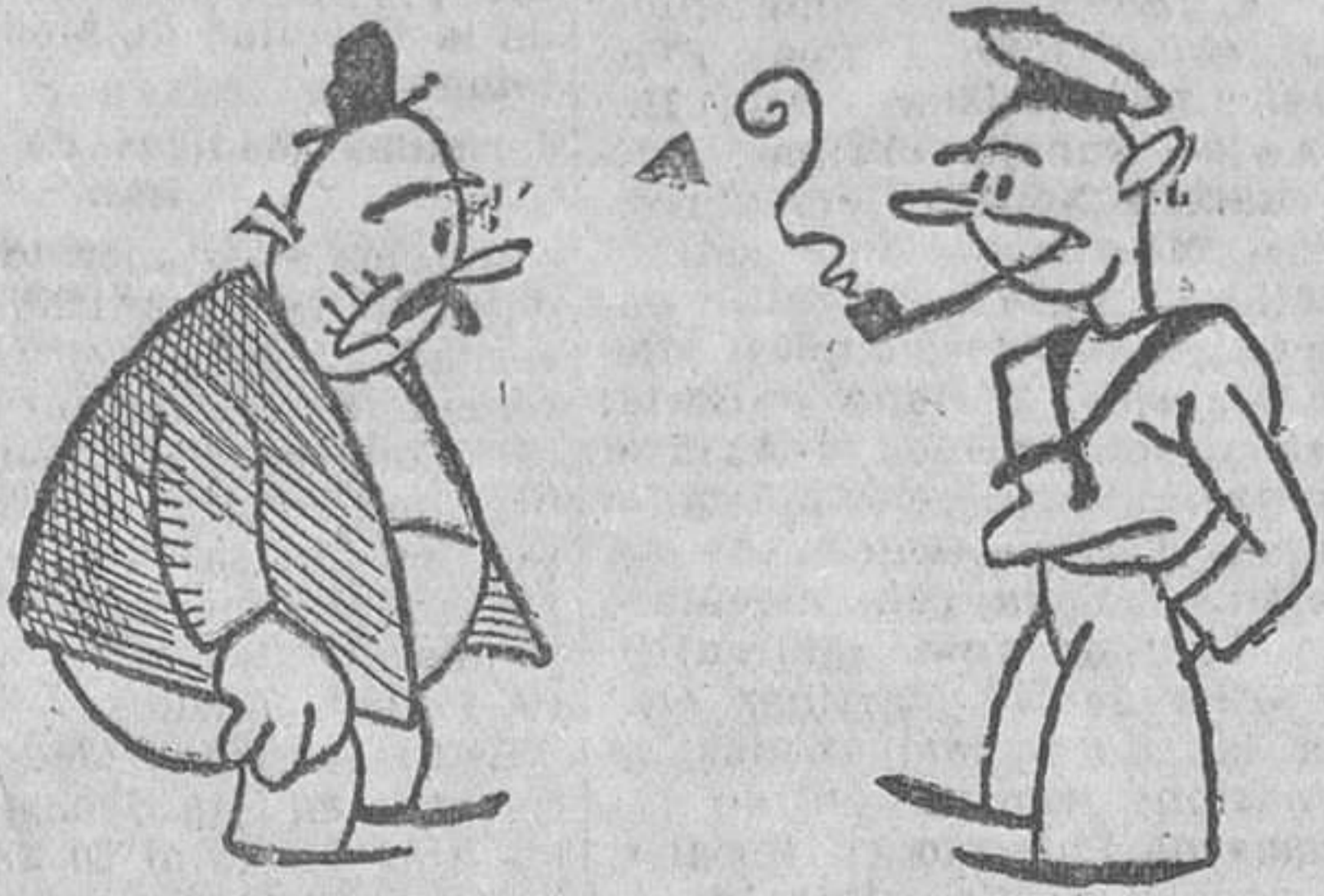
No se quién es usted. No recuerdo. Yo soy el que salvó la vida a su suegra el año pasado, cuando se cayó al mar.