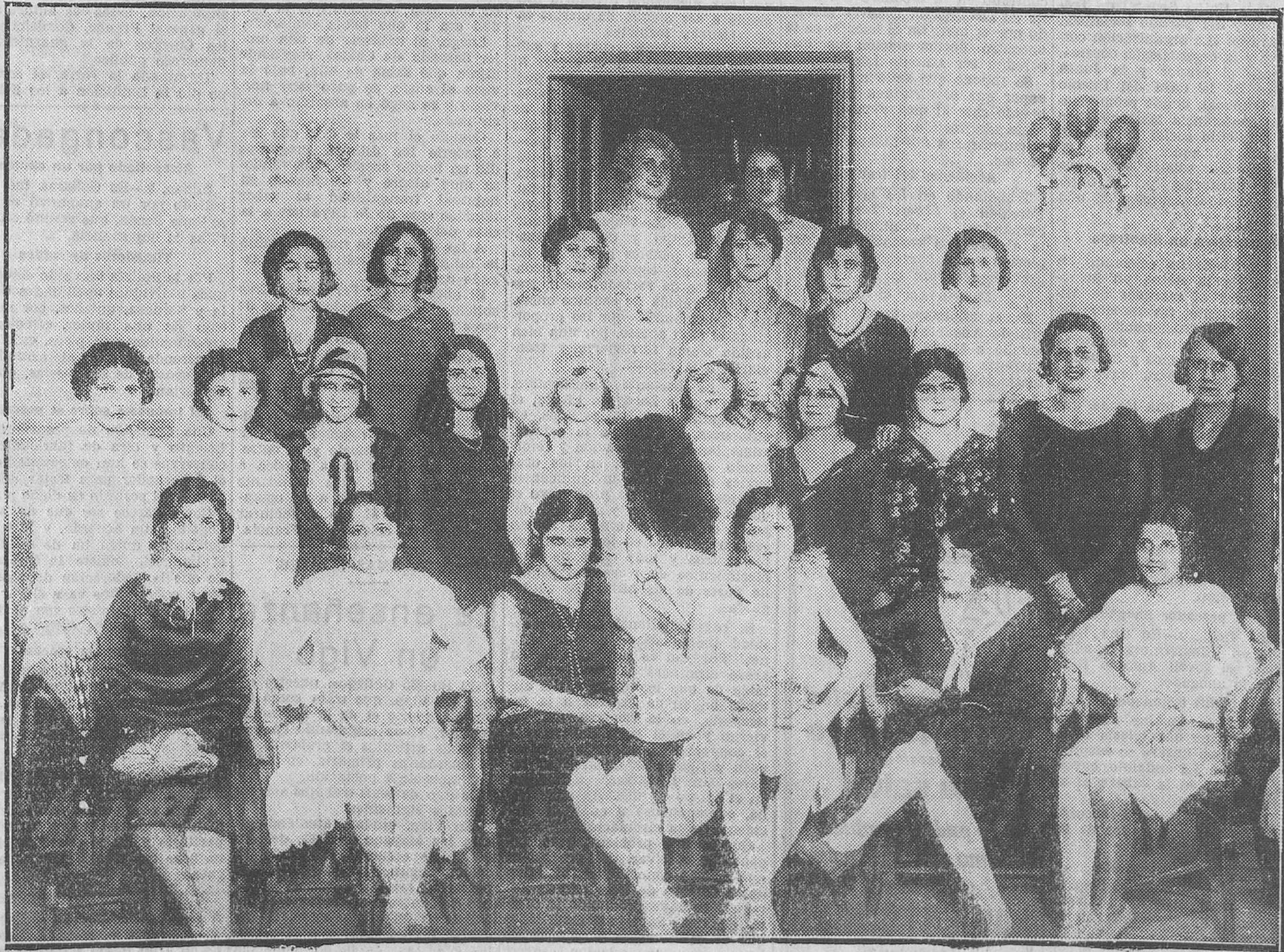
Las veintisiete muchachas que se disputan el trono de la belleza madrileña

Con el Sr. Ayuga se sentaron en la presidencia los decanos de médicos de zona, especialistas, practicantes y comadronas.