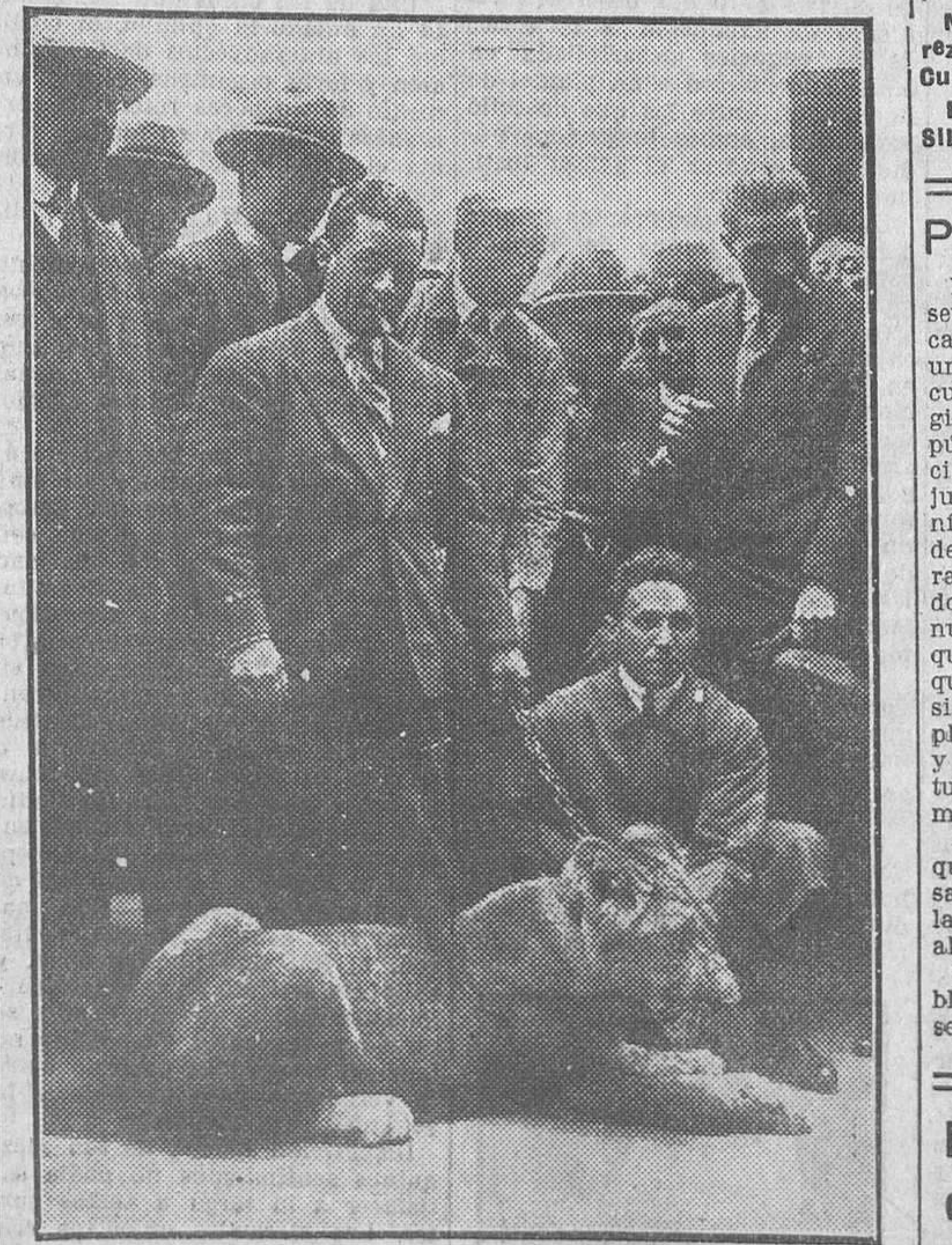
Un pacífico ciudadano que pasea por París con su leona, como podía hacerlo acompañado de un perro