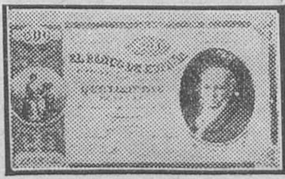
Uno de los primeros billetes emitidos por el Banco de España, con el busto de Goya, su ilustre accionista

grante paradoja—, porque no siempre se suele hacer buen uso del respeto de los demás. No es éste el caso, ciertamente, del Banco de España, subsistente a través de todas las vicisitudes políticas y económicas del país, sirviendo con igual celo a la Monarquía que a la República, acudiendo con igual presteza a remediar las crisis de todas las épocas y de todos los regimenes. Una institución que en España logra doblar el cabo del siglo sin zozobrar es porque lleva dentro algo tan esencial como la esencia misma del país. Si algún reproche pudiera hacerse al Banco no estaría, de seguro, en su vida, ya centenaria, sino en su gestación, y aun este reproche no sería por él mismo, sino por la época en que vivió la luz. En efecto; el Banco de San Fernando, precursor del actual Banco de España, fué fundado en una de las épocas de calamidad