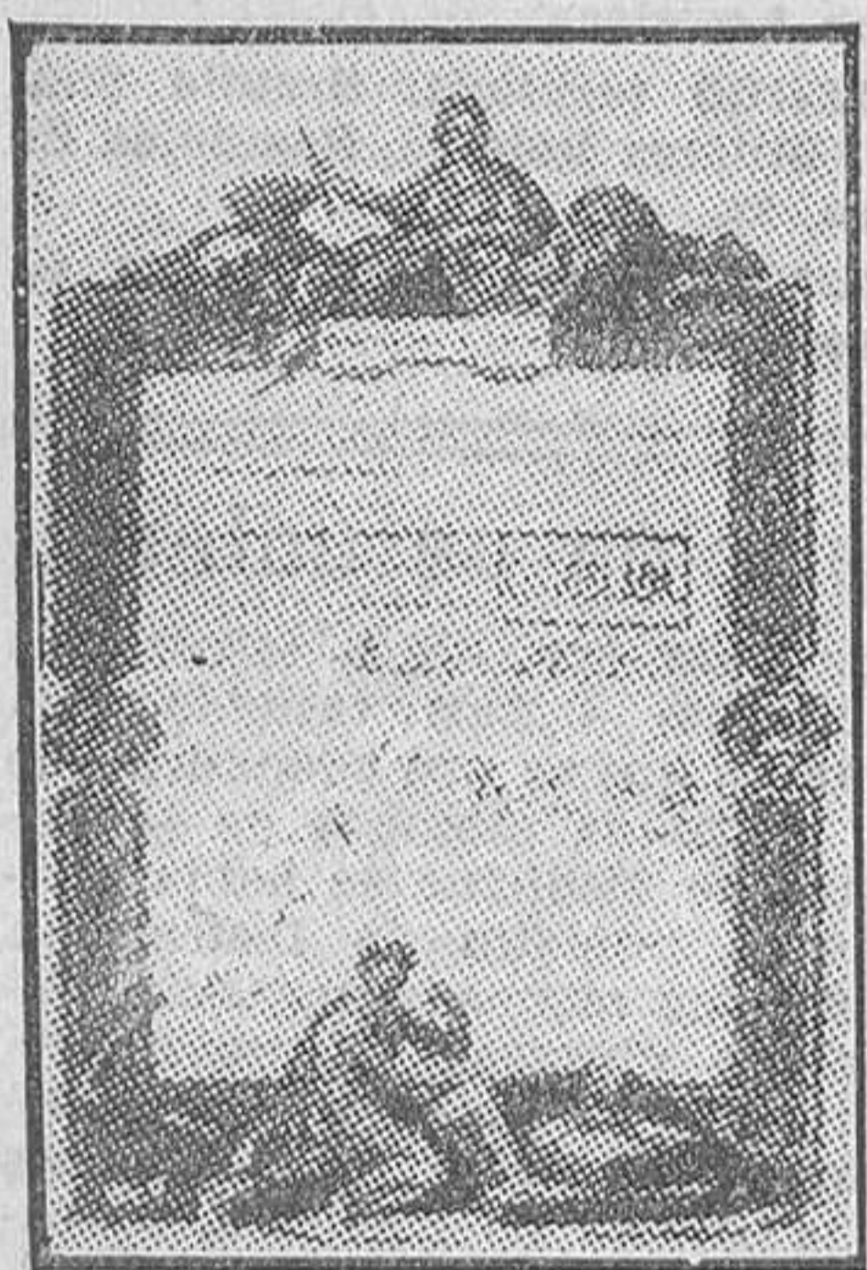
Una acción del primitivo Banco de España, suscripta por Goya

Uno de los méritos más positivos del instituto de emisión es haber afrontado con éxito los más duros temporales financieros acaudrados por la política de todos