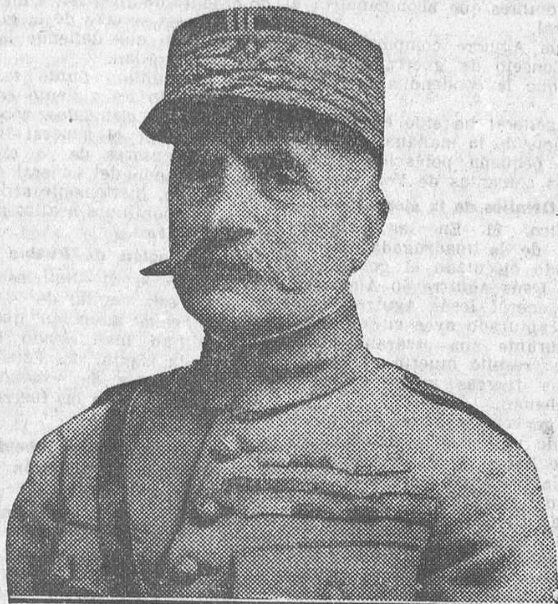
El mariscal Foch, gloria de la ciudadanía francesa