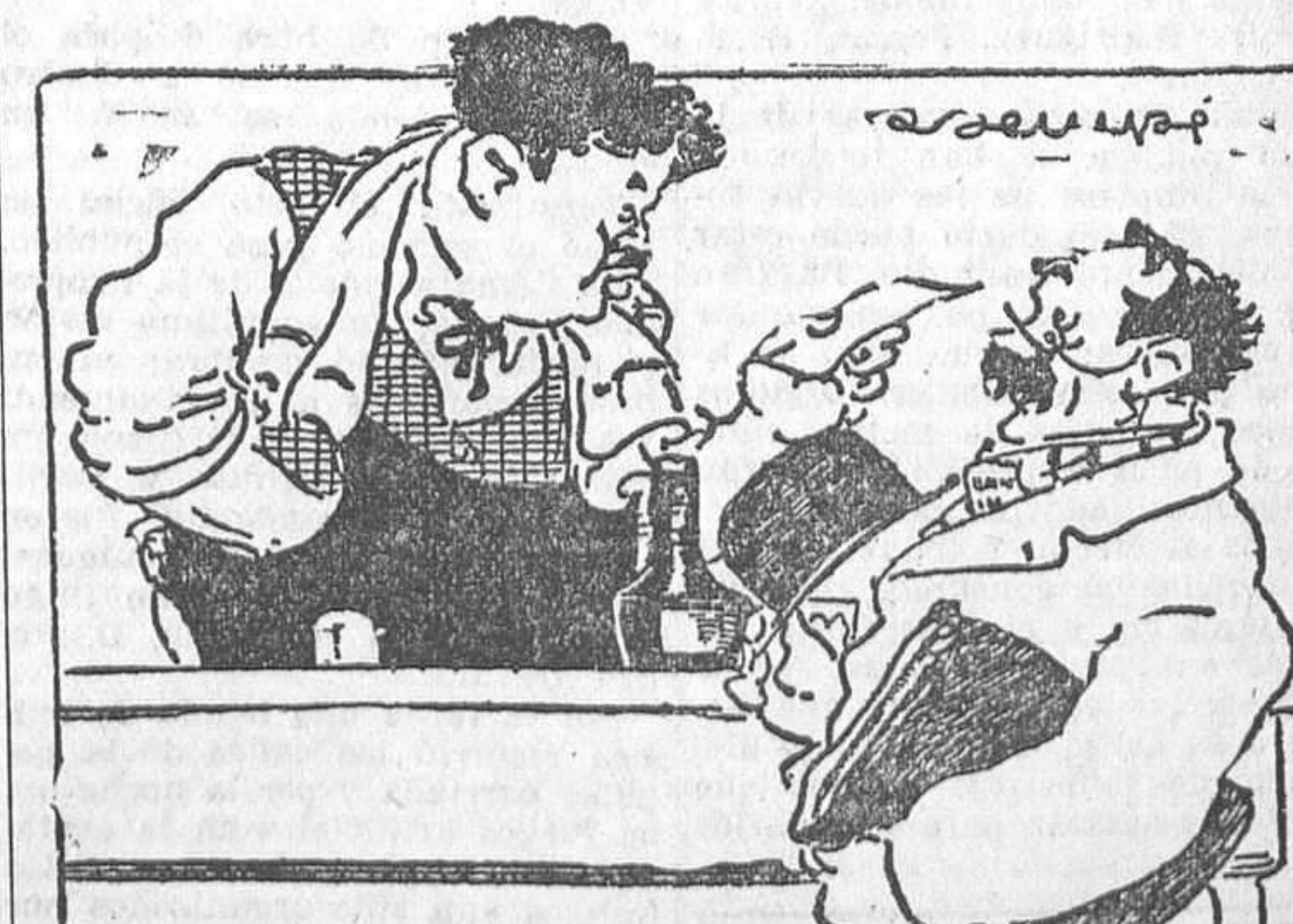
—Si, señor. Yo compré a usted el vino, garantizándome usted que tendría diez grados, y escasamente llegan a siete. —Pero... ¿hace tanto frío? («Le Petit Girondo»)