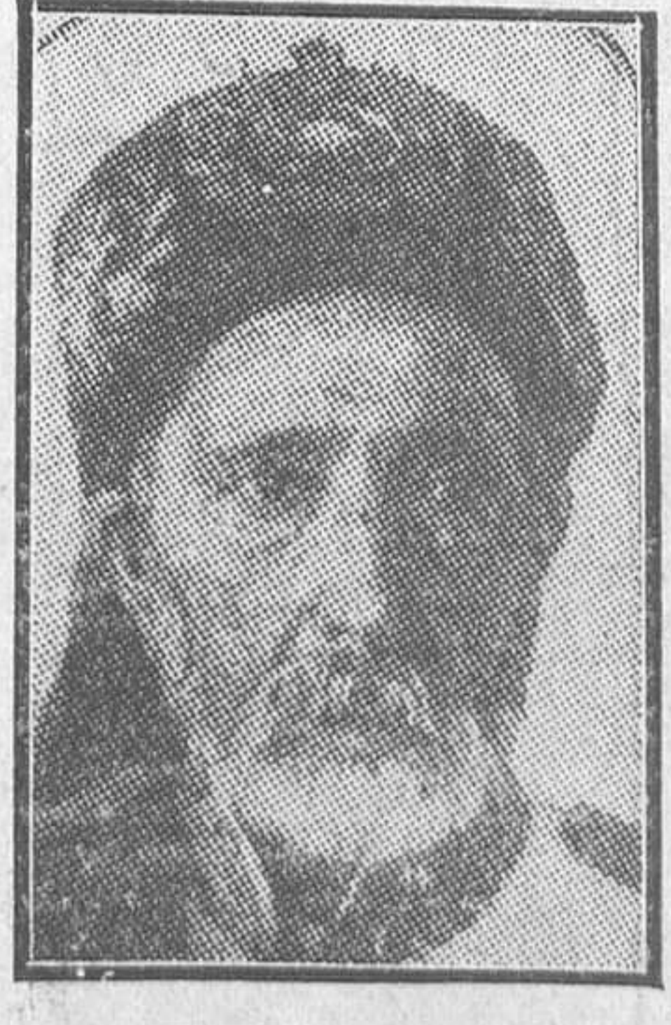
El bey de Túnez, Sidi Mohammed el Habib ben Lamtne