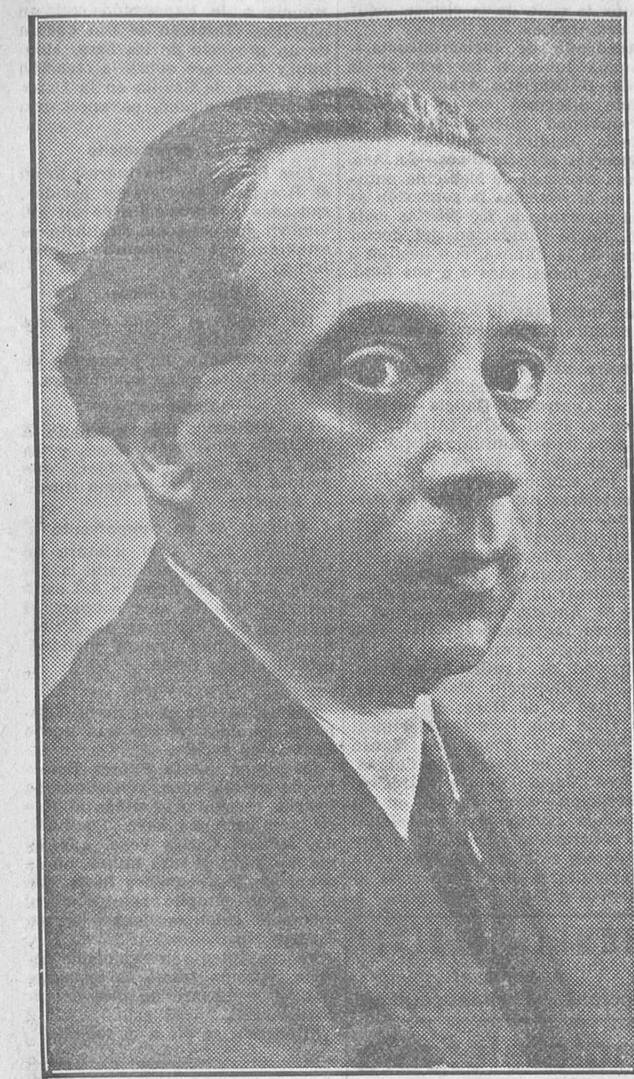
Alvaro de Albornoz, ilustre jurista, escritor, orador y significativa figura política...