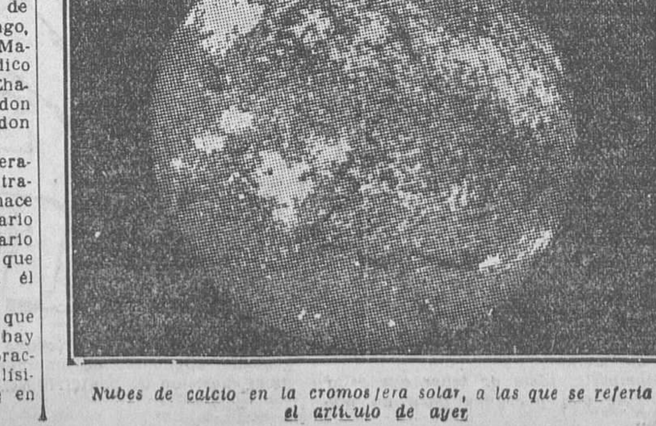
Nubes de calcio en la cromosfera solar, a las que se refería el artículo de ayer

La temperatura efectiva se determina por medio de la constante solar. Veamos qué es la constante solar: