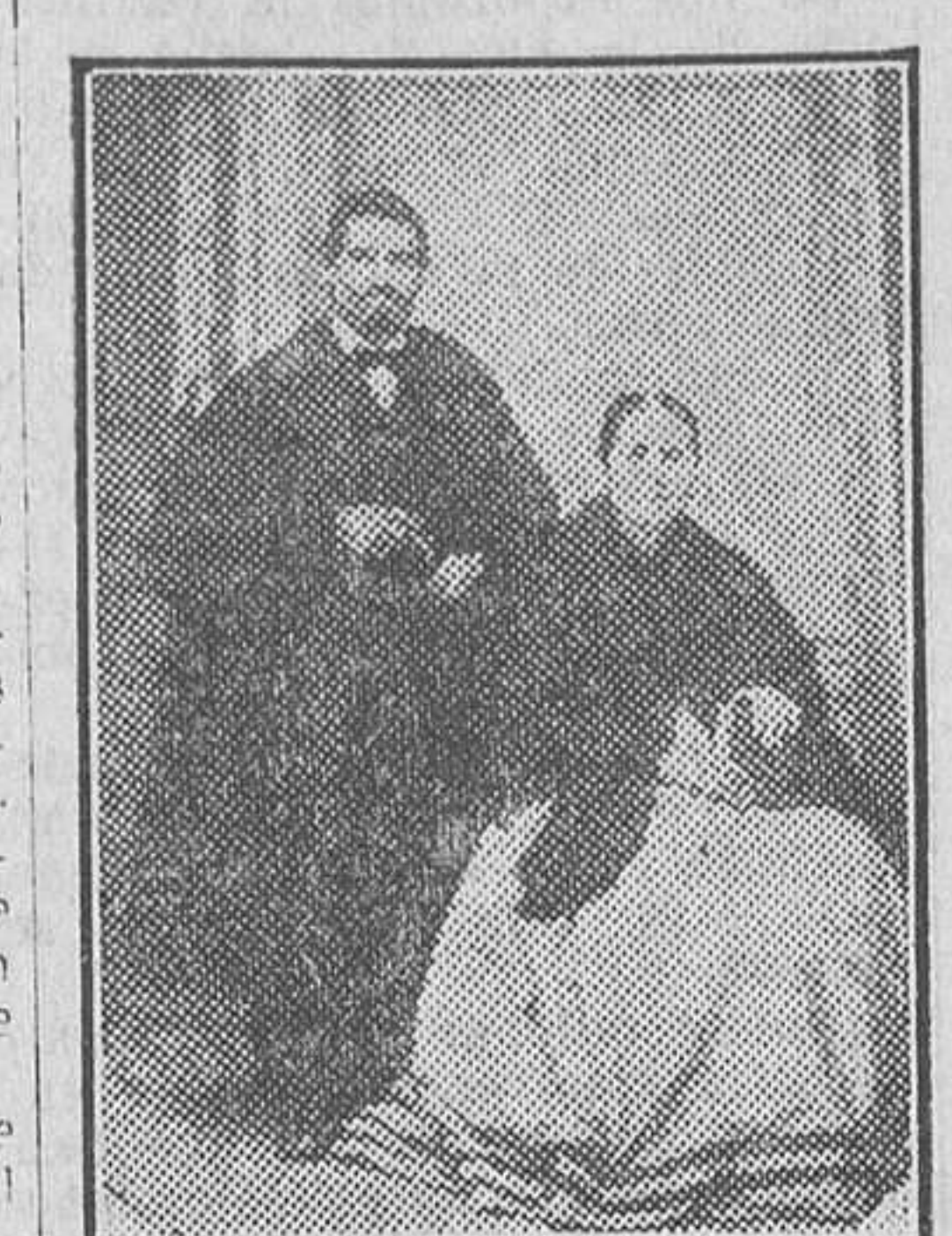
Los padres de Quejido

Era su padre un excelente oficial de tintorero, a quien jamás faltaba trabajo, no mal retribuido.