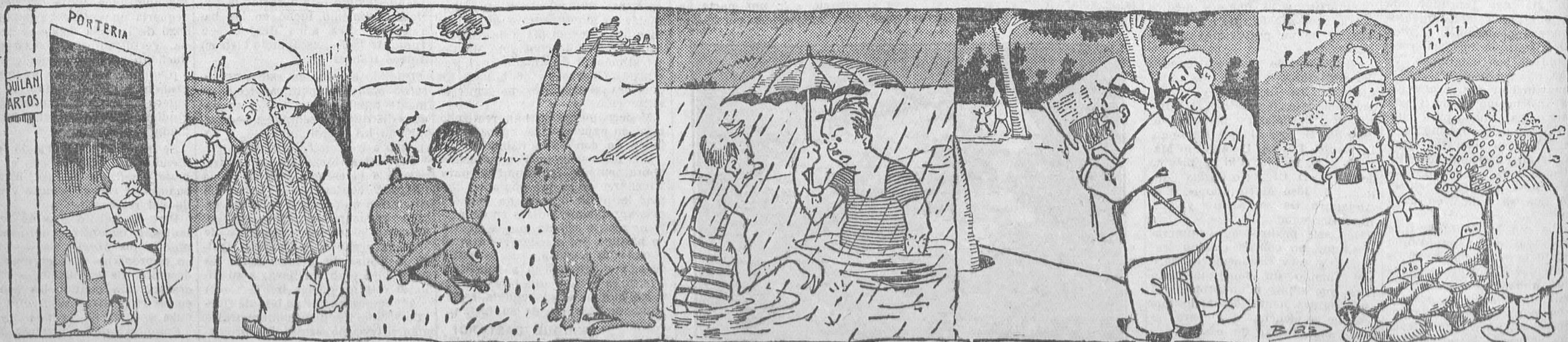
—¿Tiene usted la bondad de decirme, portero, el cuarto que tantísimo tiempo lleva sin alquilarse, en la terraza, ha bajado? —No, señor. Sigue arriba.