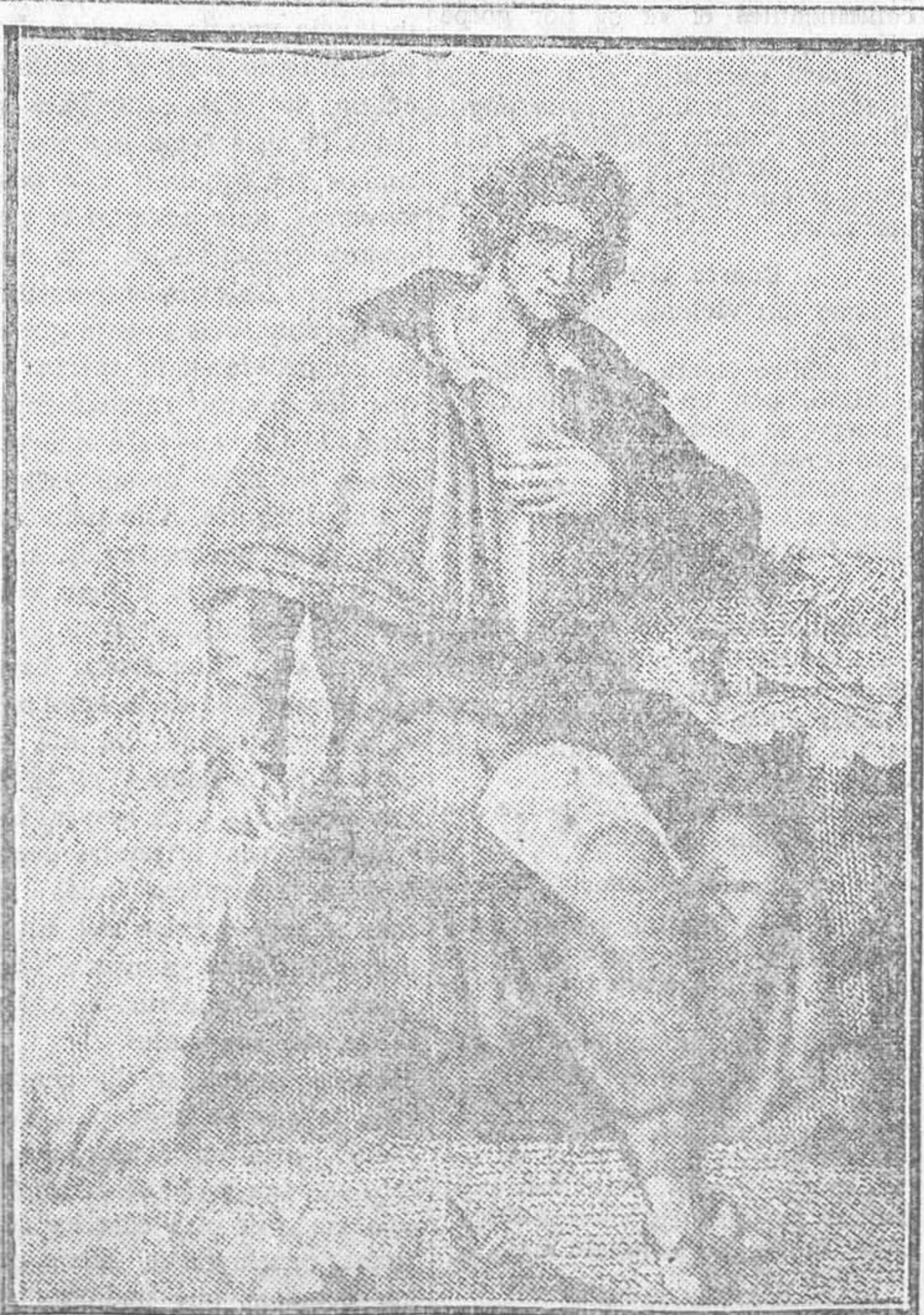
Ugo Foscolo, cuyo centenario conmemorará mañana solemnemente Grecia, donde residió muchos años el glorioso poeta italiano

Lea usted todos los domingos el suplemento literario de LA LIBERTAD. Se publican en él las novelas más famosas