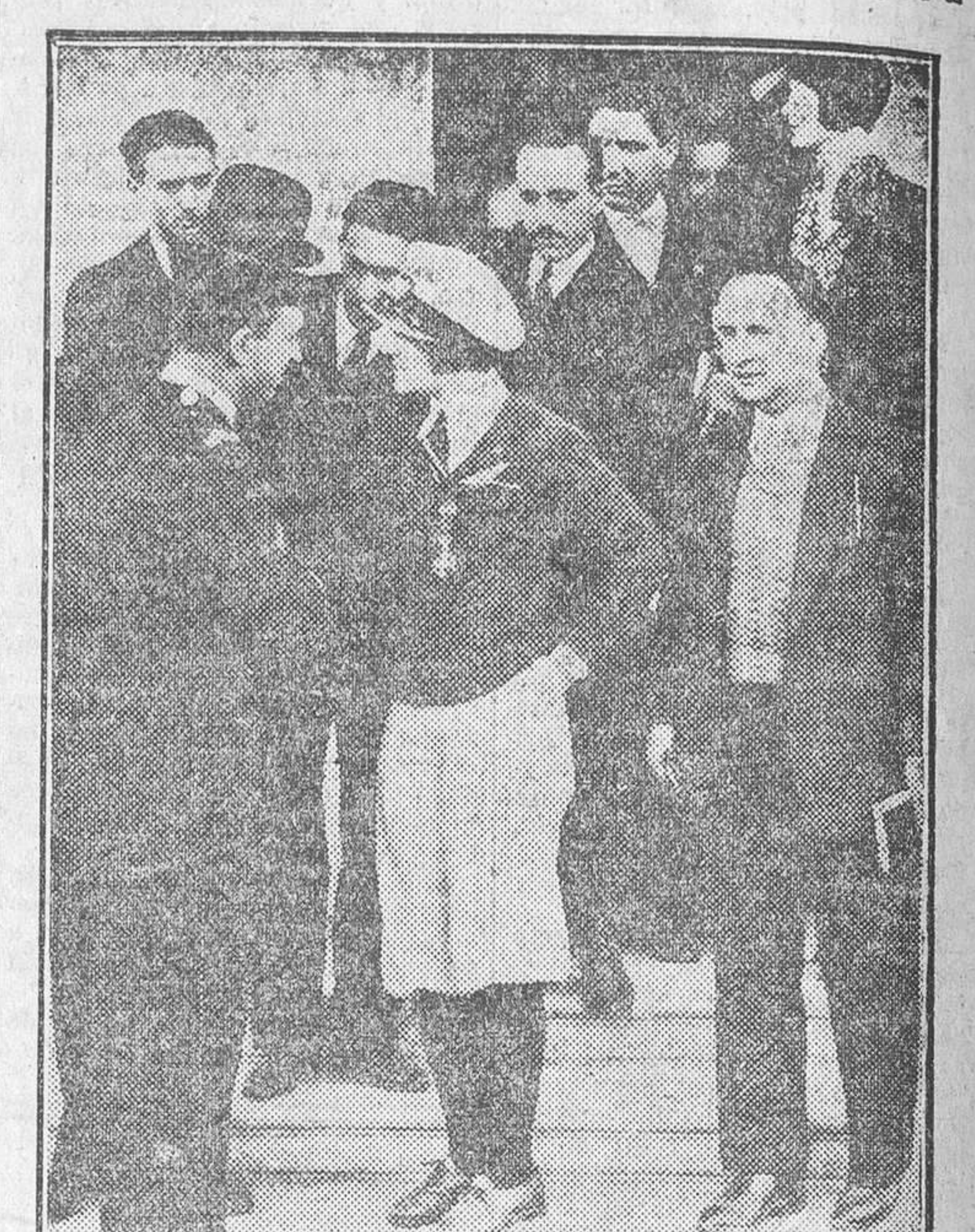
Ruth Elder en el aeródromo de Getafe, saludando a su llegada al jefe de la aviación española

Momentos de peligro El compañero Nogales sigue relatando: «A unos 200 kilómetros de Madrid notamos un ruido extraño en los motores, y de súbito vemos cómo uno de ellos, el del lado izquierdo, se para, ocasionando, un descenso rápido del avión. Confesamos que en este momento el instinto de conservación se sobrepone al interés profesional. Rápidamente me precipito sobre mi sillón y cojo el cinturón de seguridad. Ruth Elder, que ha visto mi precipitación, lanza grandes carcajadas, y me dice: —No tenga usted miedo; no pasa nada. El aparato sigue descendiendo muy suavemente, mientras el piloto lucha por conservar sólo con dos motores la altura necesaria para llegar a Madrid. Los demás viajeros se amarran también a sus sillones, y la misma Elder termina por dejarse amarrar también por Haldemann, que cuida de ella paternalmente. Por lo visto el piloto quiere evitar el aterrizaje y hay unos momentos de inquietud, en los que pasamos sobre la región montañosa del Tajo con el miedo de que no sea posible aterrizar ya. Ruth Elder estudia cuidadosamente la hábil maniobra del piloto, y nos dice, cuando advierte el vuelo normal del «Junkers» con sólo dos motores: