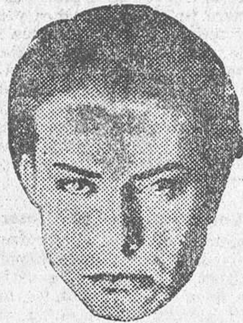
Ferreira de Castro

El último libro de Ferreira de Castro, el brillante escritor portugués que va en las avanzadas de la literatura contemporánea portuguesa, es éste a que su autor dió el título de "Sendas de lirismo e de amor", libro delicioso por la