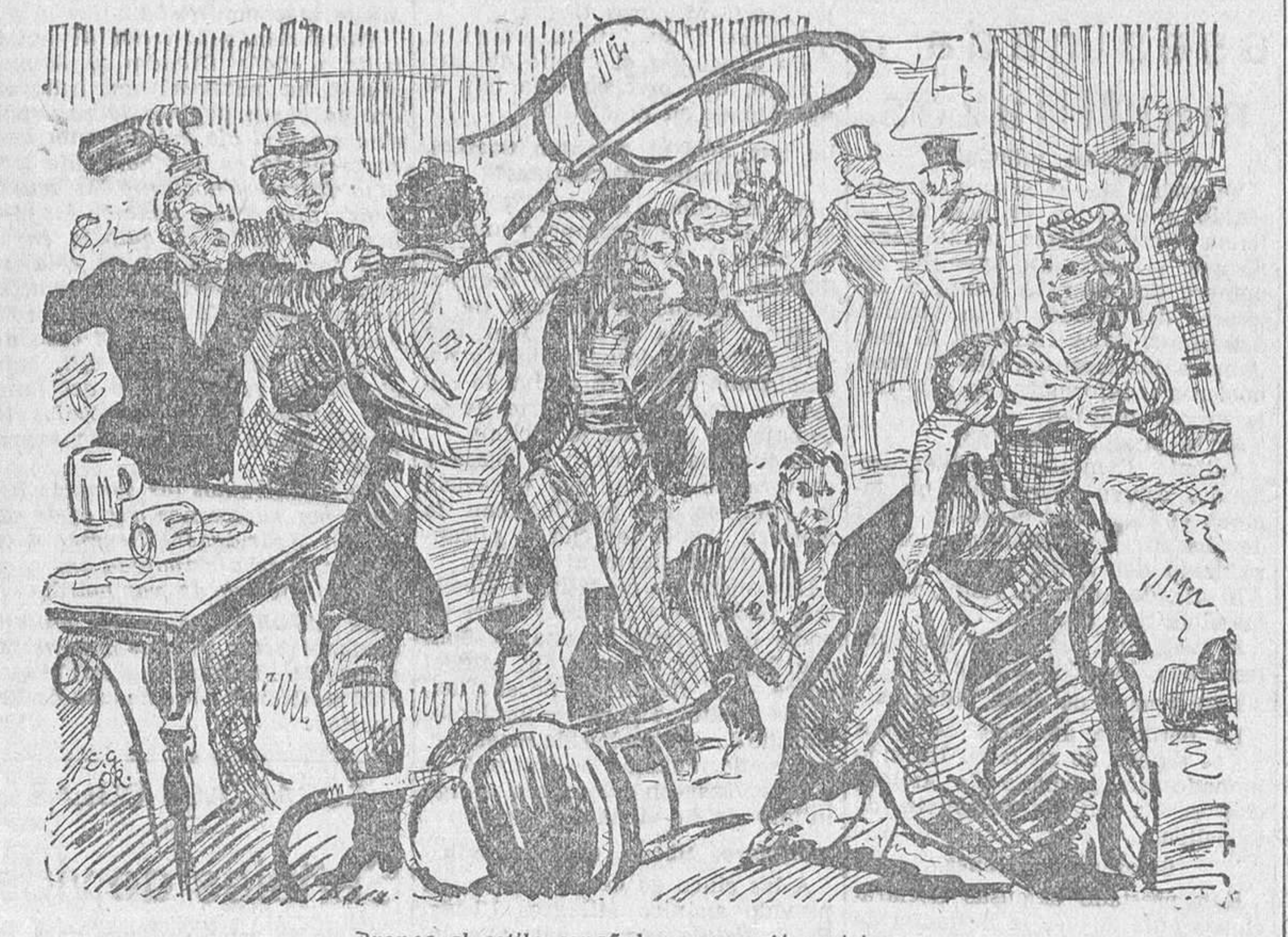
Bronca al estilo español en un café parisién (Estampa de Enrique Garcia Ormaechea)

—¡Un loco!—murmuró. —«Si; un loco, a quien al punto se le impuso el castigo que su atrevimiento merecía, pero por el cual se interesó el mariscal, hasta ordenar que le dejasen en libertad y no se le causara la menor molestia.» —Pues están ustedes aquí peor que estamos en España—intempusos con aire de compadecerme por