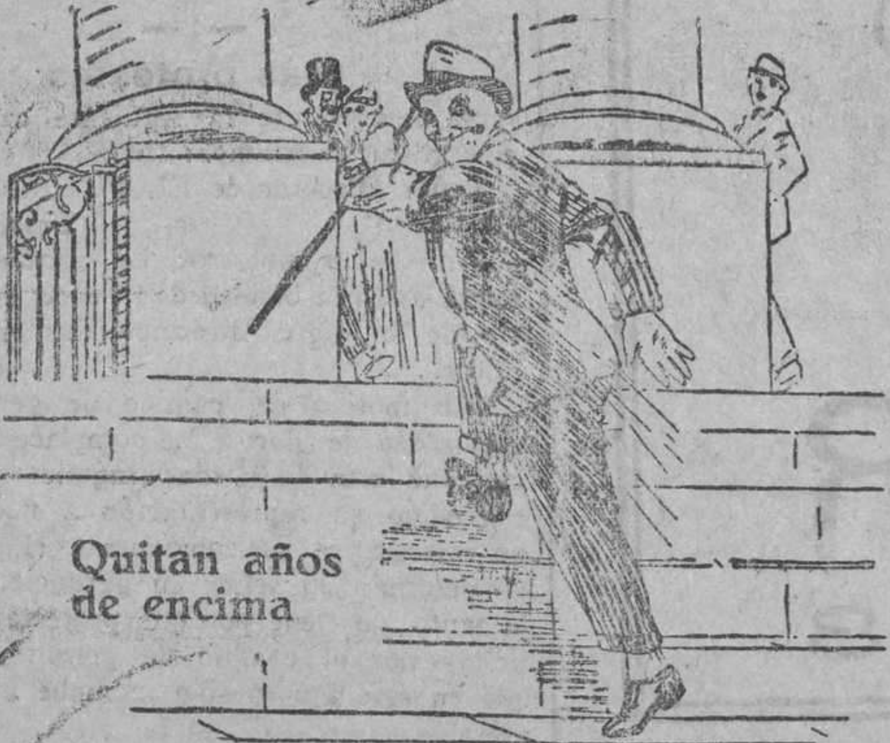
Quitan años de encima