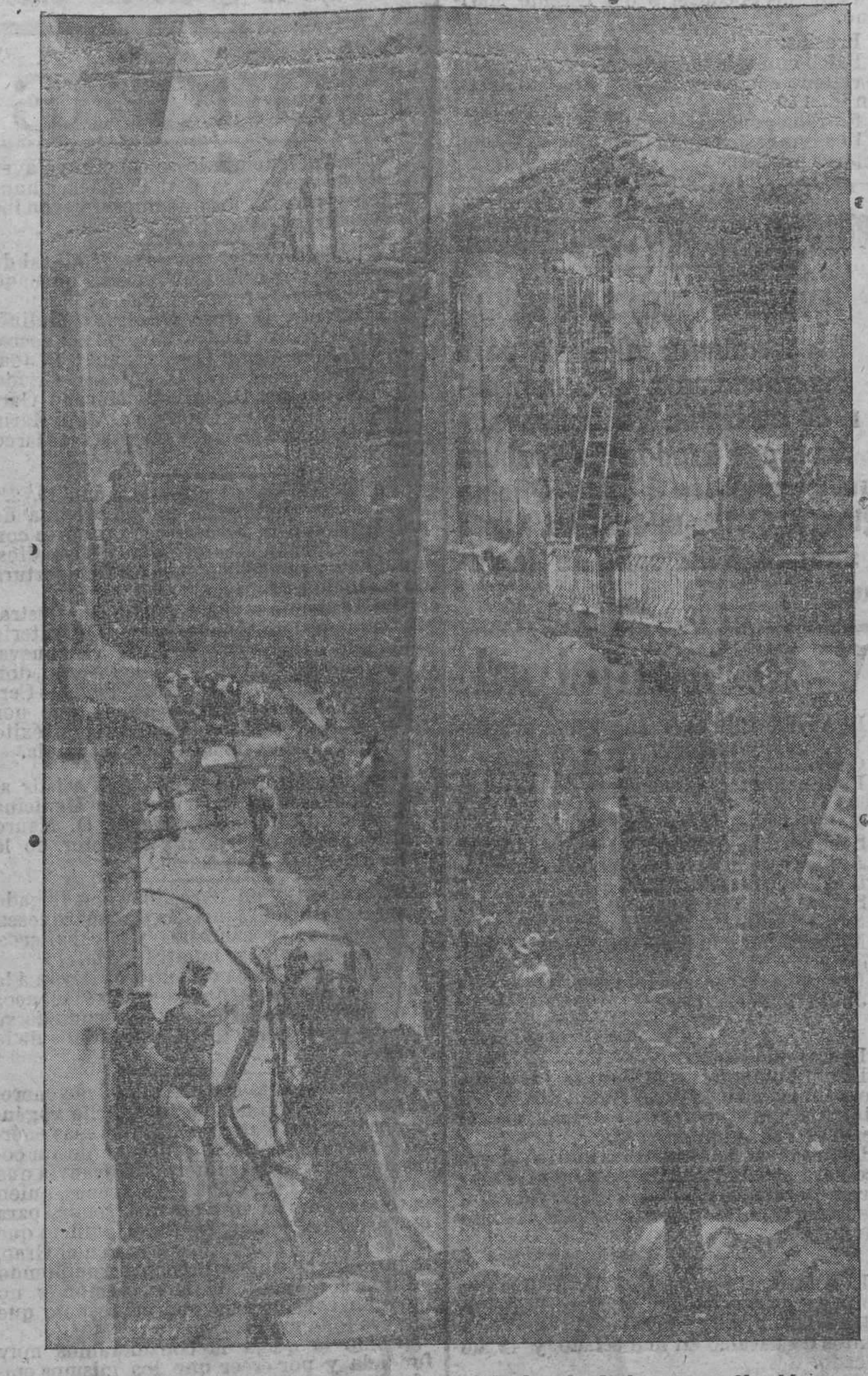
El edificio incendiado ayer, durante los trabajos de extinción.

Los bomberos trabajaron con ahínco, pero sus esfuerzos resultaban inútiles por la escasez de personal, por falta de agua y carencia de dirección. Y ahora el Alcalde, puesto en ridículo y fracasado como bombero mayor—único título que ostentaba hasta ahora—la emprende contra un empleado que no asistió al lugar del suceso.