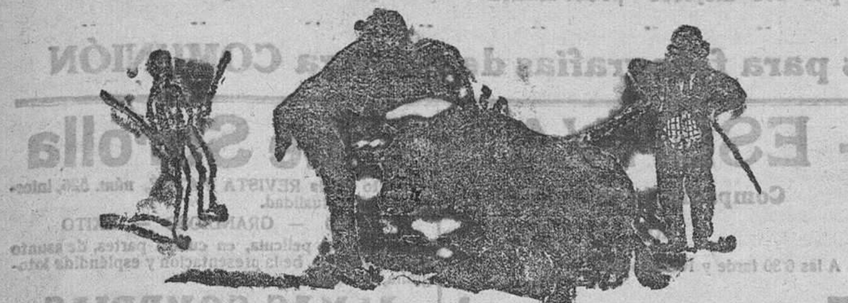
EXTRAORDINARIO ACONTECIMIENTO TAURINO