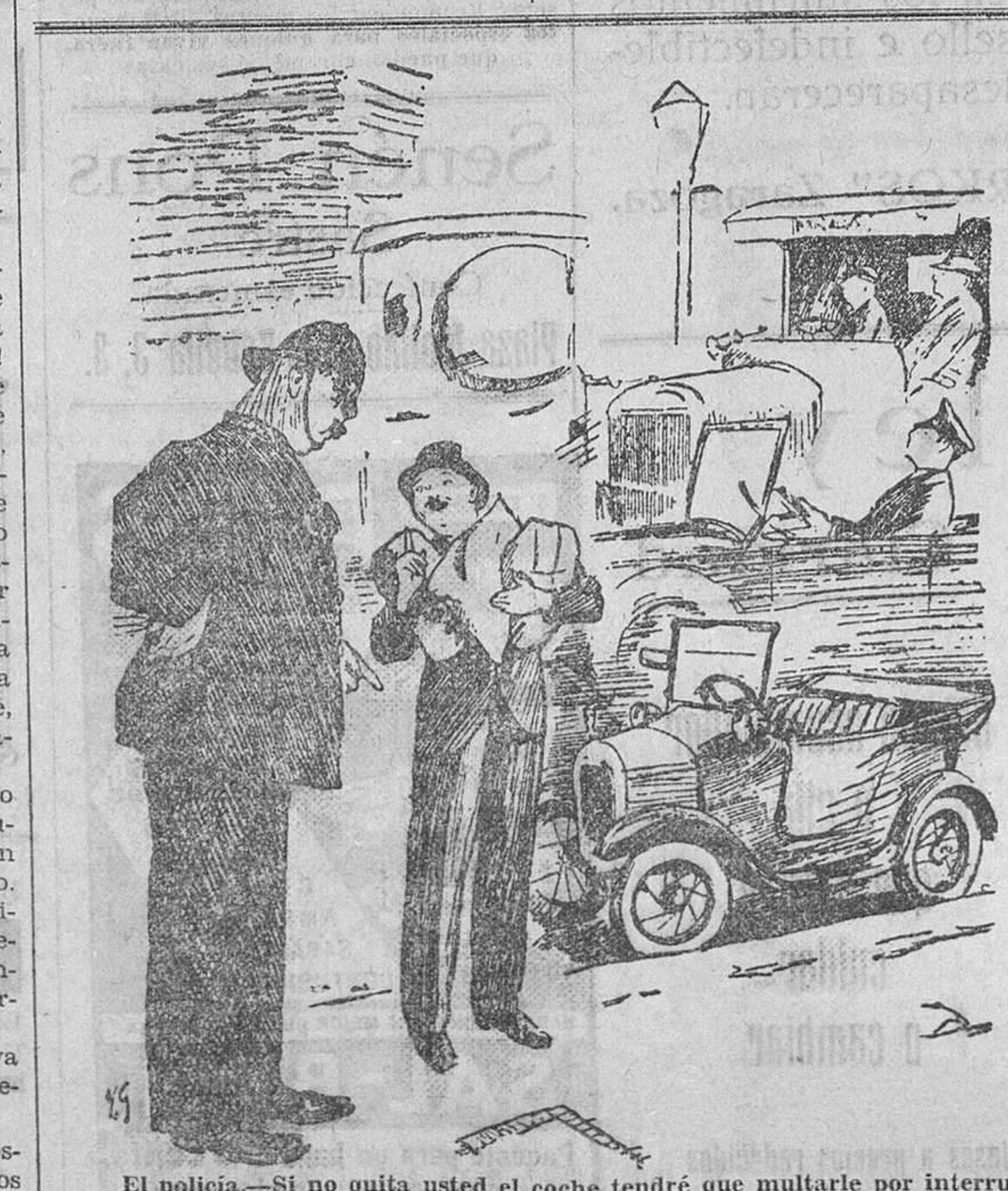
El policía.—Si no quita usted el coche tendré que multarle por interrumpir la circulación. El dueño del coche.—¿Adulador! (De 'The Humorist', de Londres.)

DOCTOR MUÑOZ CARBONERO. Medicina - Rayos X. Paz, 36 Valencia.