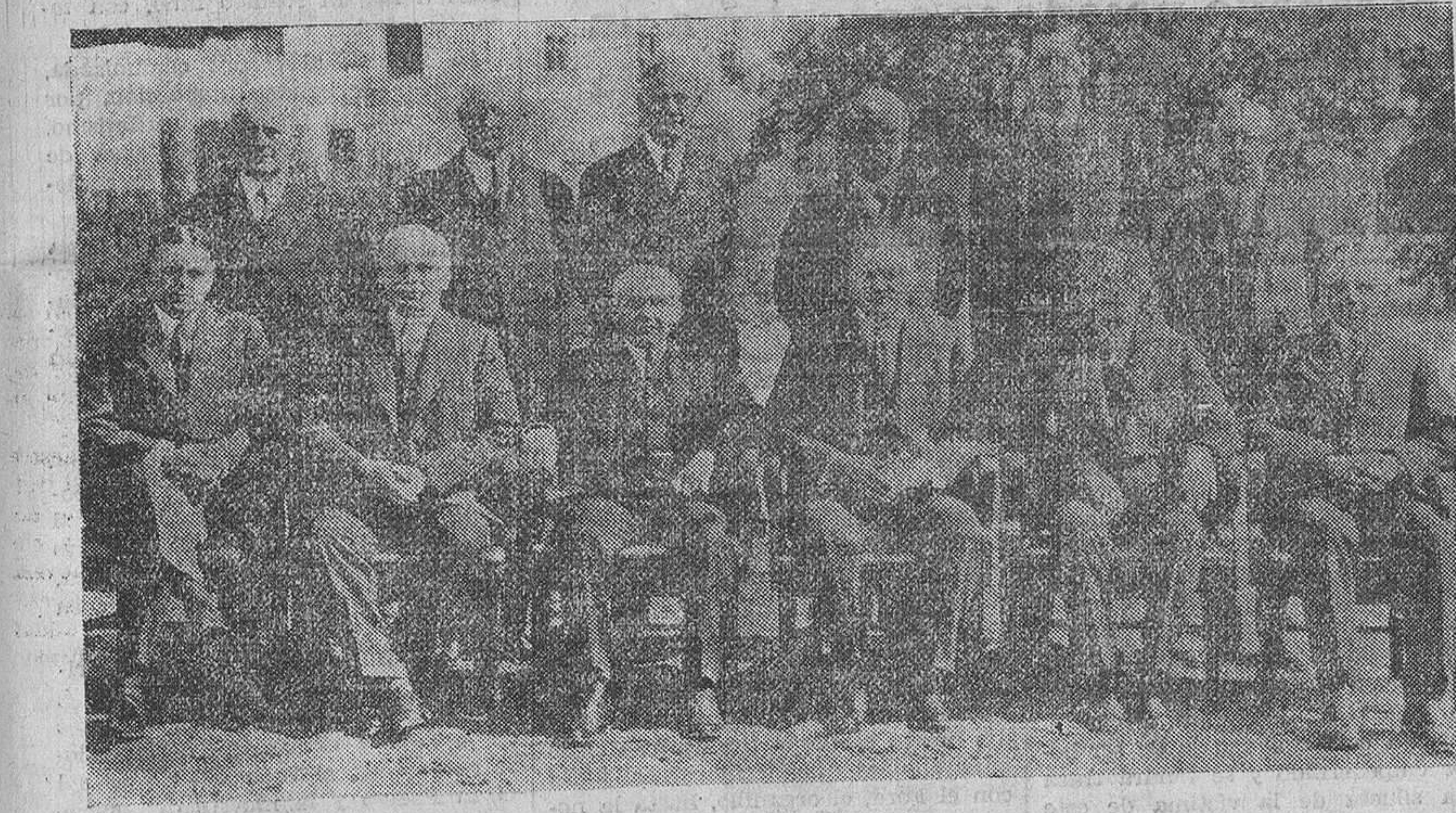
EL NUEVO GOBIERNO NORTEAMERICANO. El presidente Hoover y el vicepresidente, Curtis, con los ministros. De izquierda a derecha, sentados: Brown, de Comunicaciones; Good, de la Guerra; Kellogg, de Estado; Mellon, de Hacienda; Mitchell, de Justicia. De pie: Davis, de Trabajo; Lamont, de Comercio; Hyde, de Agricultura; Wilbur, de Gobernación, y Adams, de Marina.

«El Diluvio» publica el siguiente artículo: «Un novelista, Blasco Ibáñez, ha tenido que rectificar los errores groseros acumulados por los historiadores en torno de la enigmática figura de Colón.