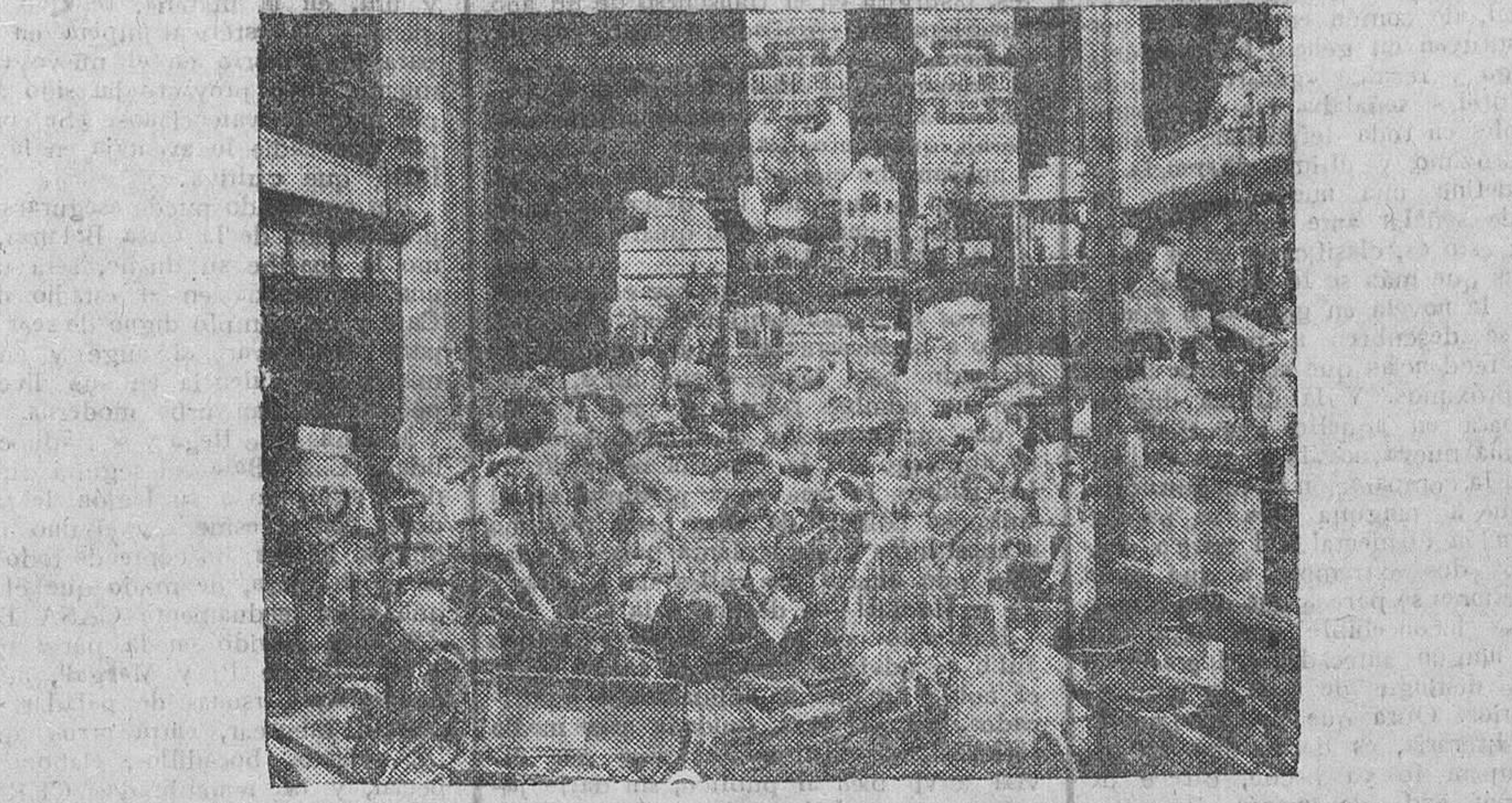
Los juguetes que han de ser repartidos entre los niños que asistían a los bailes organizados por los periodistas

He aquí la relación de los niños que asistieron al baile organizado por la Asociación de la Prensa, todos ellos ricamente vestidos: