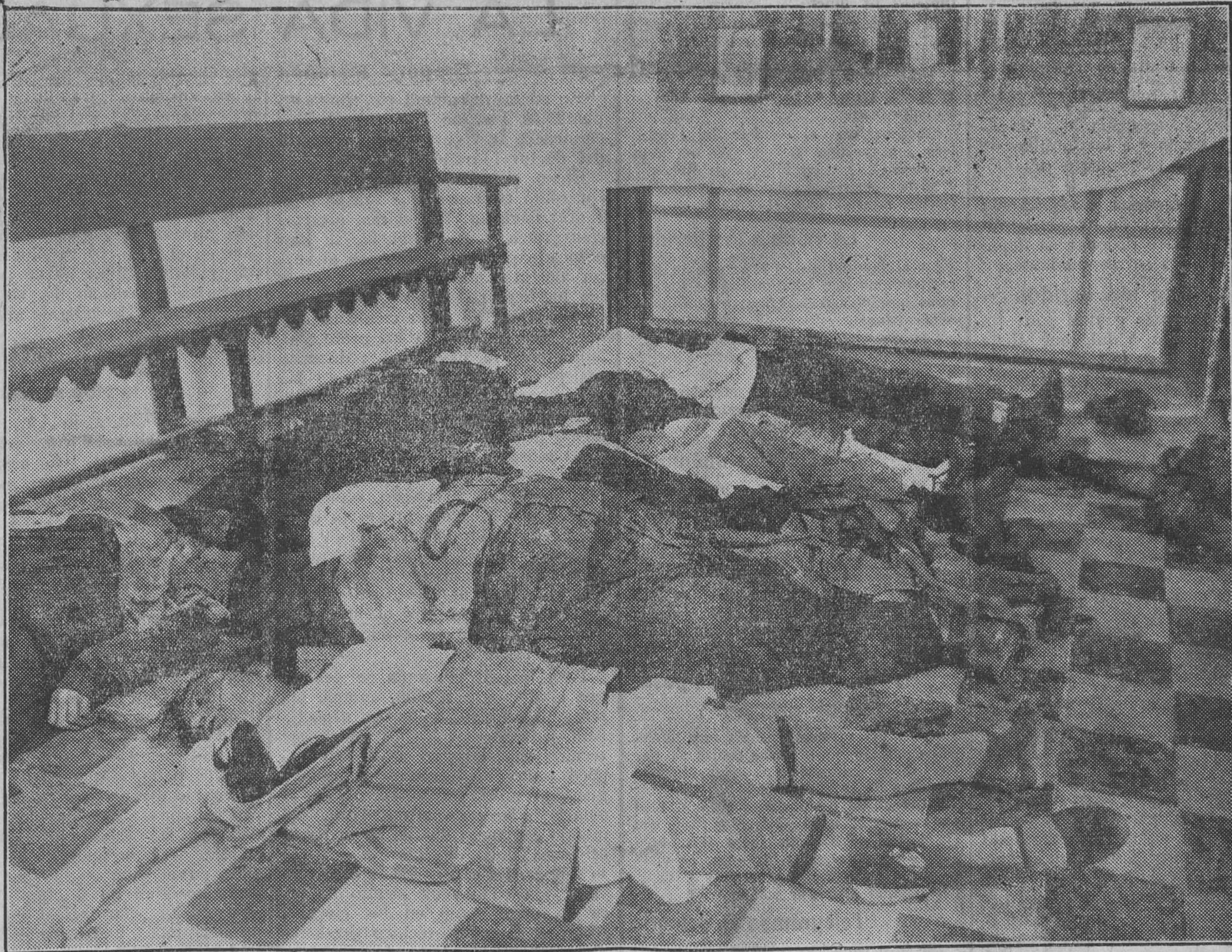
LOS CADAVERES DE LAS VICTIMAS EN LA IGLESIA DEL CEMENTERIO

Afortunadamente dicho empleado no ha corrido el menor riesgo y se halla cumpliendo con su deber, prestando sus servicios en Ametlla, como así lo ha comunicado a su familia.