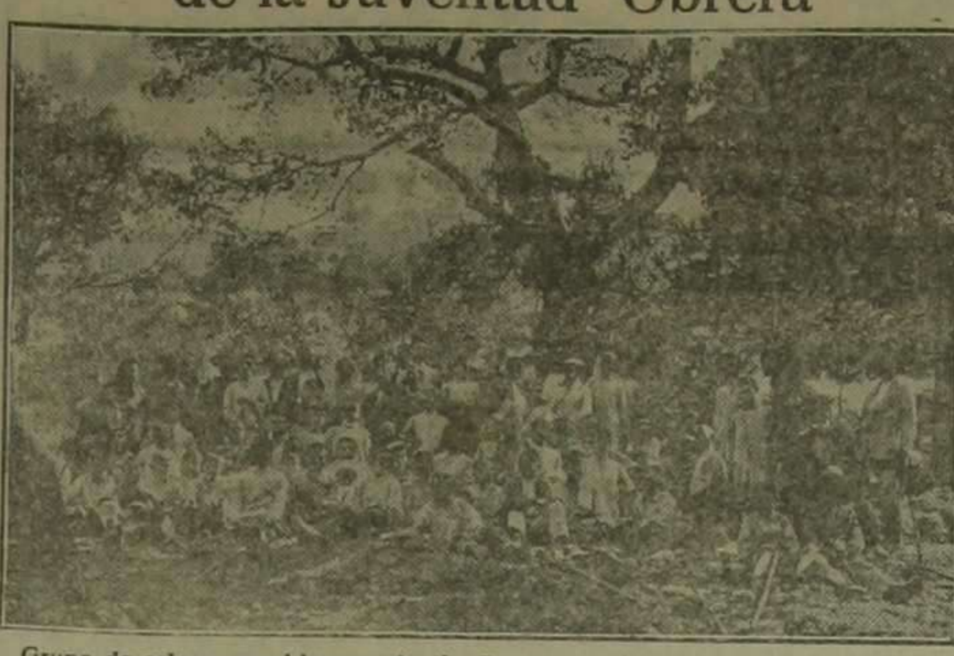
Grupo de colonos en el bosque de "La Prunera", junto a la Casa de San José, para la Colonia del Patronato.