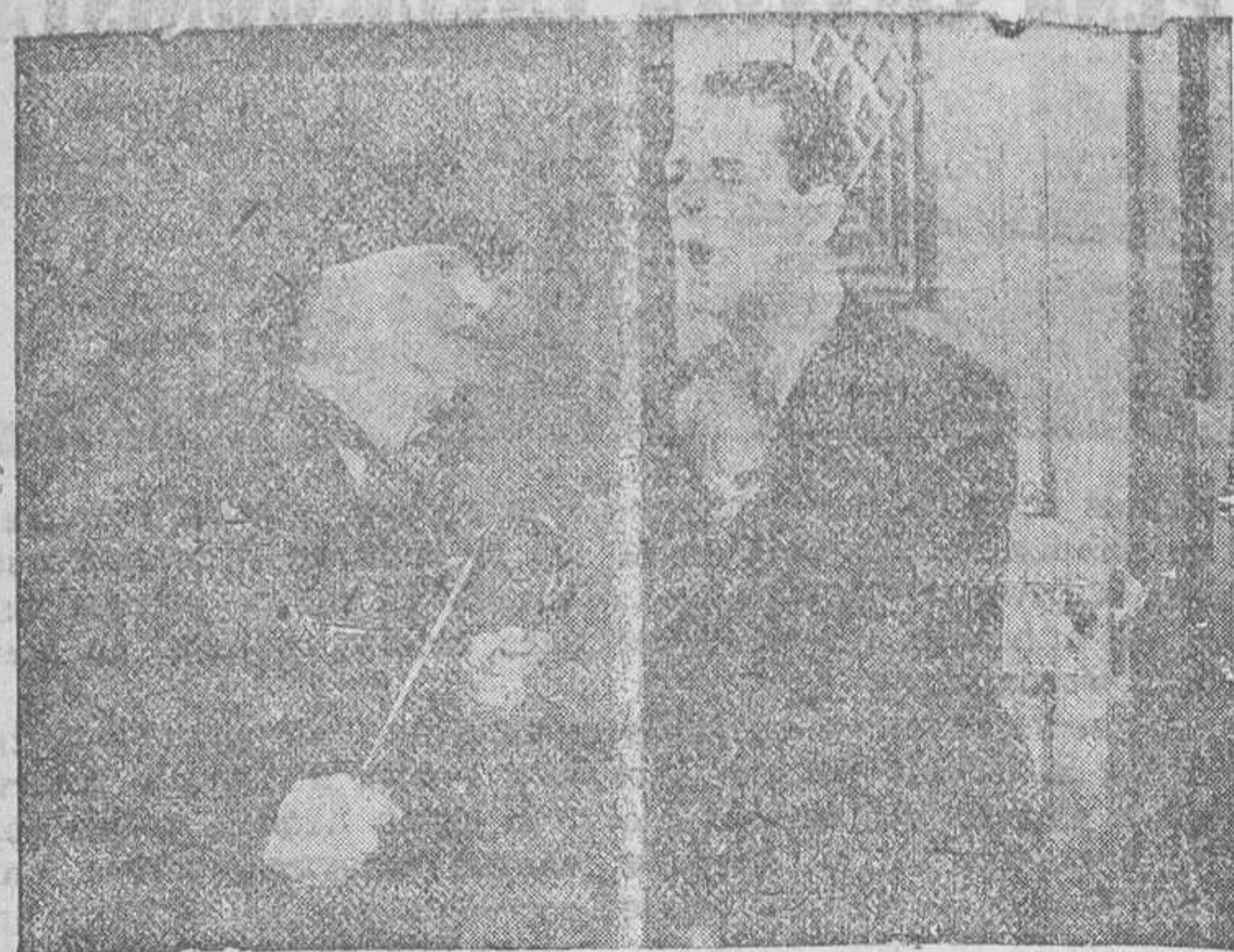
He aquí a Reginald Denny, el famoso actor de la Universal, en una graciosísima escena de la película titulada «El vértigo».