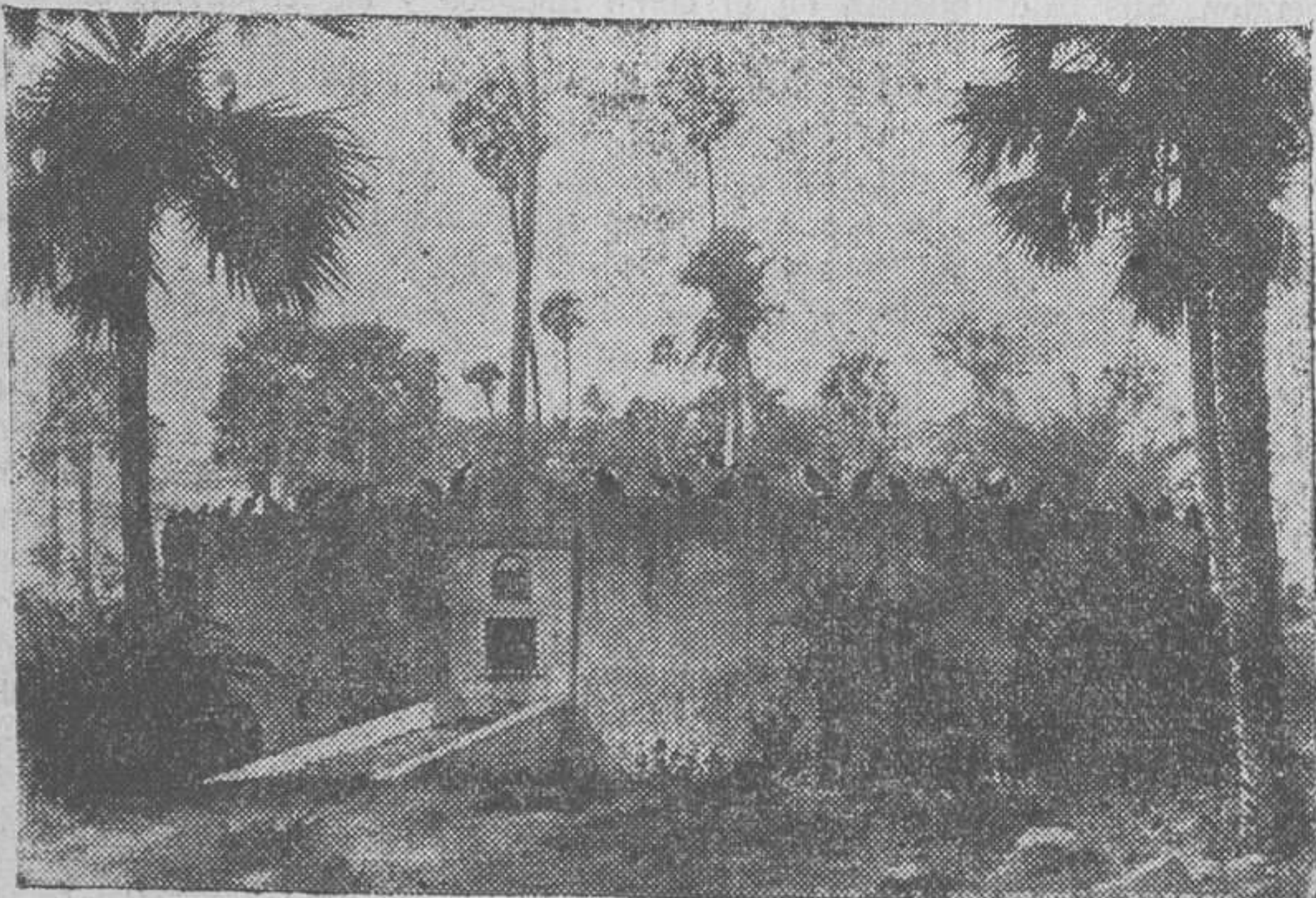
Las tétricas torres del silencio

Abajo continúan sonando los gritos de la niña gorda y sus violentas cabalgadas a lomos de los pobres animales, que se resisten a tal deporte.