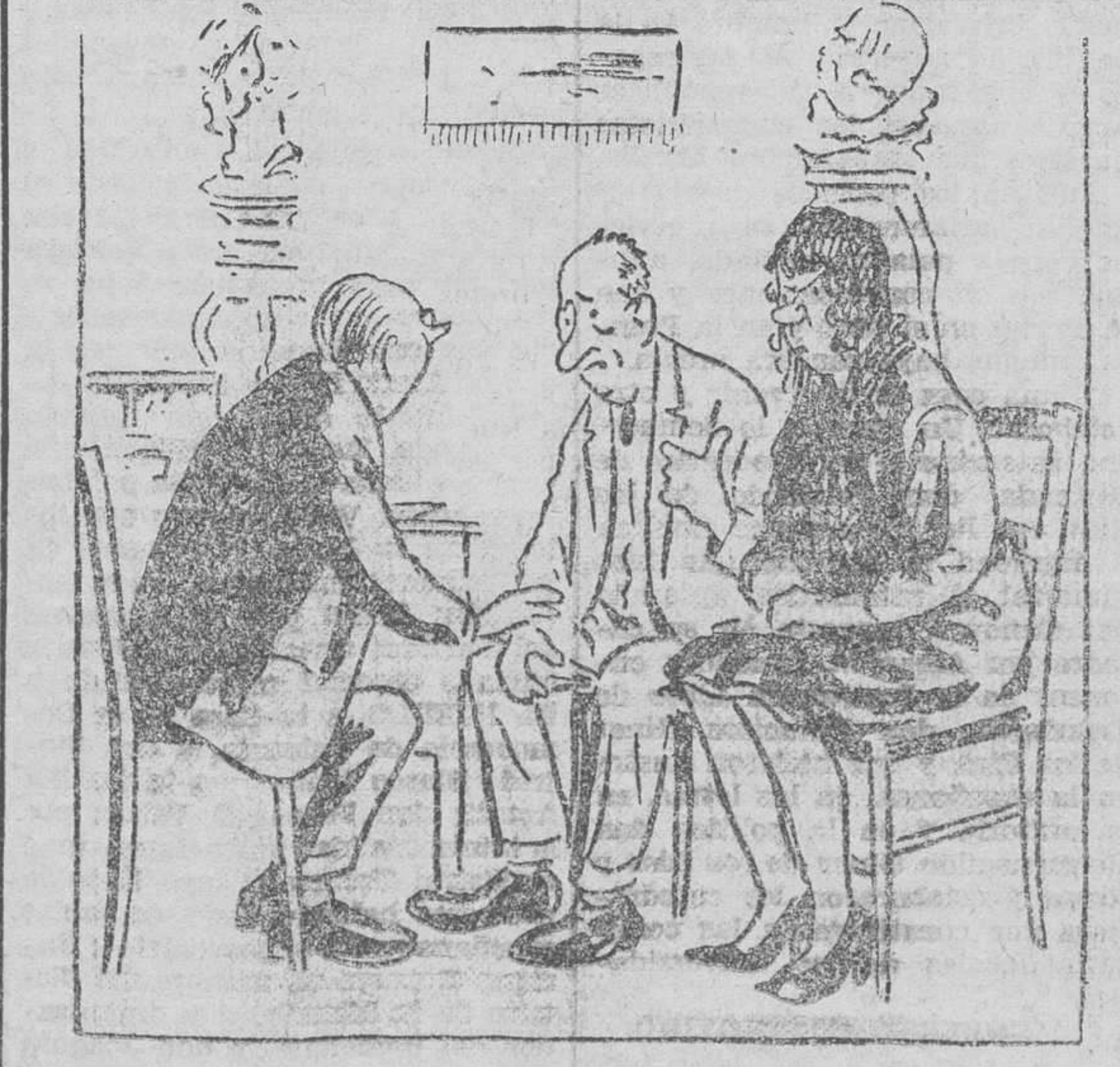
—Pues, ahora, el médico le ha prohibido a nuestra hija tocar el piano. —Será vecino, ¿verdad?