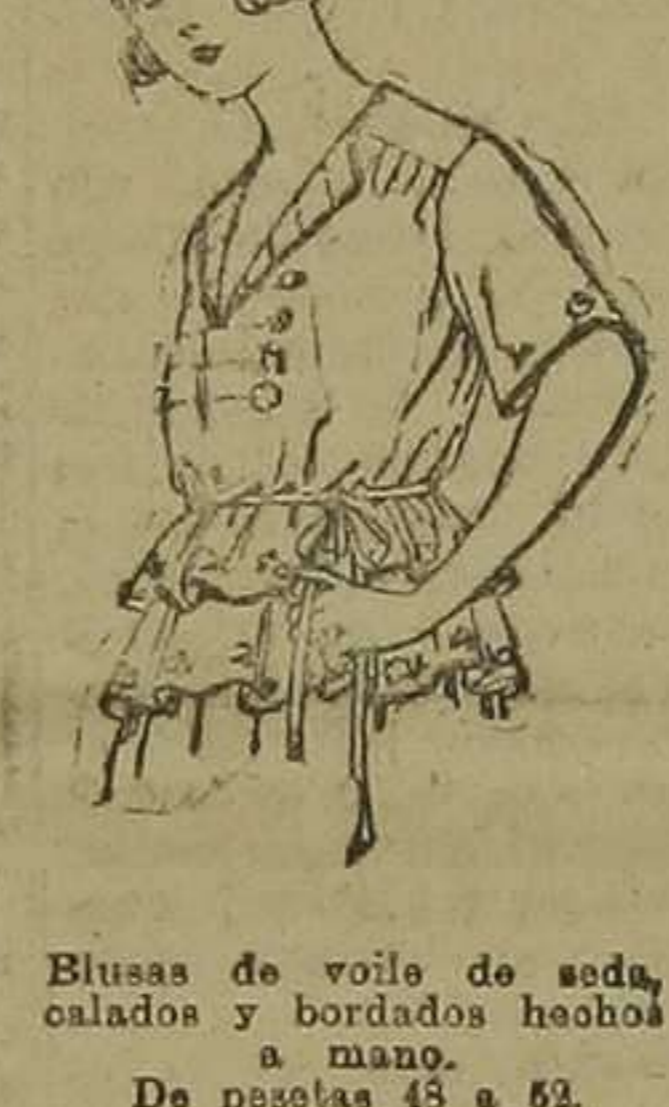
Blusas de voile de seda, caladas y bordadas hechas a mano. De pesetas 45 a 62.