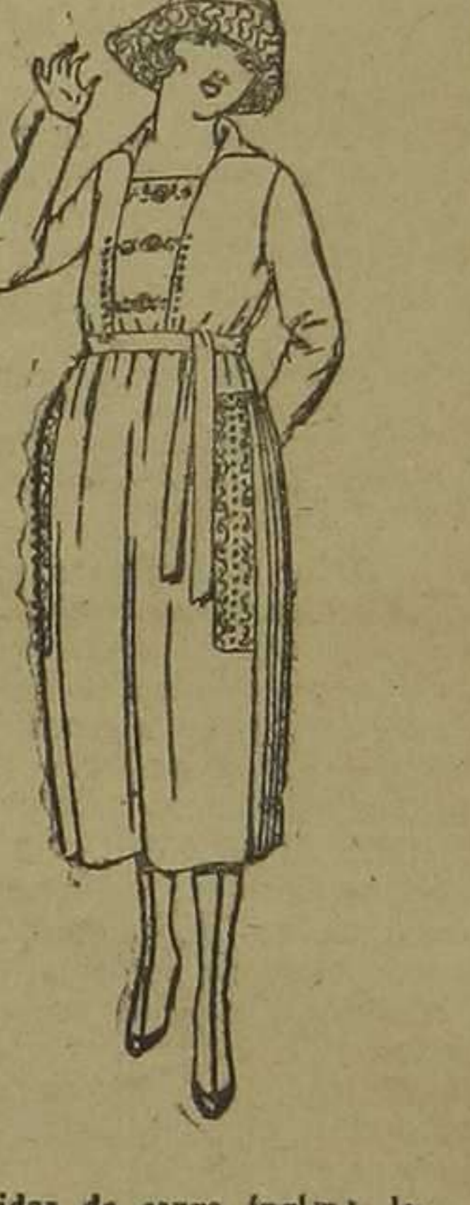
Vestidos de sarga inglesa, la- nilla, etc., en negro, azul y color, adornos bordados. De pesetas 105 a 130.