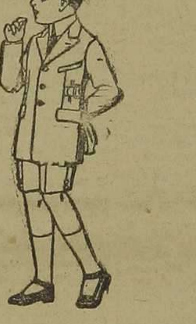
Trajes modelo Sport, de lanilla, estambre, melton, etcétera, para niños de 7 a 12 años. De pesetas 28 a 50.