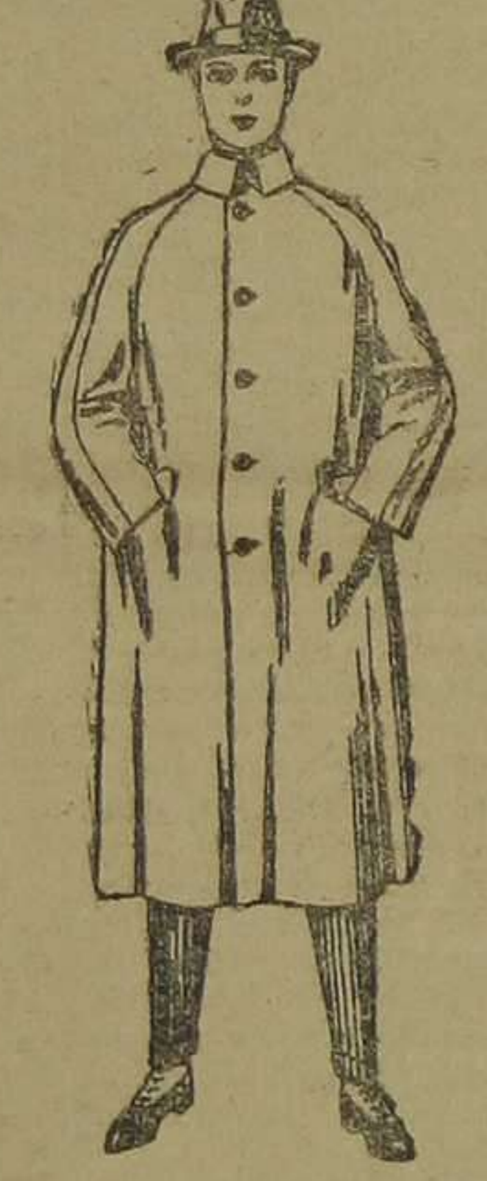
Galones de patén oxford o cover. De pesetas 90 a 150.