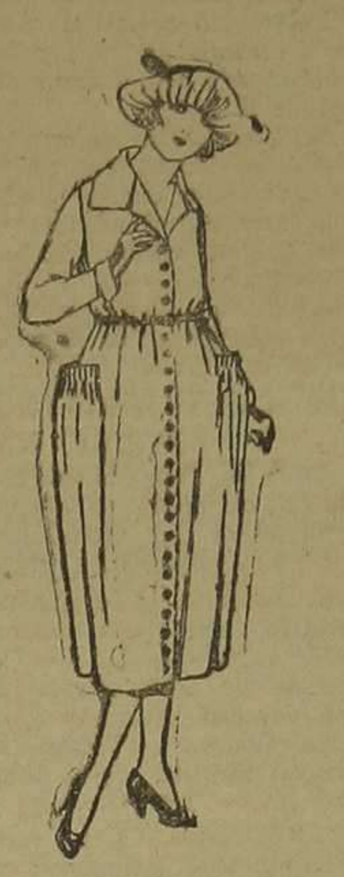
de gabardina, lanilla, estambre, etc., en negro, azul y color. De pesetas 100 a 130.