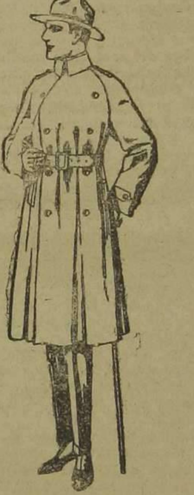
Gabanes impermeabilizados con distintivo «American trench coat». De pesetas 200 a 350.