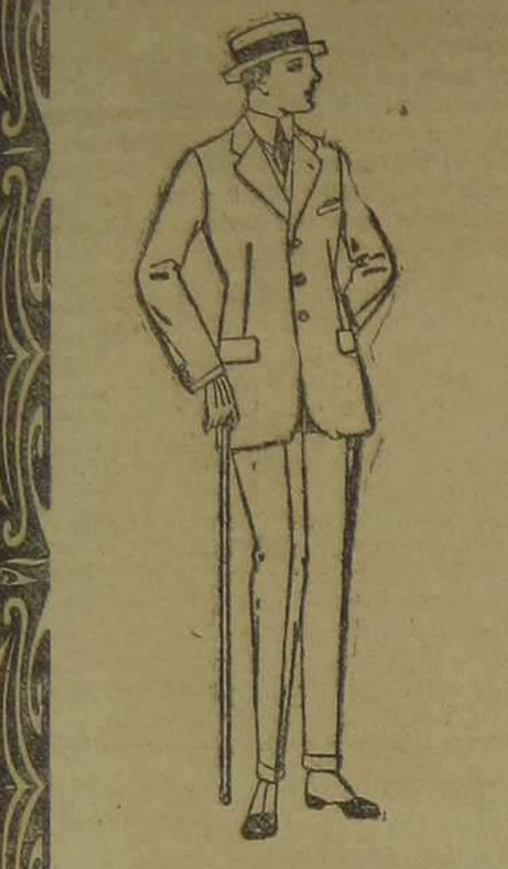
Trajes de lanilla, melton, estambre, vicuña o jaqué. De pesetas 38 a 195.

SUCURSALES Madrid, Barcelona, Alicante, Almería, Bilbao, Cádiz, Cartagena, Gijón, Granada, Málaga, Palma de Mallorca, Santander, Sevilla, Valladolid y Zaragoza