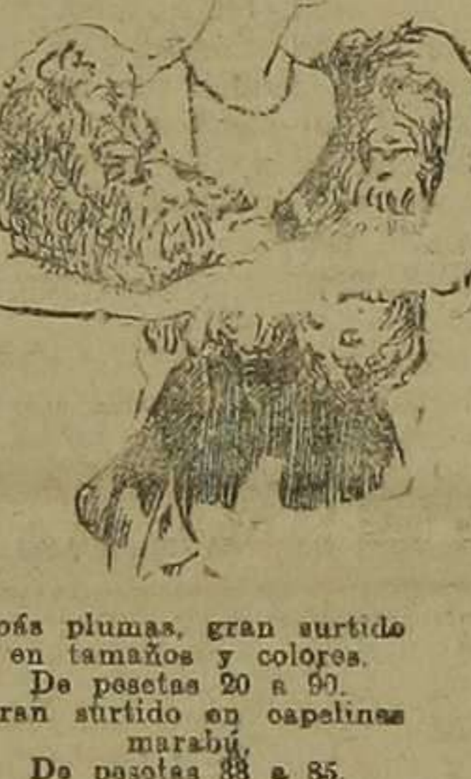
Bolsas plumas, gran surtido en tamaños y colores. De pesetas 20 a 50. Gran surtido en capelines marabú. De pesetas 38 a 85.