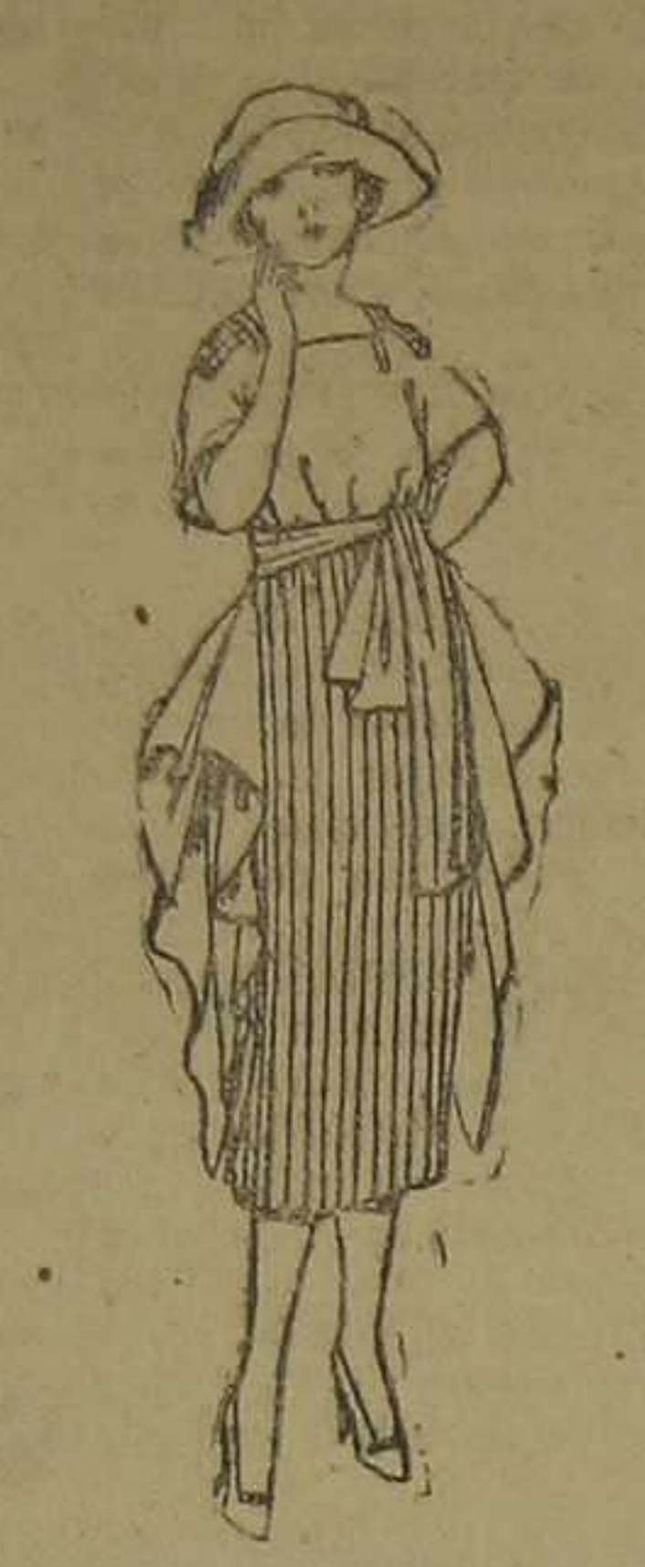
Vestidos de stamín blanco, azul y color. De pesetas 50 a 74.