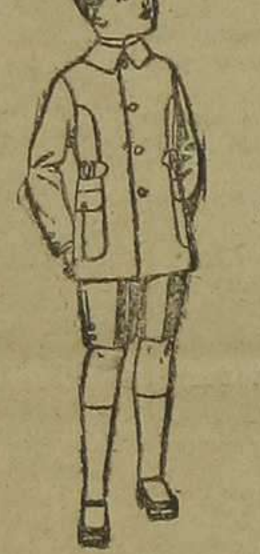
Trajes modelo Sport, de lanilla, estambre, melton, etcétera, para niños de 4 a 9 años. De pesetas 30 a 48.