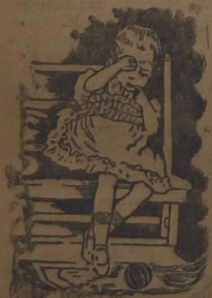
Caja-estuche, 1'25 pias.

No admita otro específico: "DENTINA CAÑIZARES" solo se vende en su envase de origen (modelo registrado) caja-estuche metálico con las dos figuritas de las niñas. Laboratorios y farmacia Cañizares. Caballeros, 47, Valencia.