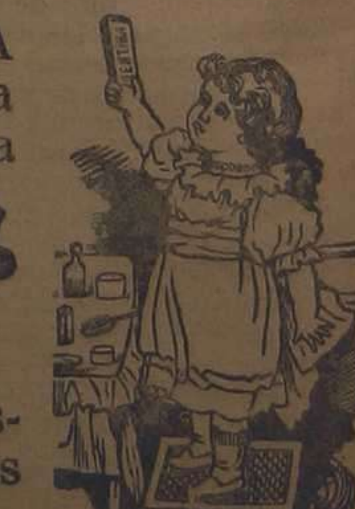
Caja-estuche, 1'25 pias.