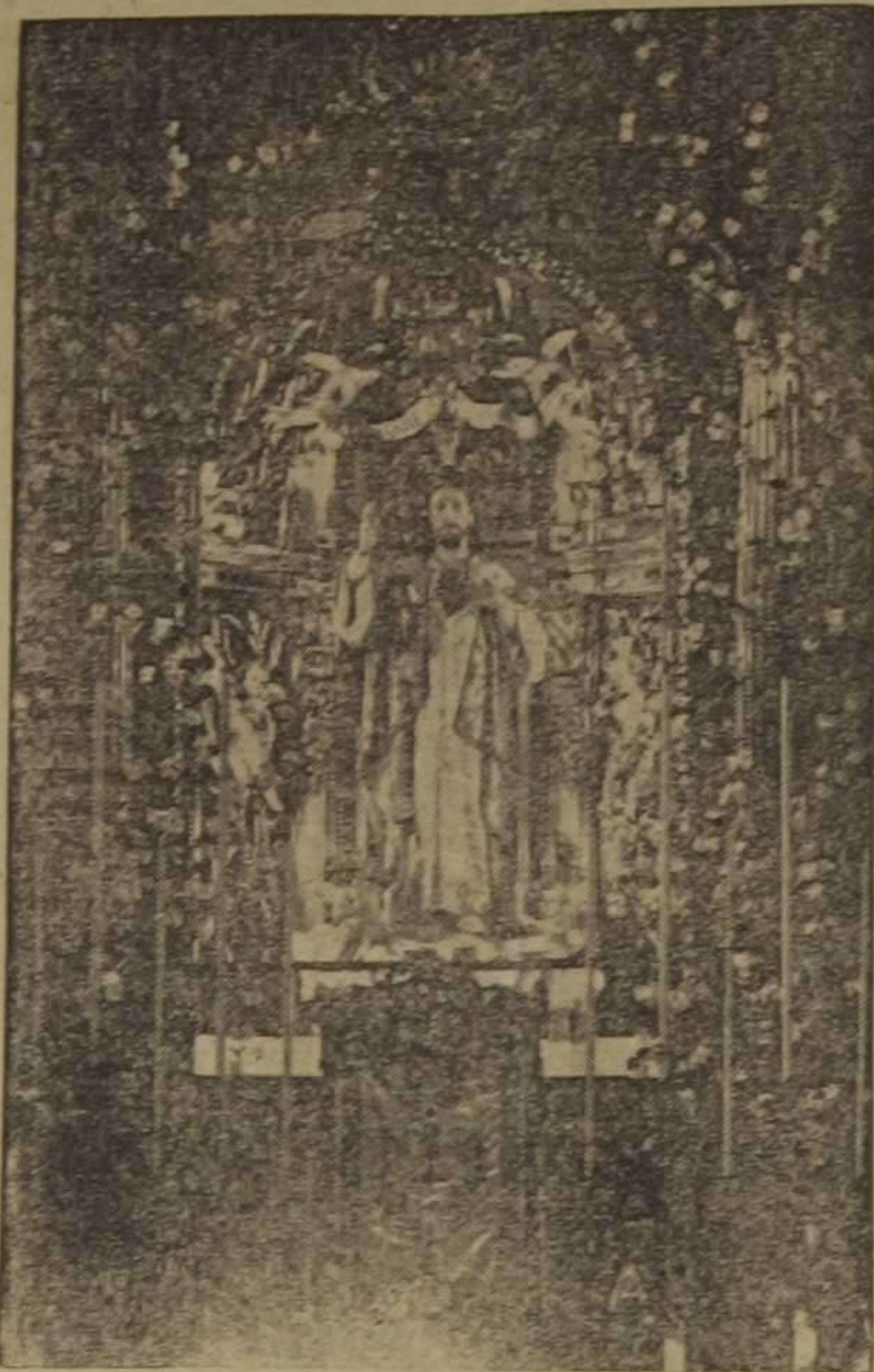
Nuevo altar e imagen del Sagrado Corazón de Jesús, de la parroquia de San Andrés de esta capital.

Con motivo del solemnisimo novenario que al Divino Corazón se está celebrando en la parroquia de San Andrés, han llamado poderosamente la atención de los fieles las importantes reformas y completa restauración que se han verificado en la hermosa capilla del Sagrado Corazón, cuya imagen escultórica se estrenó el pasado año.