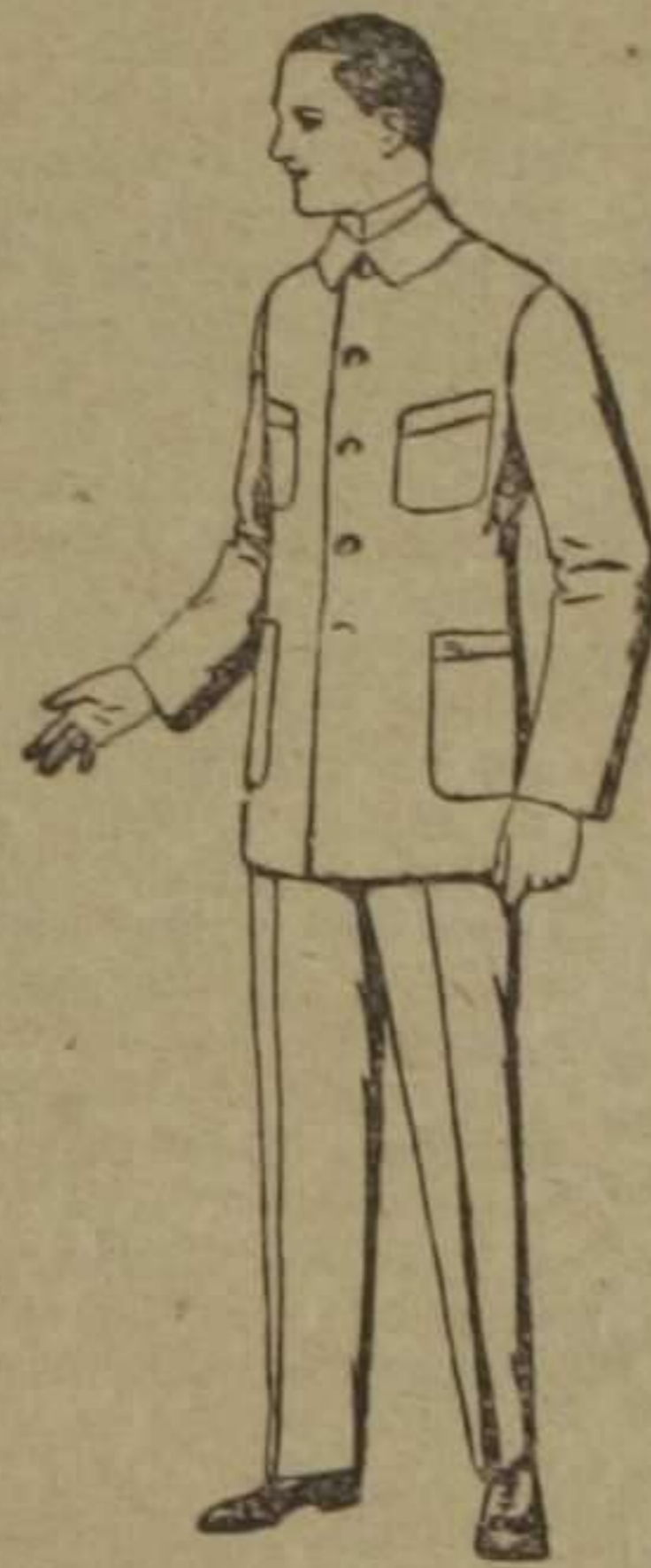
Traje de dril azul, para mecánicos. De pesetas 17 a 25

Camisería, Géneros de punto, Corbatería, Guantería, Sombrería, Zapatería, Paraguas, Bastones y Artículos de viaje.