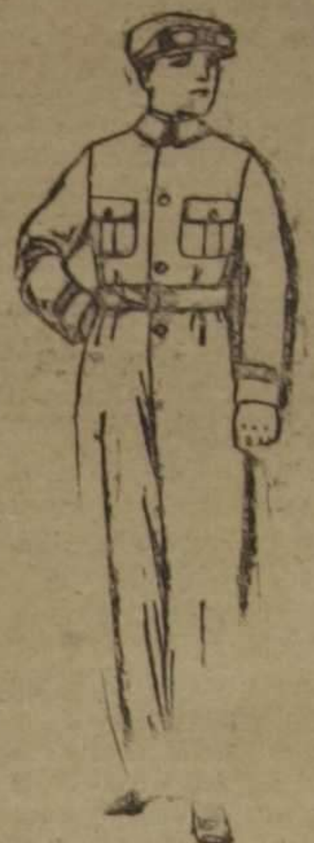
Trajes de dril azul, beige, kaki, etcétera, para aviadores, motociclistas, mecánicos, etc. De ptas. 13 a 25