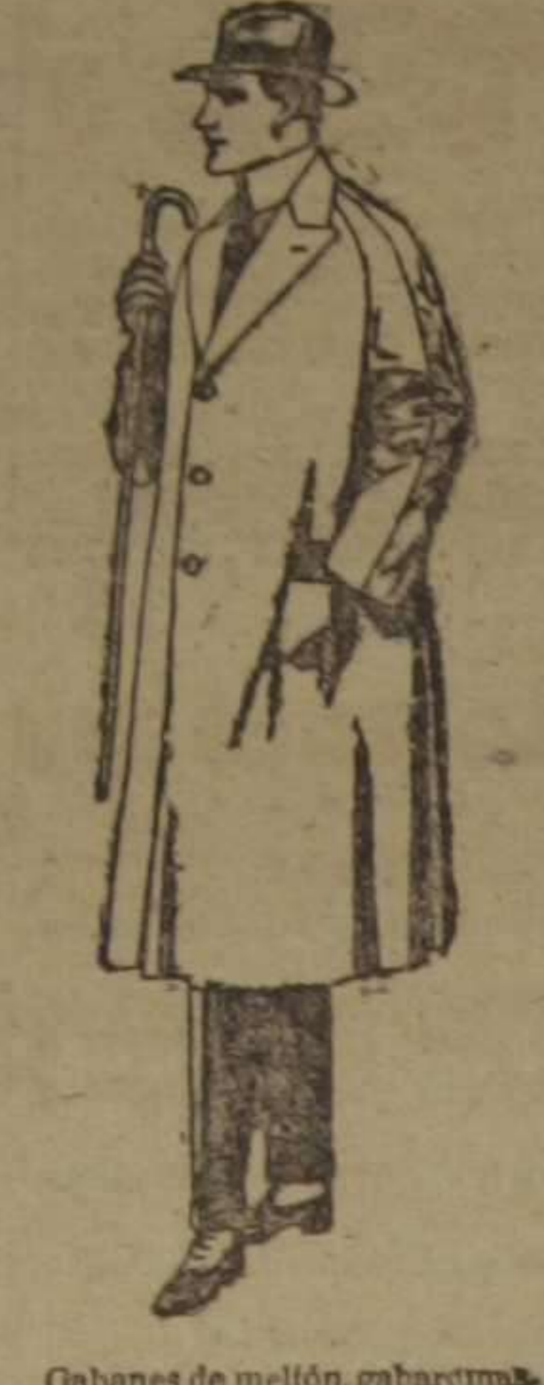
Gabanes de melón, gabarerna, etcétera. De ptas. 70 a 150. Los mismos a medida. De ptas. 85 a 200