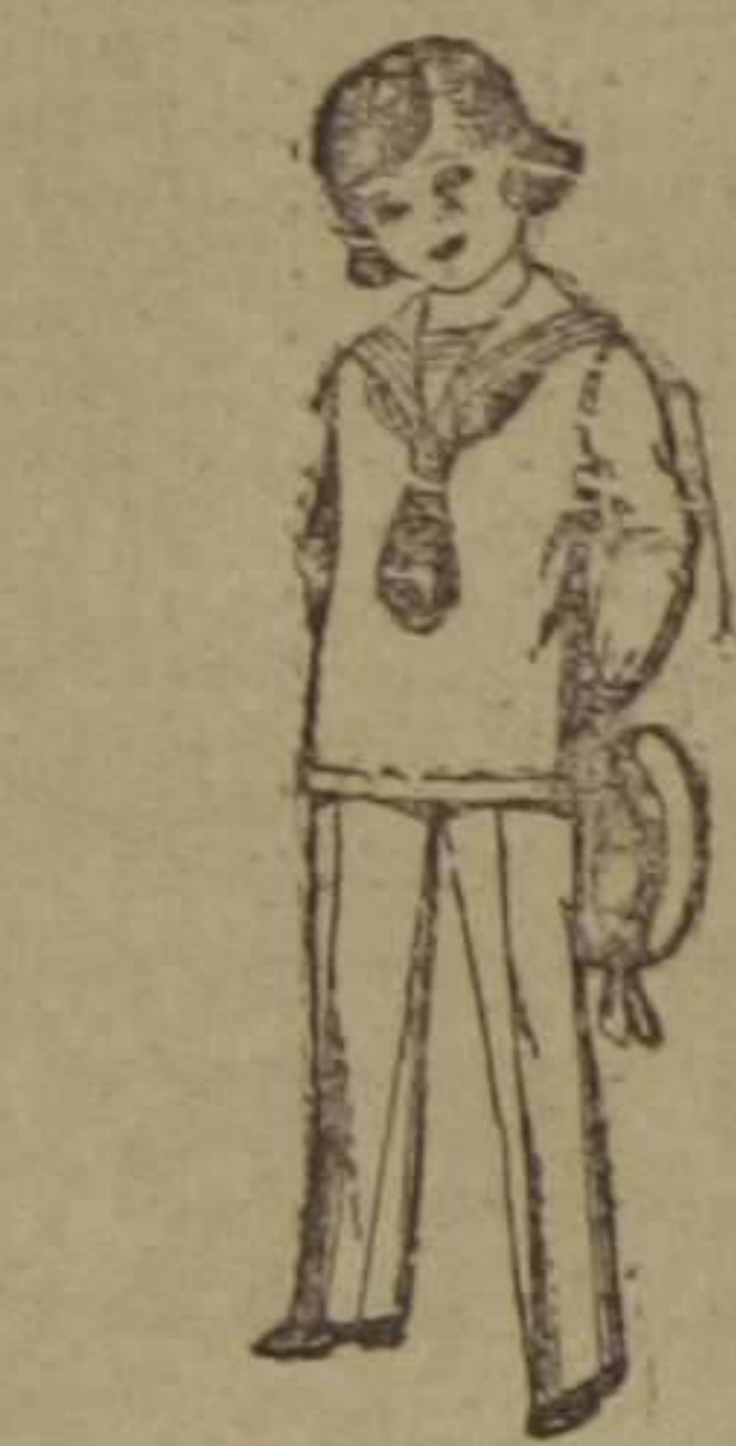
Trajes modelo "Marinera", de dril o algodón blanco, para niños de 1 a 9 años. De ptas. 14 a 24