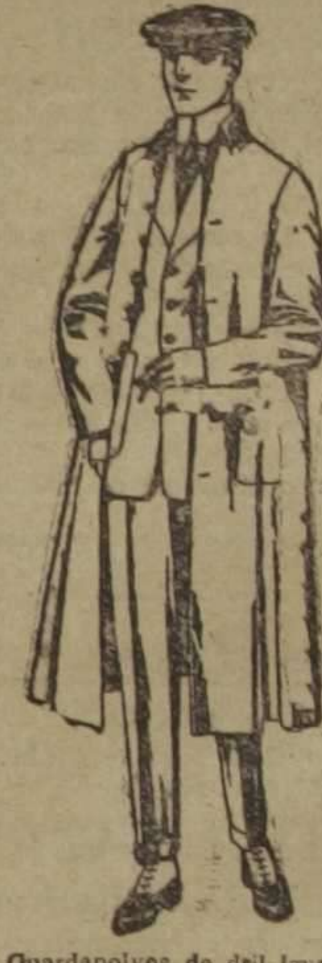
Guardapolvos de dril, igual al modelo. De ptas. 10 a 16