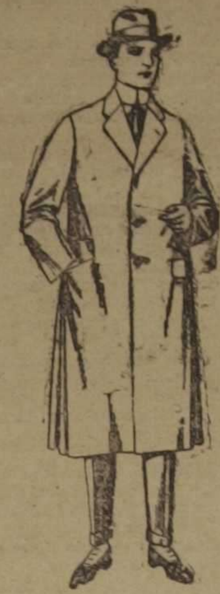
Gabanes de gamuza, melón, etcétera. De ptas. 45 a 125. Los mismos a medida. De ptas. 80 a 150