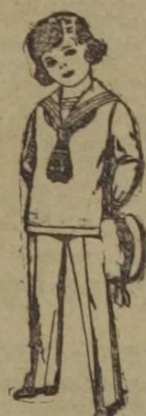
Trajes modelo "Marinera" inglesa, de vicuña o estambre, azul y negro para niños de 3 a 9 años. De ptas. 26 a 45