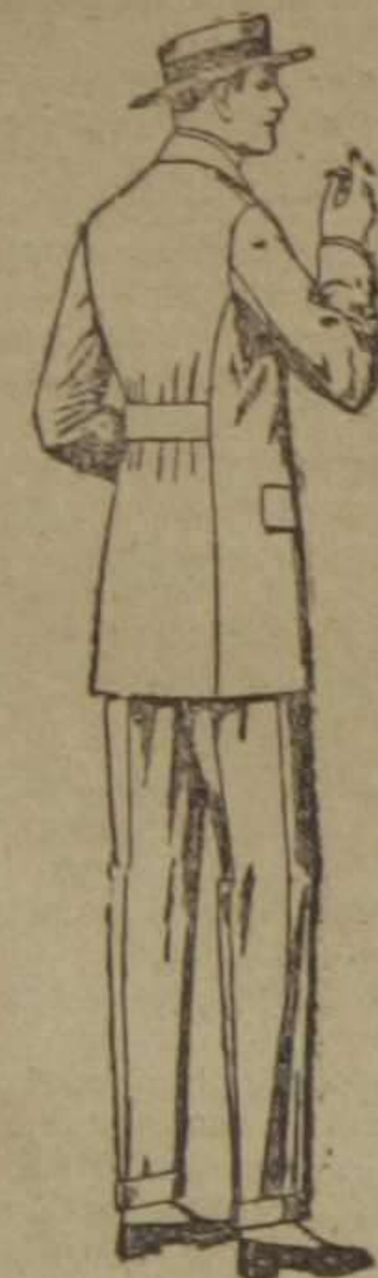
Trajes modelo sport, en dril, beige, lanilla o melón. De ptas. 20 a 118