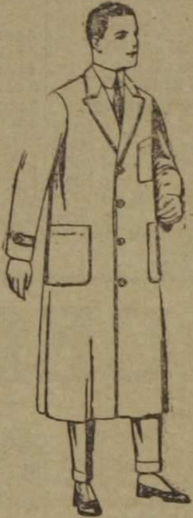
Batas de dril blanco para enfermeras. De ptas. 12 a 18

Ropas confeccionadas para caballero, señora, niño y niña.