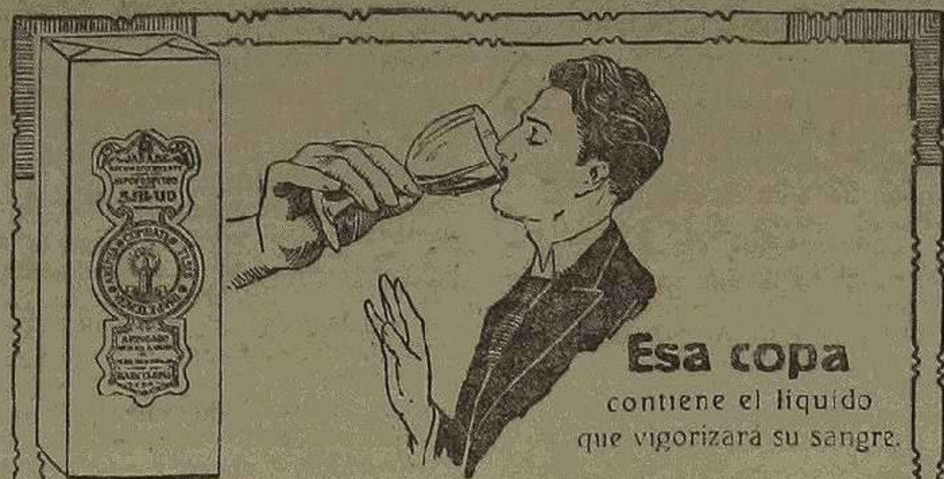
Esa copa contiene el líquido que vigorizará su sangre

EDITORIAL DEL DIARIO DE VALENCIA Se hacen toda clase de trabajos de imprenta