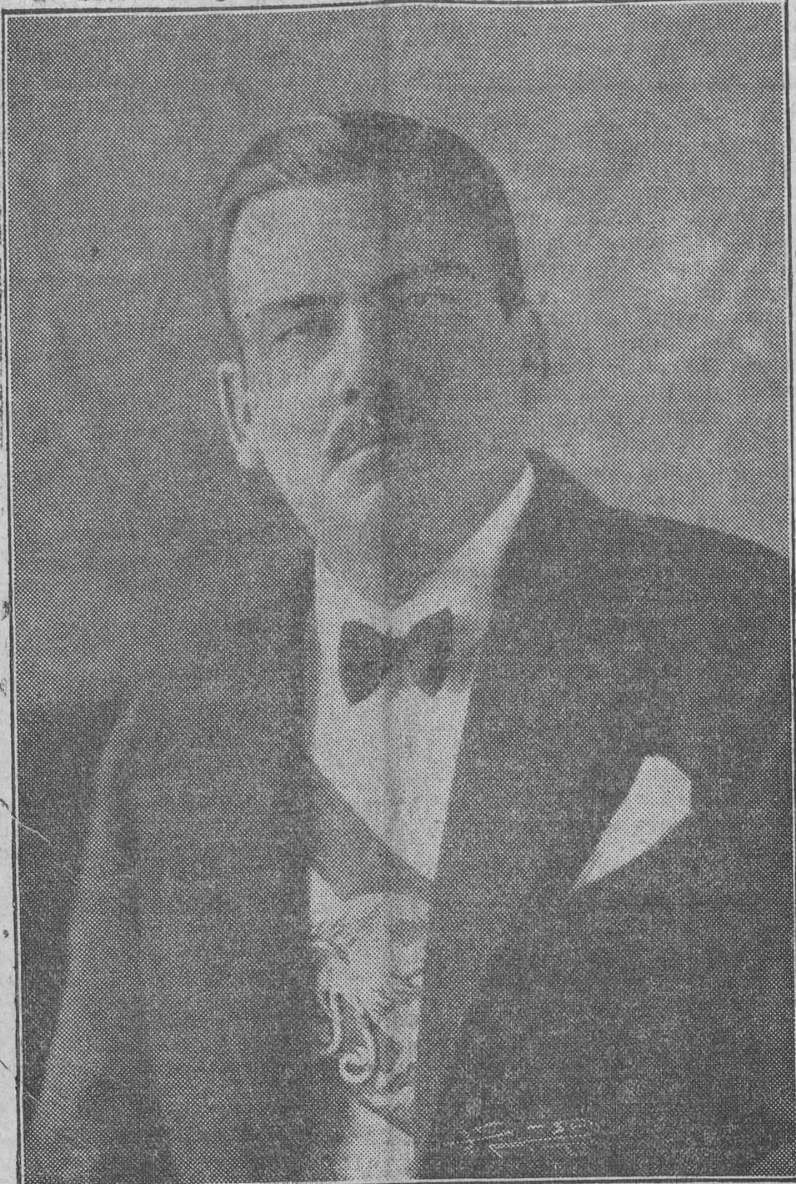
DON PLUTARCO ELIAS CALLES CIUDADANO PRESIDENTE DE LOS EE. UU. MEXICANOS