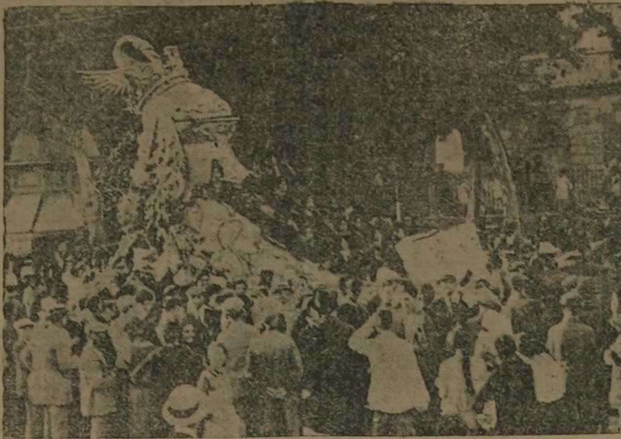
Lo Drac Alat, último carro que figuraba en la cabalgata de ayer. (Foto, Vidal).

El Jurado para la Batalla Estará formado por el alcalde, presidente de la comisión de Batalla señor Rosat, el representante del ejército coronel de Artillería señor