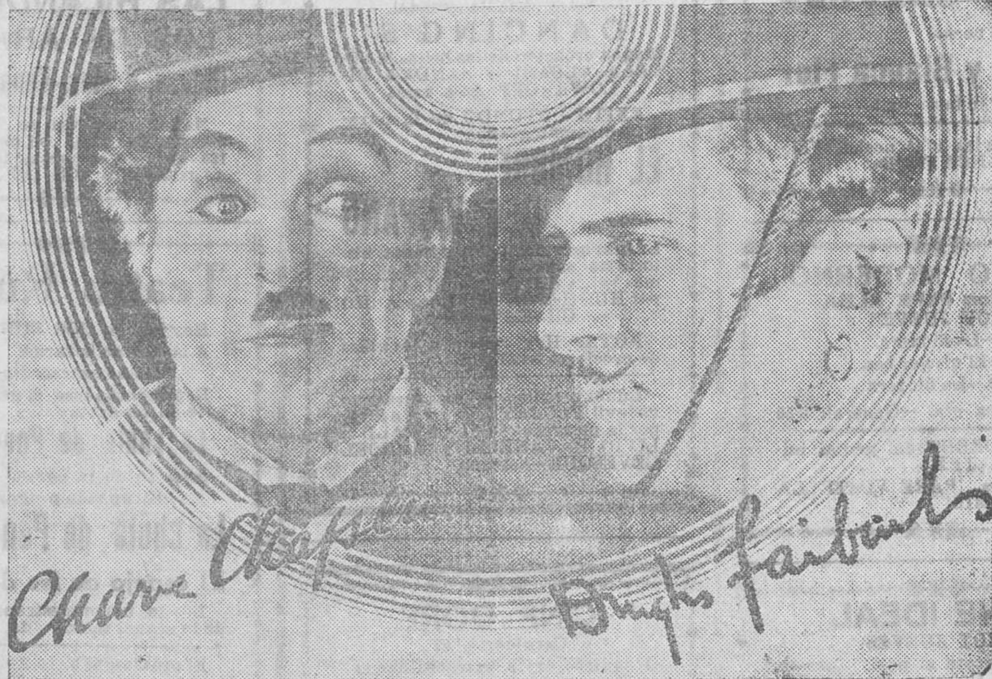
Charles Chaplin Douglas Fairbanks

La Metro Goldwyn Mayer obtiene al presente efectos espectrales en impresiones tomadas al aire libre, haciendo uso de los fotógrafos del invento de John Seitz. Este invento elimina el método de exposición débil para obtener «apariciones» y es admirablemente sencillo en su mecanismo. Mister Seitz aplica las leyes prismáticas para fotografíar escenas que normalmente se encontrarían fuera del foco de la cámara. El prisma separa los rayos que penetran en la cámara fotográfica, permitiendo, por ejemplo, que Ernest Torrence, colocado junto a la cámara, y Joan Crawford, situada exactamente detrás de la