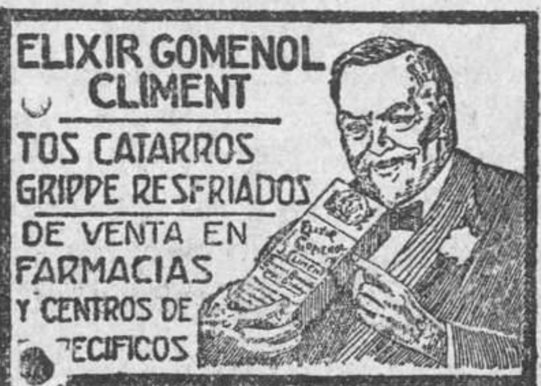
ELIXIR GOMENOL CLIMENT

En la Asociación de Caridad Sin el aparato de que suelen rodearse estos actos—así los creamos nosotros más eficientes—se verificó el día de Nochebuena en la Asociación Valenciana de Caridad el reparto, entre los pobres, de las regaladas por los comerciantes y las adquiridas para este fin por la benéfica institución, ya que aun siendo muchas las de que disponía, no bastaban para los muchos necesitados a quienes había que atender.