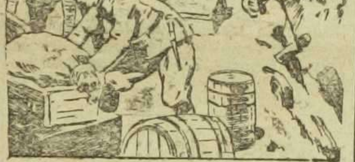
Forma en que el ejército italiano tiene que transportar los víveres a sus posiciones de los Alpes