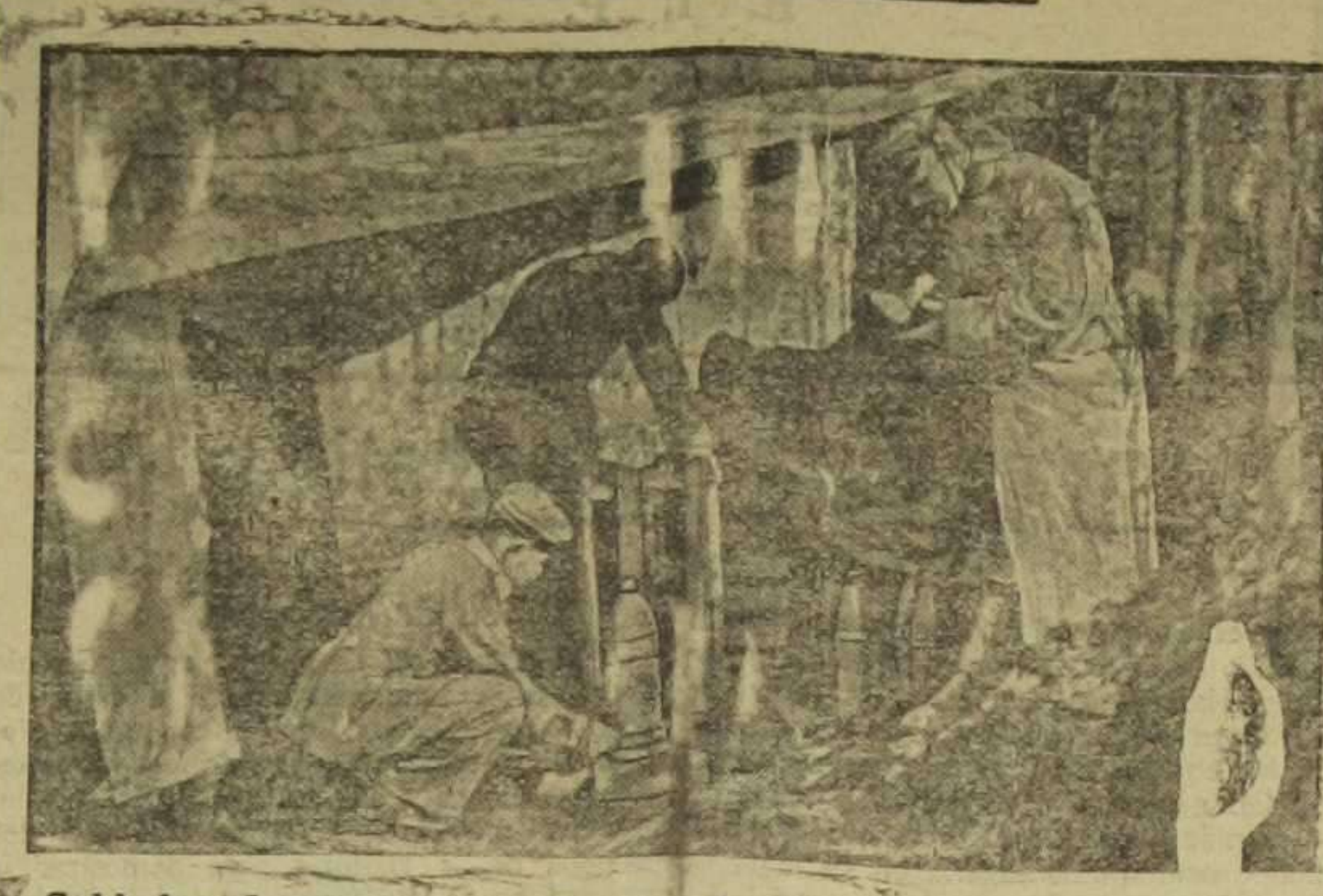
Soldados alemanes contando granadas detrás del frente de batalla