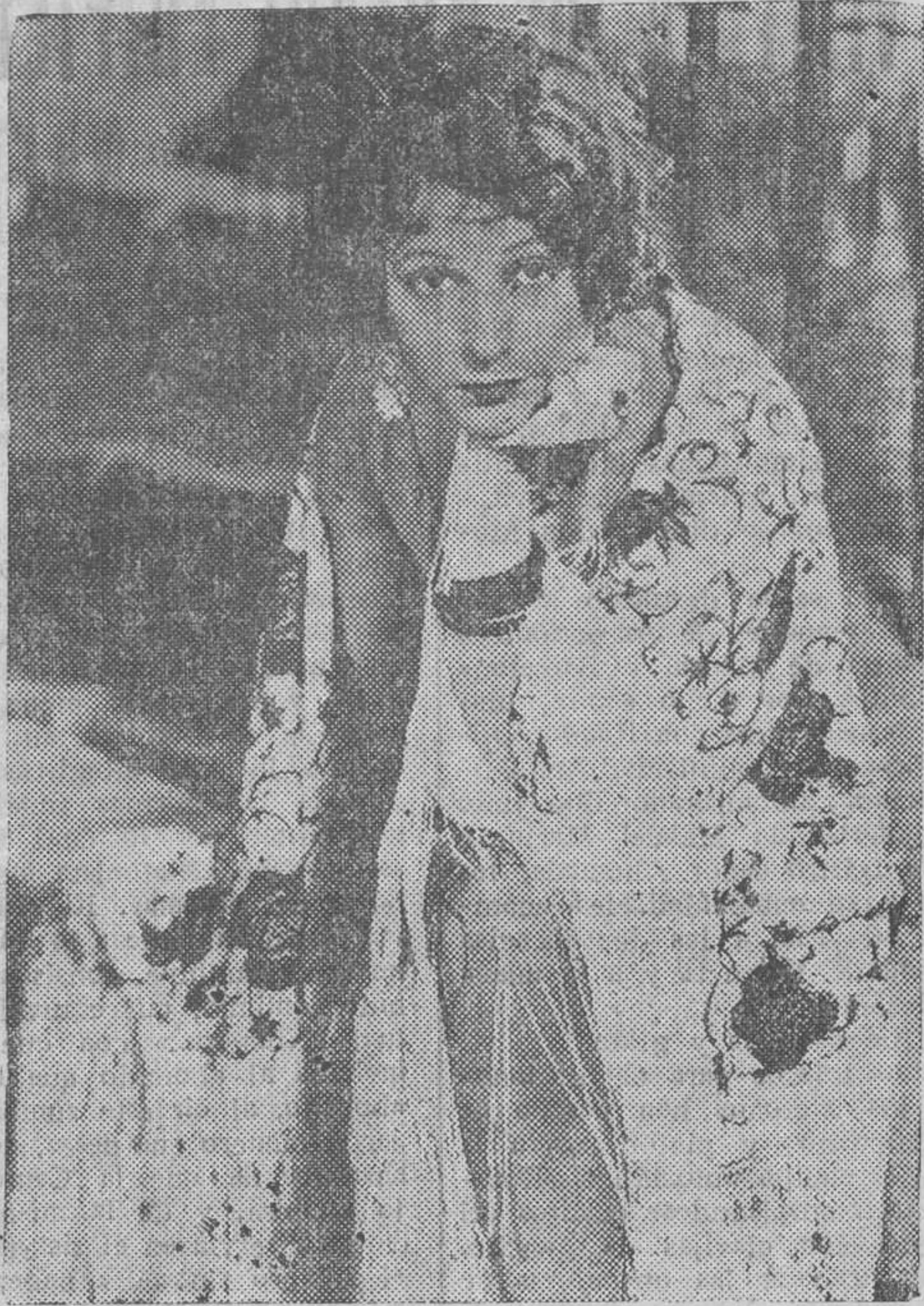
NORMA TALMADGE como aparece en su última película con LUIS ALONSO titulada «EL MEJOR CABALLERO», de ARTISTAS ASOCIADOS

Durante la próxima temporada, la Paramount dará a conocer al público nuevas estrellas y artistas de indiscutible mérito, como Charles Rogers, desconocido ayer y que hoy figura entre los más grandes actores de la cinematografía. De la inmensa popularidad de Charles Rogers podrá juzgar el lector cuando sepa que la correspondencia que diariamente recibe este joven actor es tan considerable como la de Clara Bow, y esto que Clara