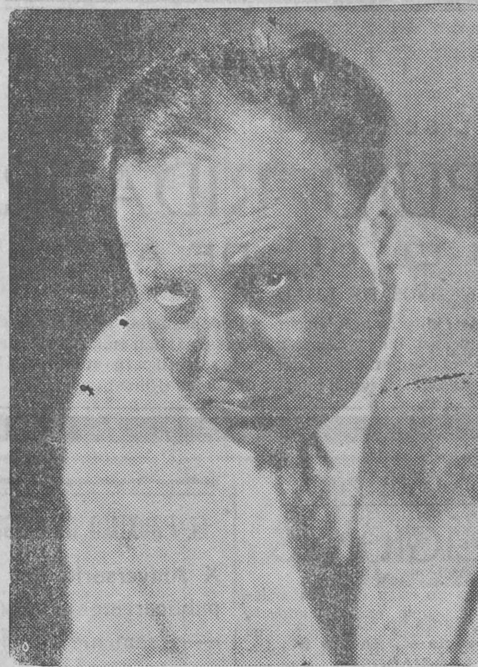
El actor EMIL JANNINGS, intérprete del personaje Augusto Schilling, en la gran film PARAMOUNT «EL DESTINO DE LA CARNE» que se está proyectando en el TEATRO LIRICO