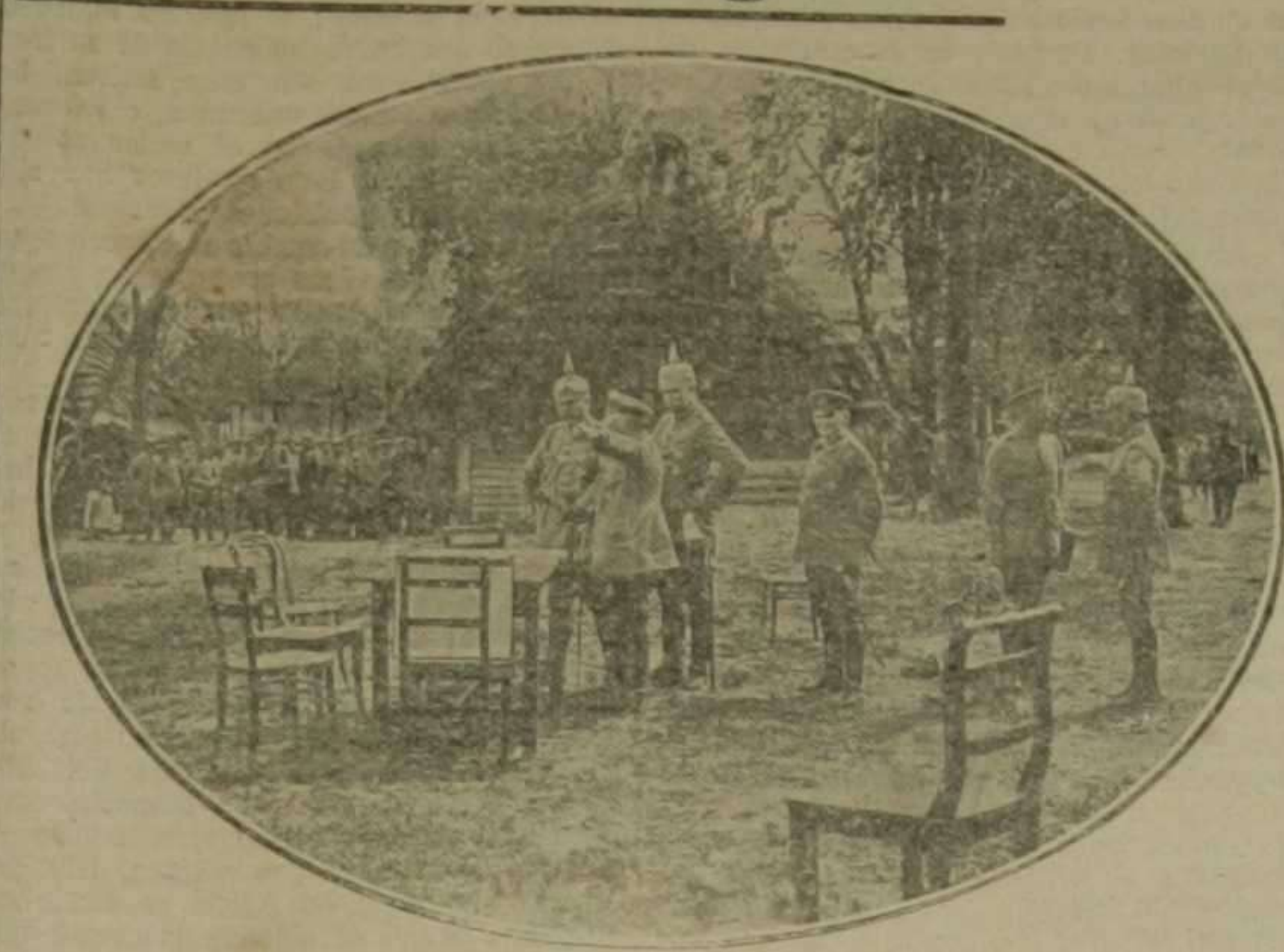
El kaiser con su Estado Mayor examinando sobre el mapa la situación de las tropas alemanas en Pinsk