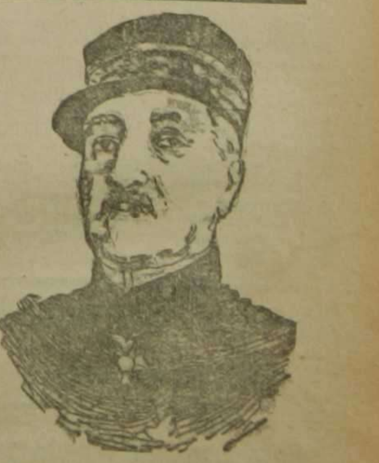
El general Castellan

que ha sido nombrado segundo del general Joffre o jefe del Estado Mayor de éste.