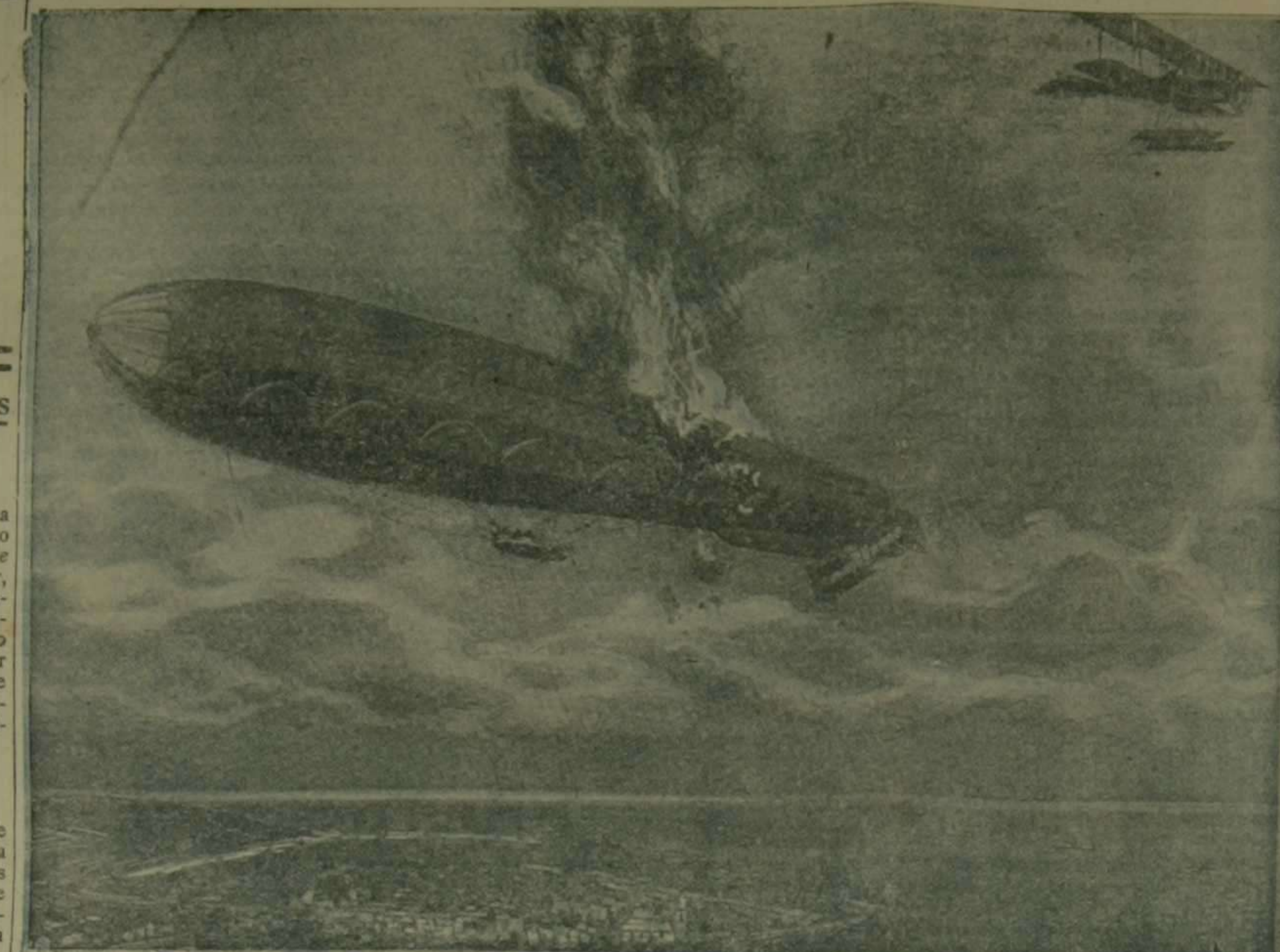
El avión austro-húngaro "L. 48", destruye la mañana del 8 de Junio de 1915, junto a la isla de Lussin, el globo italiano "Citta di Ferrara", tipo P, conteniendo 4700 metros cúbicos, velocidad 60 km., longitud 63 m., diámetro 12 m., motores 160 caballos de fuerza

Giro postal La Dirección general de Comunicaciones ha llegado a un acuerdo con Holanda para el establecimiento del cambio por giro postal desde 1.º de Diciembre próximo. Se admitirán giros por correo para todas las estaciones de Holanda. La moneda para este giro será el florin oro, equivalente a 100 céntimos. El máximo que podrá girarse serán 1.000 pesetas, o sea 480 florines con 80 céntimos.