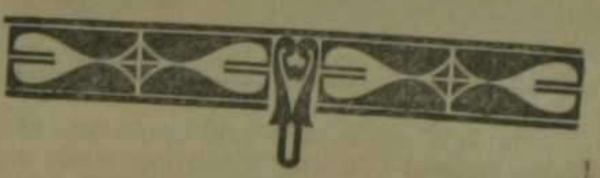
Las gemelas de la colonia africana

se han recibido grandes saídos en lanas, franelas, sábanas, mantelería, toallas, lienzos y géneros de punto. Modelos para la próxima temporada de abrigos, batas, blusas, etc.—TALLERES para toda clase de encargos a medida.—Precio fijo