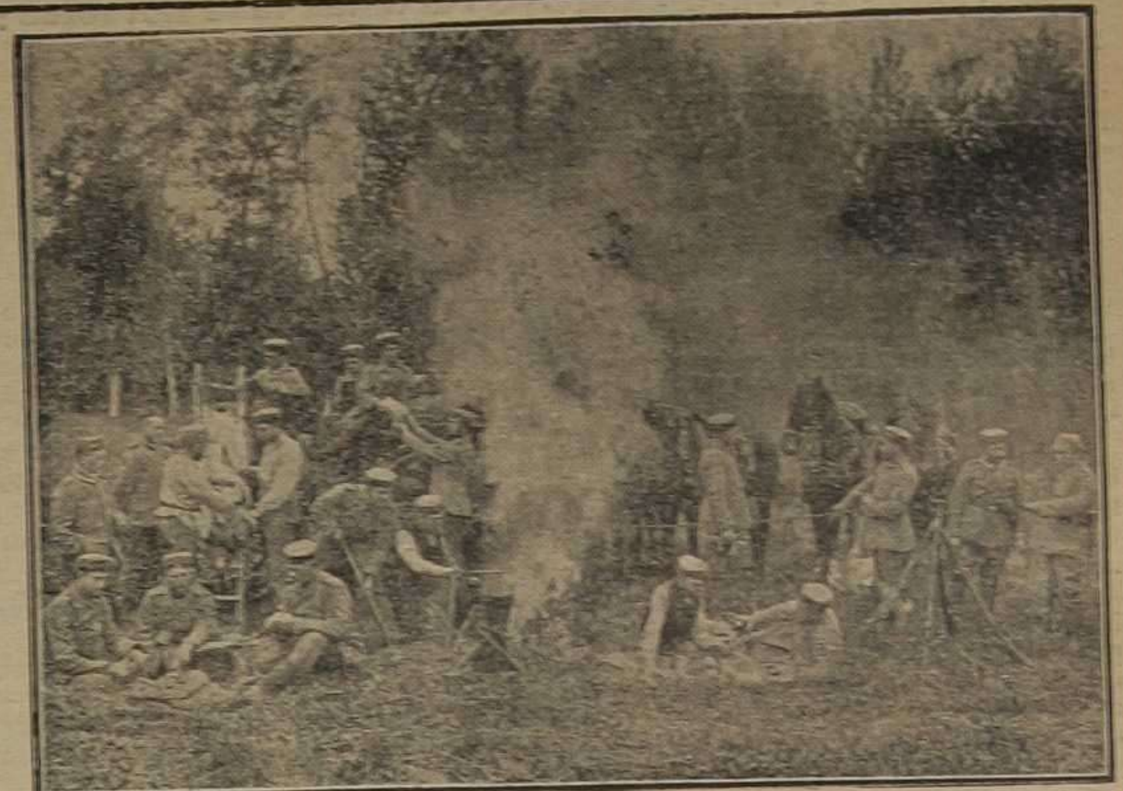
Campamento alemán cerca de las dunas del Mar del Norte, al Sur de Ostende y próximo a Nieuport