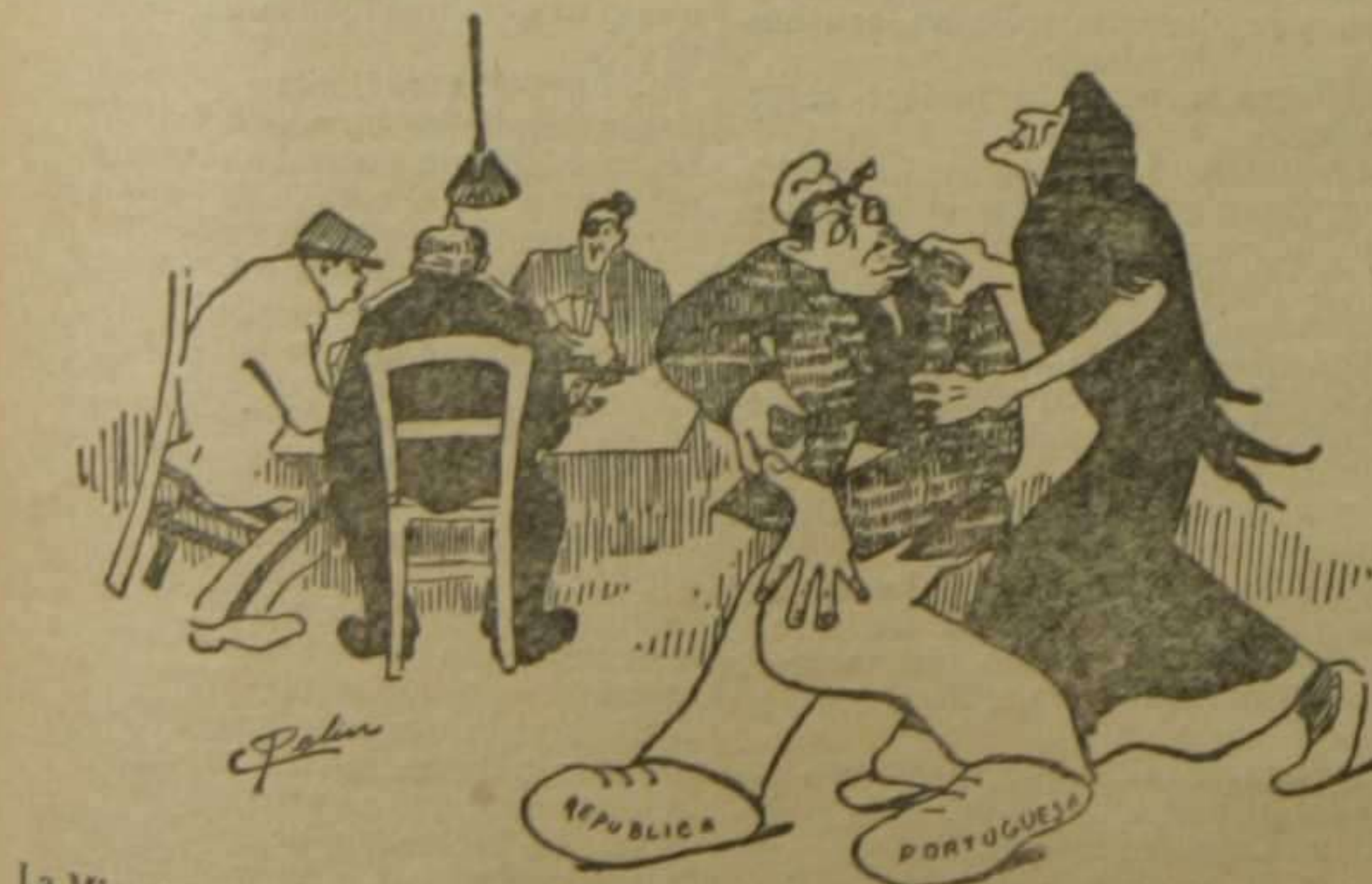
La Misericordia, a su marido.—Pero dónde vas, desdichado. El marido.—Su íteme, voy a perder mi último duro?