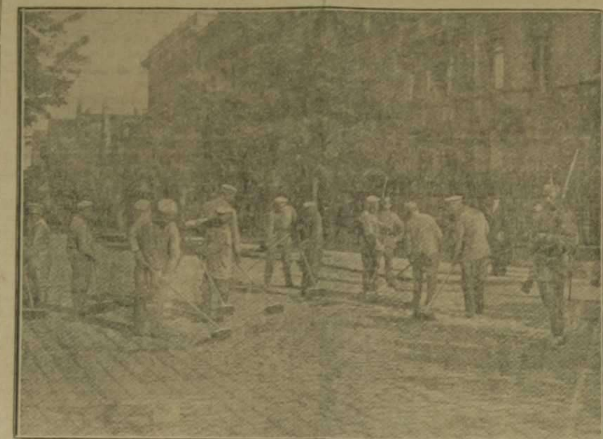
Prisioneros rusos a cargo de barcos de guerra en Berlín