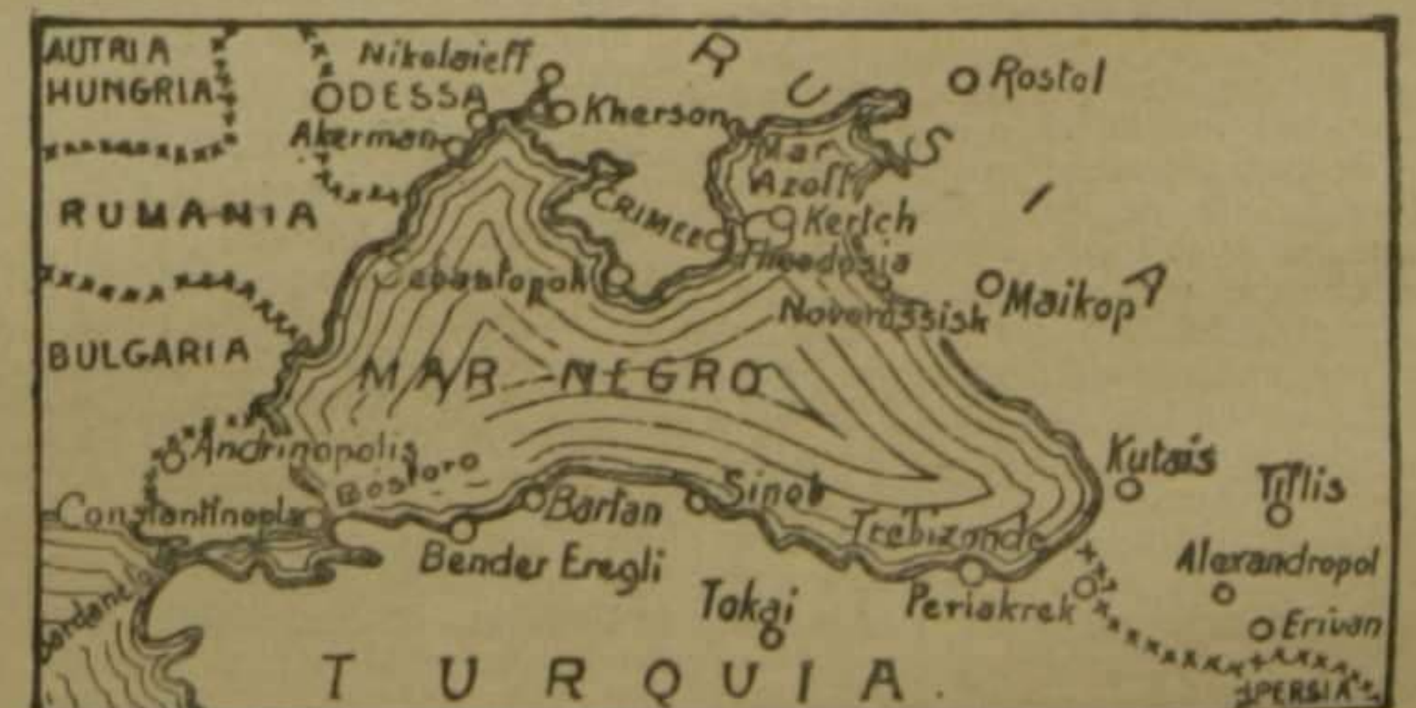
Gráfico del mar Negro