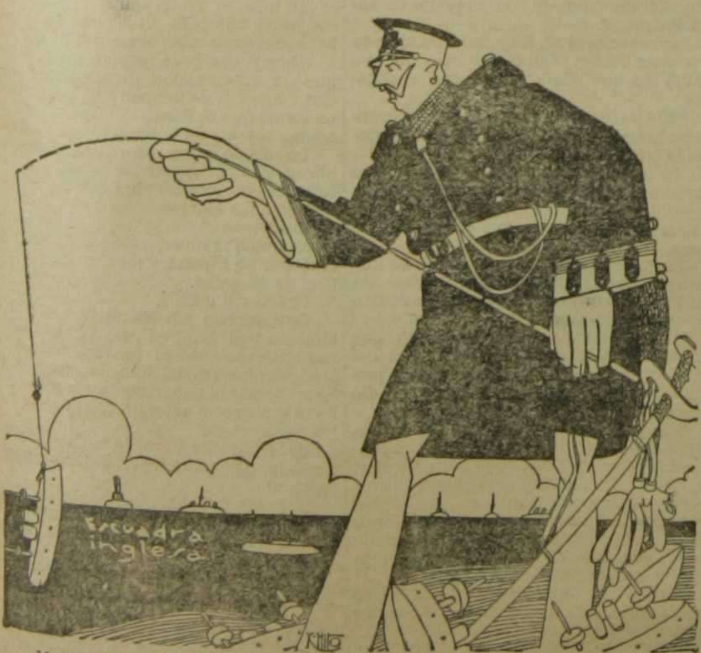
Y dijo el emperador: Con paciencia y una caña...

Noviembre depurativas antisépticas de sangre recomendación profesor Girolamo y droguerías Y COMPAÑIA LONA Canas Se traspasa OPOSICIONES PROXIMAS Tinta negra Monte de Piedad Caridad Fuera canas Se venden En casa particular GENERAL ESPAÑA Comp. VALENCIA antes Valencia