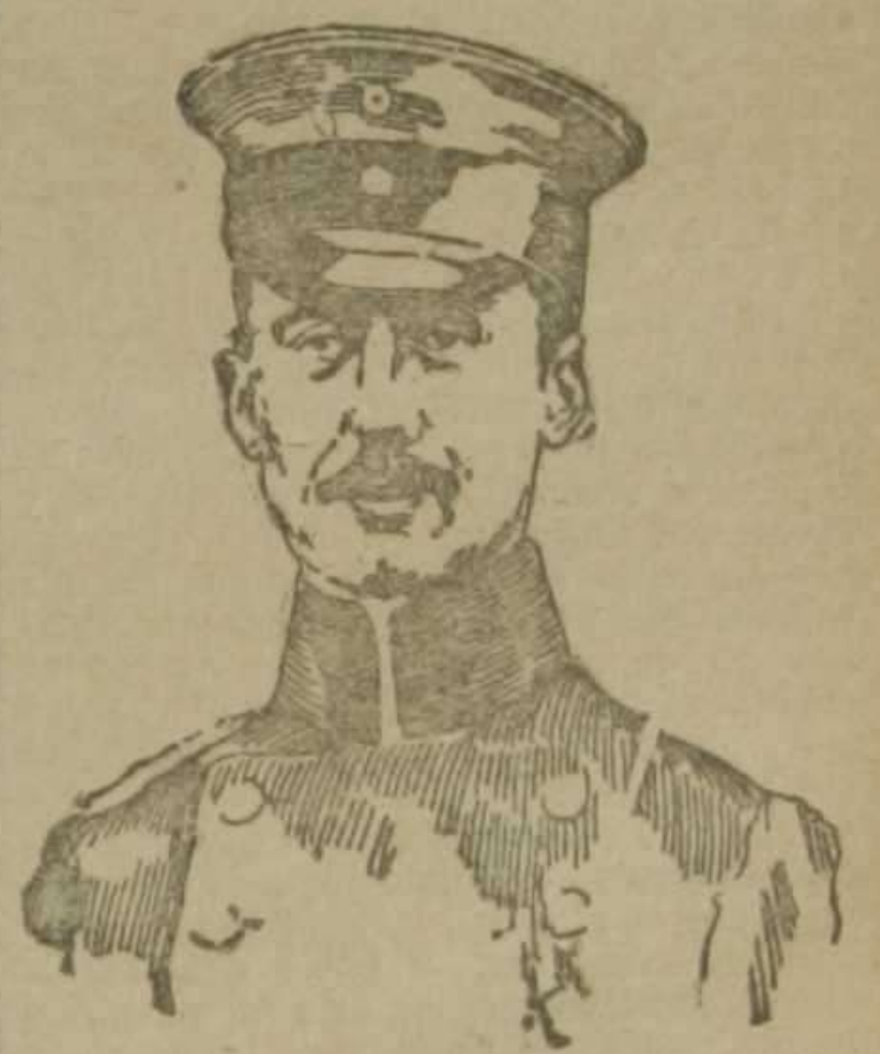
El príncipe Oscar de Prusia, hijo tercero del emperador Guillermo, gravemente enfermo del corazón a consecuencia de las impresiones recibidas en la batalla del Oise

D. Fernando de Baviera es un hombre agradable, culto, sensato, de una mo-